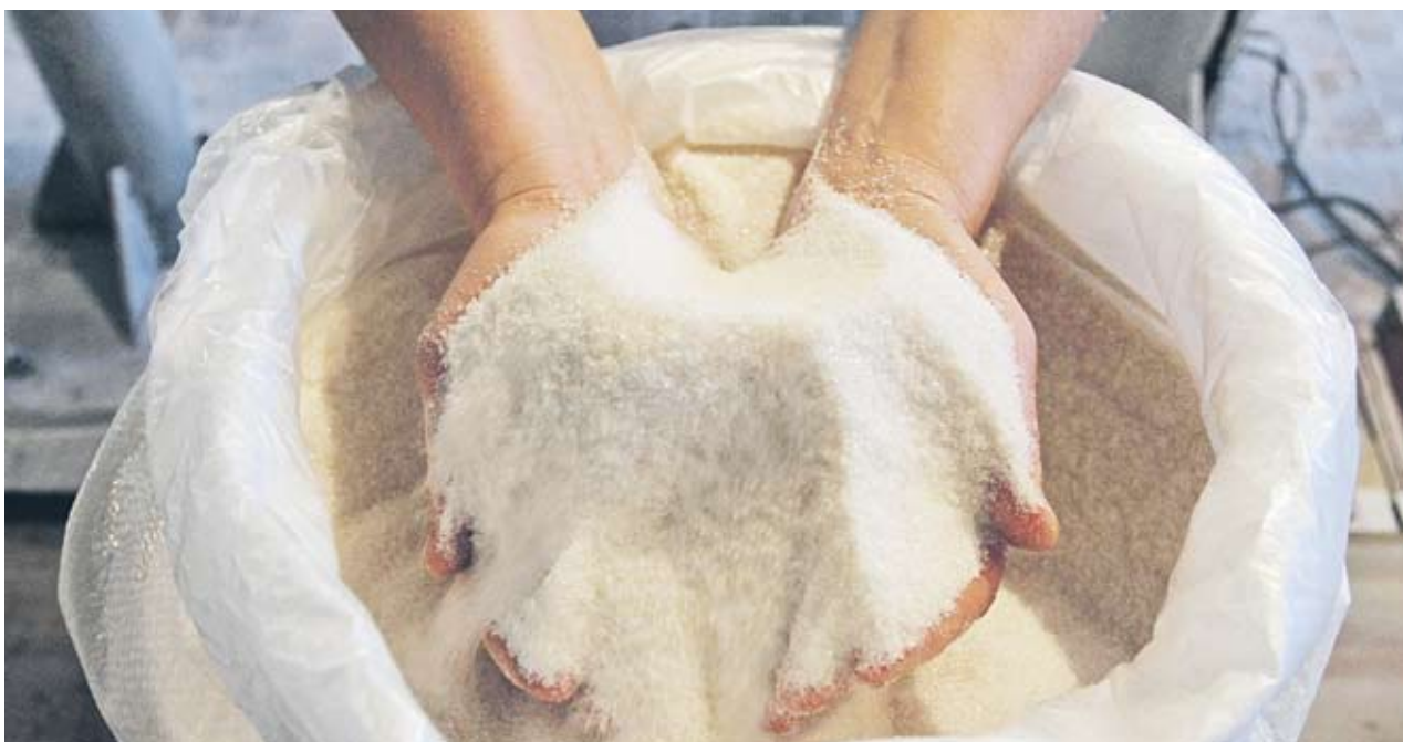
▶ Захарта е единствената основна земеделска стока, произвеждана в САЩ, която е обект на квоти за внос