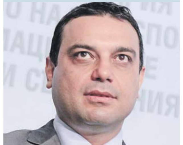
Ивайло Московски, министър на транспорта

„ Всички се обединихме около тезата, че оздравителният план за БДЖ трябва да се направи така, че от следващата година да не е губещо предприятие. Това е важно не само за заема от Световната банка, но защото ще създаде възможност през този програмен период да се получи някаква сума за влакове от европейските фондове. Това може да стане само и единствено тогава, когато БДЖ не е губещ. Това не е ставало от 14 години и не е лесен процес