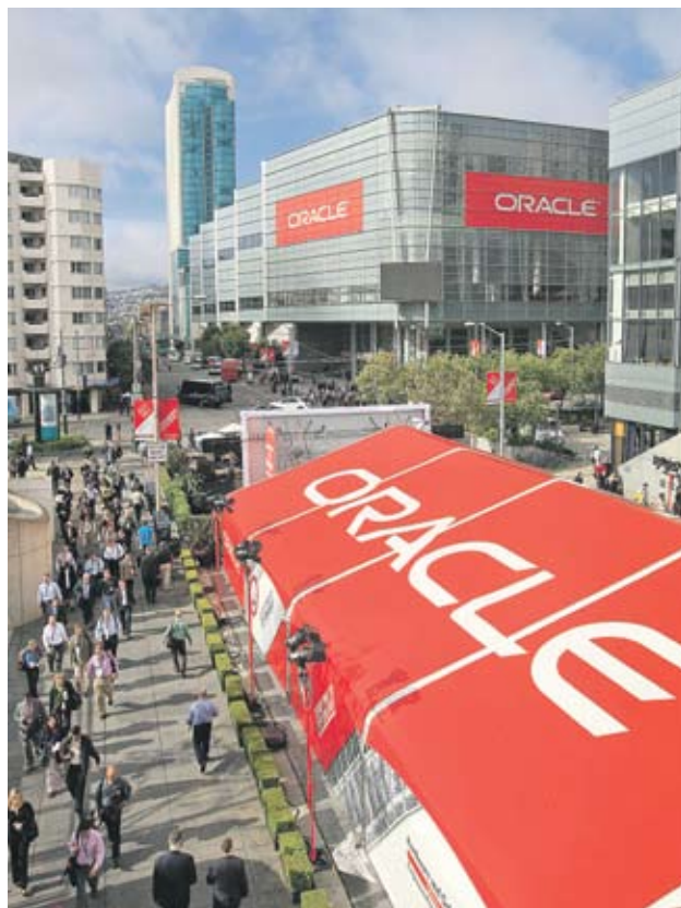
► Досега компанията погълна над 70 компании в "шопинг" за 40 млрд. USD

След като остави сливанията, Oracle ще се фокусира върху това, което вече