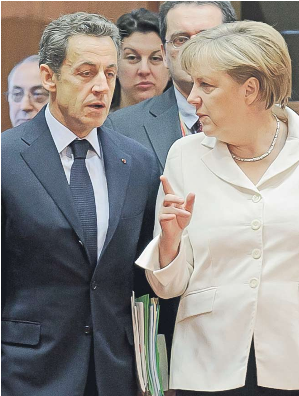
► Никола Саркози иска парите от Европейския механизъм за финансова стабилност да се използват за рекапитализиране на банките, докато Ангела Меркел смята, че това трябва да е последната стъпка

Централно място в разговорите на Меркел и Саркози е какво да се прави по гръцкия казус, така че да бъдат стабилизирани банките заемодатели, които са засегнати от обезценяването на държавните облигации. Колапсът на белгийската банка Dexia - първата жертва на кризата - добави усещане за неотложност на преговорите. “Dexia ще бъдат сред темите, които се обсъждат, но основна тема са Гърция и еврозоната, тъй като