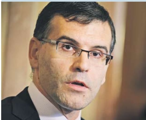
Симеон Дянков, финансов министър

„ Всички се обединихме около тезата, че оздравителният план за БДЖ трябва да се направи така, че от следващата година да не е губещо предприятие. Това е важно не само за заема от Световната банка, но защото ще създаде възможност през този програмен период да се получи някаква сума за влакове от европейските фондове. Това може да стане само и единствено тогава, когато БДЖ не е губещ. Това не е ставало от 14 години и не е лесен процес