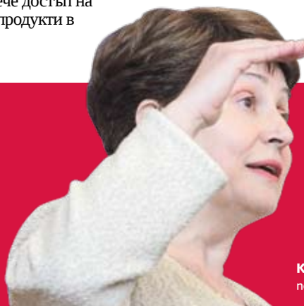
Кристалина Георгиева, еврокомисар по хуманитарната помощ