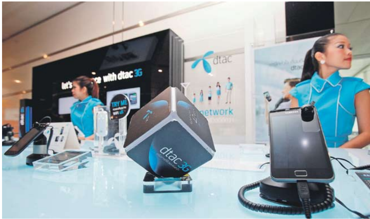
► Южнокорейската компания увеличи продажбите си след второто тримесечие, когато пусна в продажба Galaxy S II

кационни устройства скочи със 76% до 1.99 трлн. вона, докато общите продажби в целия сектор са се увеличили с 28% до 14.21 трлн. вона, сочат изчисленията на анализатори, потърсени от Bloomberg.