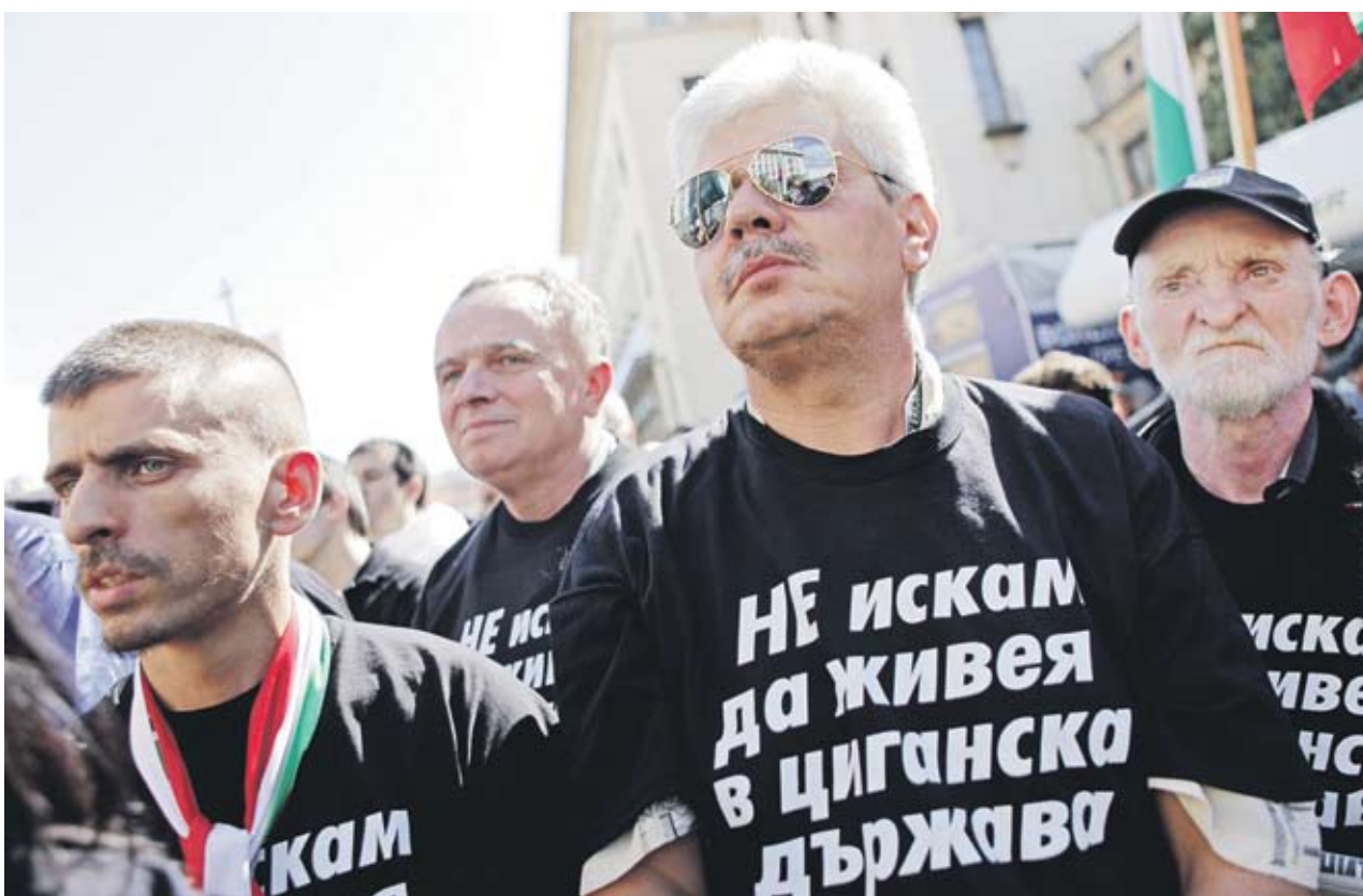
► Слег убийството в Катунца прегу 10 дни в страната всеки ден има протести

В Катунца няма представители на клана Рашкови, които биха могли да нагнетават допълнително напрежението, обясни междувременно главният секретар на МВР Калин Георгиев. Той отрече полицията да е охранявала Рашков и неговото семейство. В района на село Катунца има достатъчно полицейско присъствие, но то се редуцира, тъй като действията на органите на реда не бива да дразнят и да притесняват гражданите, каза още Калин Георгиев.