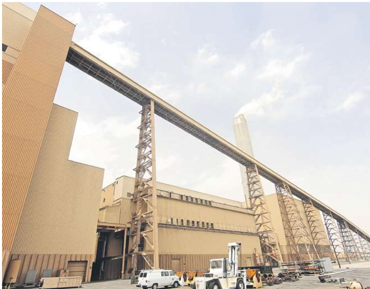
► Данните за септември отново върнаха опасенията за завръщане на рецесията

През септември испанските фабрики отбелязват спад с най-бързите за последните две години темпове. Понижението при френските производители е за втори пореден месец. Дори Германия, най-голямата и най-успешната икономика в еврозоната, отбеляза застой