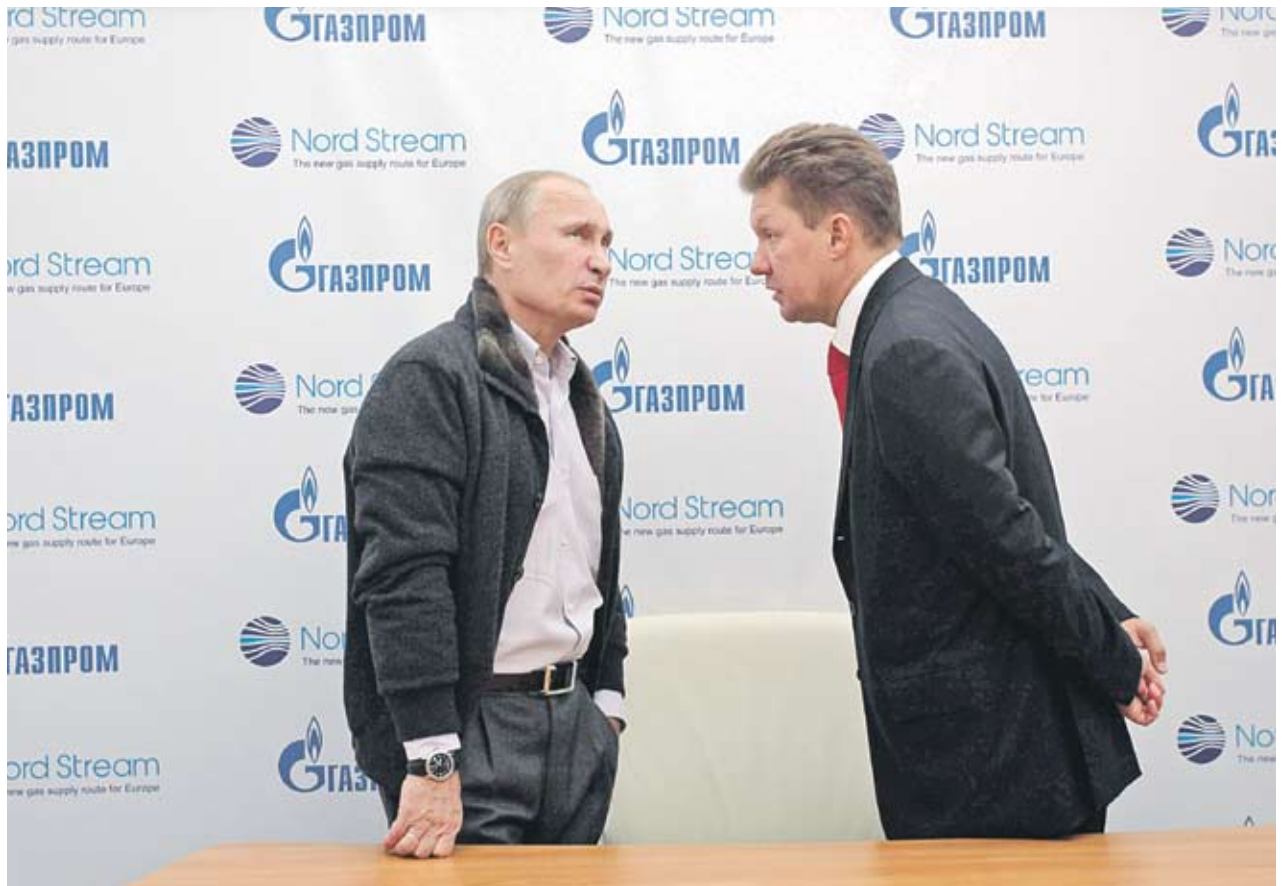
► На срещата между шефа на "Газпром" Алексей Милер и руския премиер Владимир Путин, двамата са обсъдили проверките на ЕК в "Газпром", както и стартовете на газопровода „Северен поток“