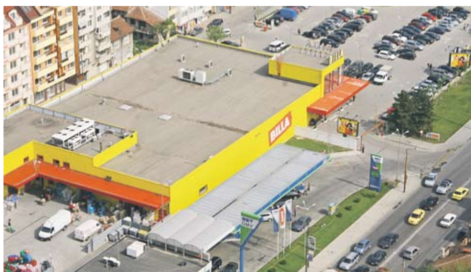
► През тази година експанзията на „Билла” е забавена, като бяха открити 2 магазина

„Разширяването на търговската мрежа на „Пикадили” е един от основните ни приоритети. Ангажимент-