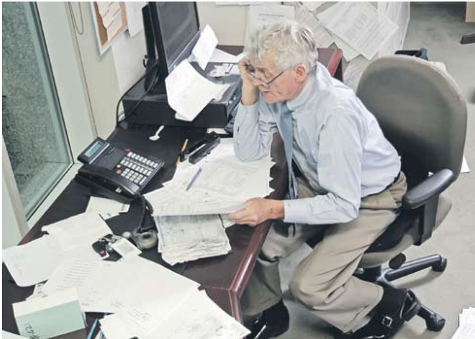
► Кризата се оказа най-трудна именно за малките и средните фирми

гарската банка за развитие съобщи, че новият приоритет ще бъде именно подкрепата за малките и средните предприятия. Според него банката ще