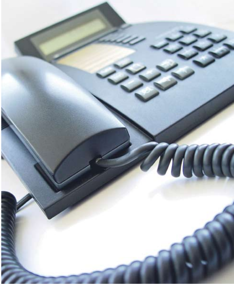
►Европейската комисия реши, че България е изпълнила задълженията си за осигуряване на преносимост на фиксирани номера

Причината за забавянето беше, че част от линиите в България се поддържат от по-стари аналогови централи