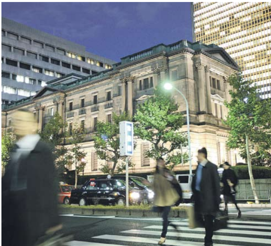
► Въпреки оптимизма големите фирми в страната планират да увеличат капиталовите си разходи с 3%, което е с 1.2% по-малко от по-ранните прогнози

Проучване на японската централна банка показва, че индустрията очаква подобрение на икономиката