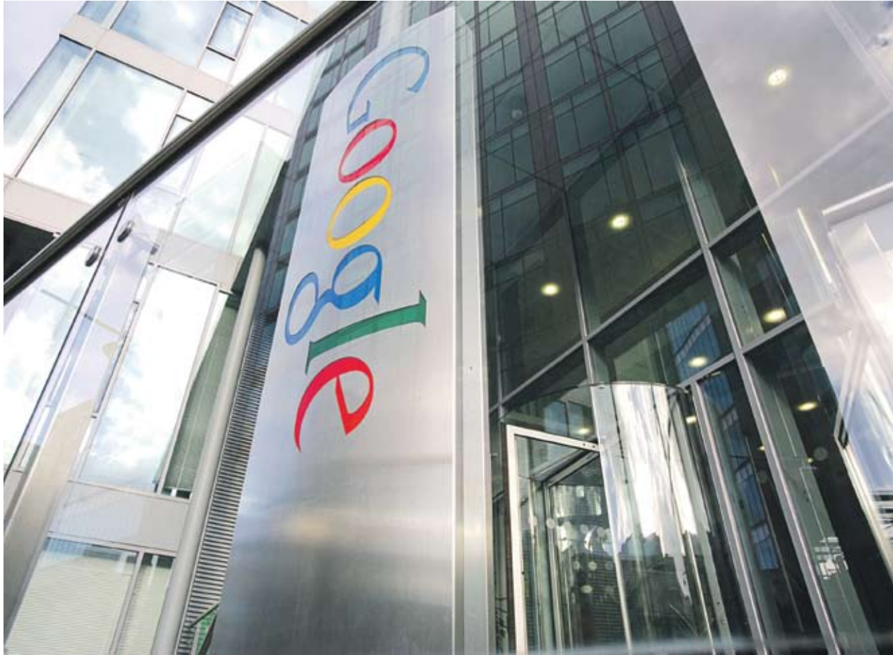
► От корпорацията се надяват новият погход да им донесе повече приходи

В рекламирането на търсачката ще се добавят и нови елементи като видео и снимки на продуктите. Досега рекламите в Google бяха само под формата на списък с обяви, които