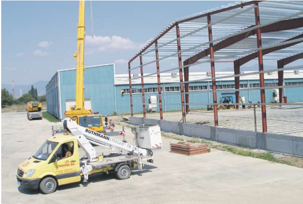
▶ Докато в началото в казанлъшкия завод работеха 68 души, днес броят им е 140

Предприятието в Казанлък произвежда взломоустойчиви и огнеустойчиви сейфове. Съвсем скоро ще започне и производство на огнеупорни, пожарозащи-