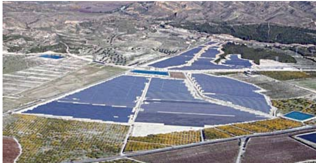
► Средногодишното производство на централите ще бъде 90 000 000 кВтч електроенергия

“ВСІ Казанлък Холдинг” ЕООД е инвестиционно дружество, регистрирано на територията на община