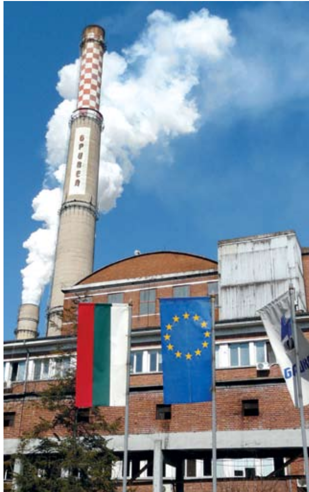
► "Брикел" ЕАД възстанови работата си след близо тримесечно принудително спиране

Предприятието все още не е подписало Акт 16 и в момента е в етап на изпроб-