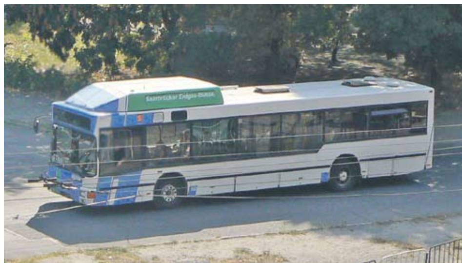
► До края на 2011 г. ще тръгнат още поне 5 метанови автобуса

За купуването на първите 10 автобуса са инвестирани