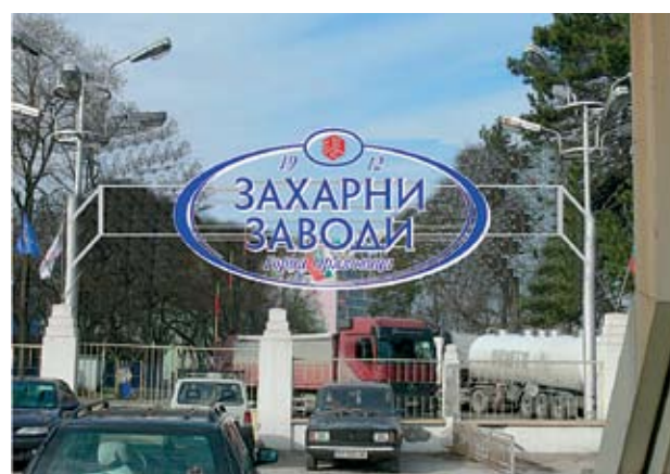
►„Захарни заводи“-Горна Оряховица остава в Топ 100 на проспериращите компании

1912 г. е основано чешко-българското акционерно дружество, от което започва съвременната история на Горна Оряховица.