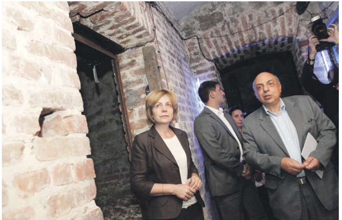
► Кметът на София Йорданка Фангъкова присъства на началото на реконструкцията на музейната инсталация в централната софийска Синагога. Инсталацията заема пространството в криптата на Синагогата и ще разчита на съвременни средства за визуализация, звук и картина