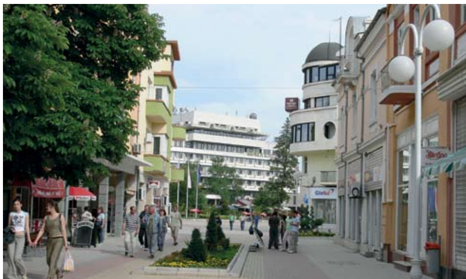
►Казанлък има потенциала да бъде елитен град и община

- Големите проблеми в общинското управление са свързани с липсата на добра екипност между местната законодателна власт в лицето на общинския съвет и общинската администрация в лицето на кмета на общината. Това е основната слабост на досегашното управление, което не позволяваше да има синхрон в работата с правителството. Това беше основната пречка, поради която не се сбъднаха желанията и очакванията на гражданите. За съжаление фактите говорят, че в Казанлък има много пропуснати ползи в областта на кандидатстването и усвояването на европейски пари. Пропуснати са възможности по всички оперативни програми. Точно европейските пари биха дали видим ефект върху икономическото развитие на града. За това в момента инфраструктурата е в много тежко състояние, липсват инвестиции в междублоковите пространства, в спортни площадки и младежки дейности.