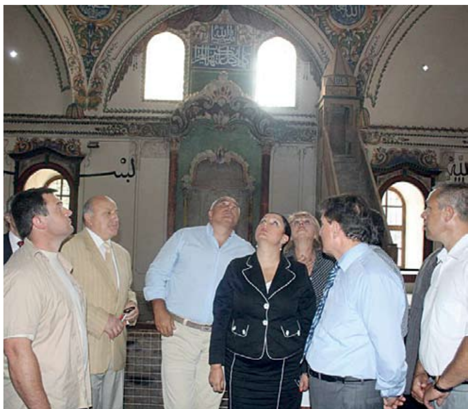
►Премьерът Бойко Борисов и министрите Лиляна Павлова и Вежди Рашидов прерязаха лентата на Музея на религиите

диалог и етническата толерантност в Европа", каза по време на откриването министърът на културата Вежди Рашидов. Разработена е национална програма за развитието на културния туризъм в България и Стара Загора заема важно място в нея, допълни той. Горди