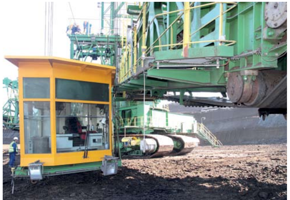
► Подобряването на факторите на работната среда е важно за осигуряването на безопасни условия на труд в рудниците на “Мини Марица-изток”