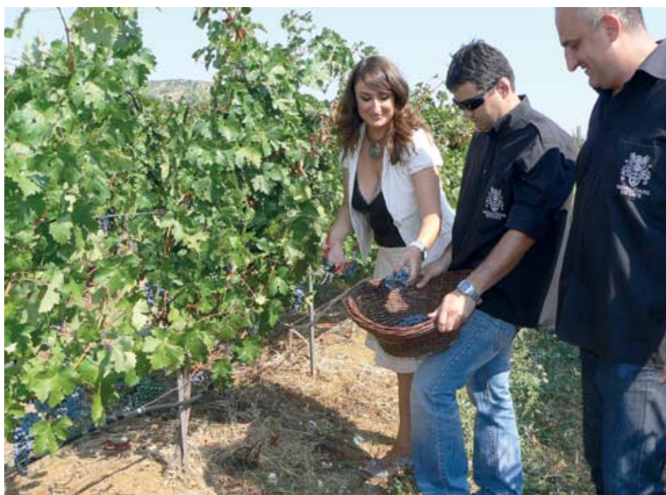
► "Мидалидаре Естейт" се опитва да пробие на пазара в Китай, като набляга на българската идентичност с вина във високия сегмент. На снимката екипът отпразнува началото на гроздобера

И сега имението, разположено на 20 км северозападно от Чирпан, привлича български и чуждестранни туристи. Районът е с хилядолетни винарски традиции. Още в древността