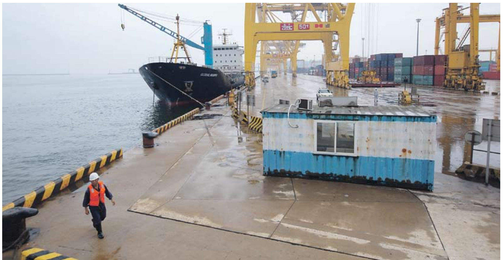
▶ Новите инвестиции може да увеличат товарния капацитет на страната до 42 млн. тона през 2014 г. от 25 млн. тона тази година

Страната се стреми отново да стане водач доставчик