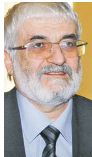
► Валери Димитров, председател на Сметната палата

В категория за най-добра журналистическа кампания, свързана с правото на достъп до информация, "Златен ключ" получиха репортери от вестниците "Сега" и "Дневник" заради публикациите си, съдържащи информация за практиката на МВР да получава