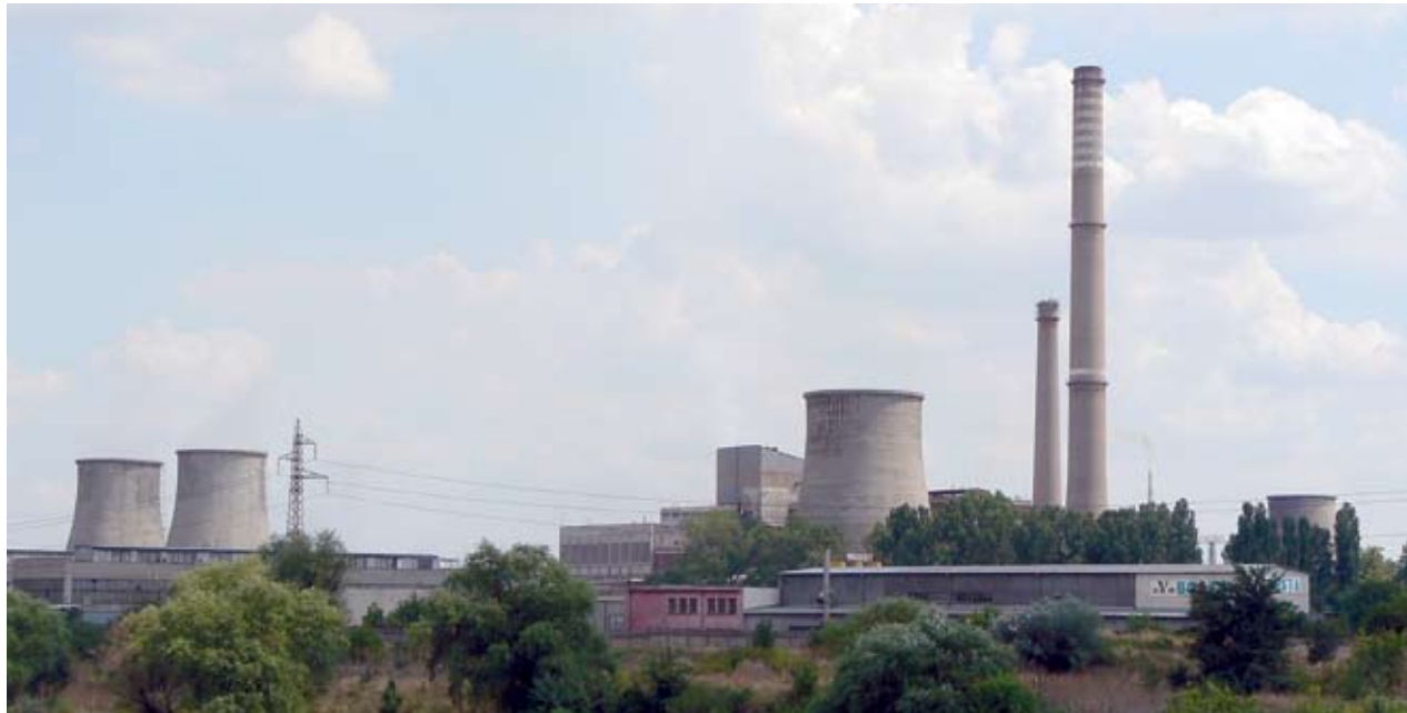
► Акционерите в ТЕЦ "Марица 3" АД Димитровград са взели решение за изграждане на СОИ и са осигурили необходимия ресурс за тази цел