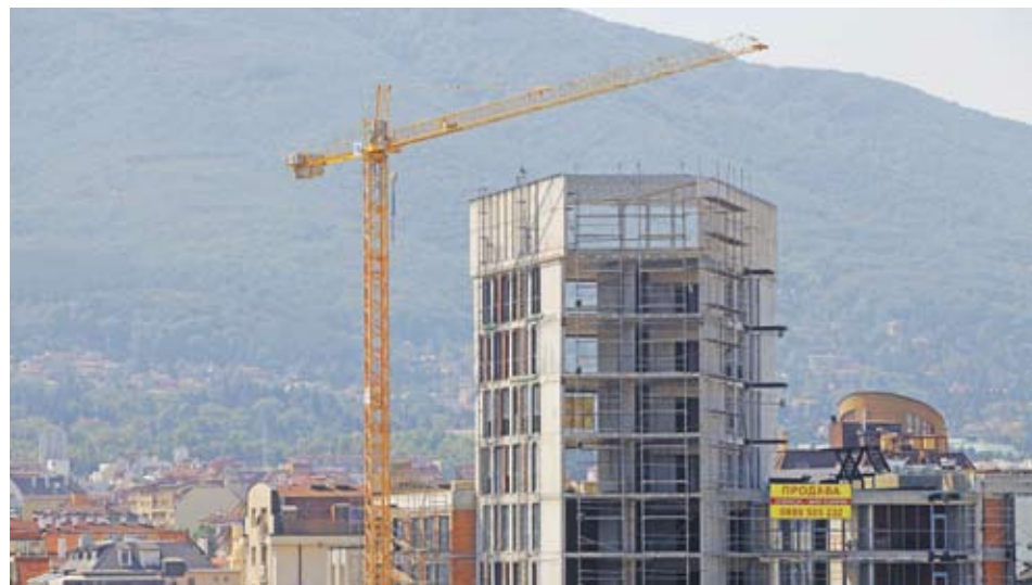
► България е на второ място по спад в строителството в ЕС. По-напред е само Словения

веднъж - през юни. На годишна база се отчита само спад. Най-голямото от тях е през април - 22.8%. Строителната продукция в България през второто тримесечие на 2011 г. спрямо второто тримесечие на миналата година е по-малко с 13.4%. Общо за ЕС спадът е едва 3%, а за еврозоната - 5.2%.