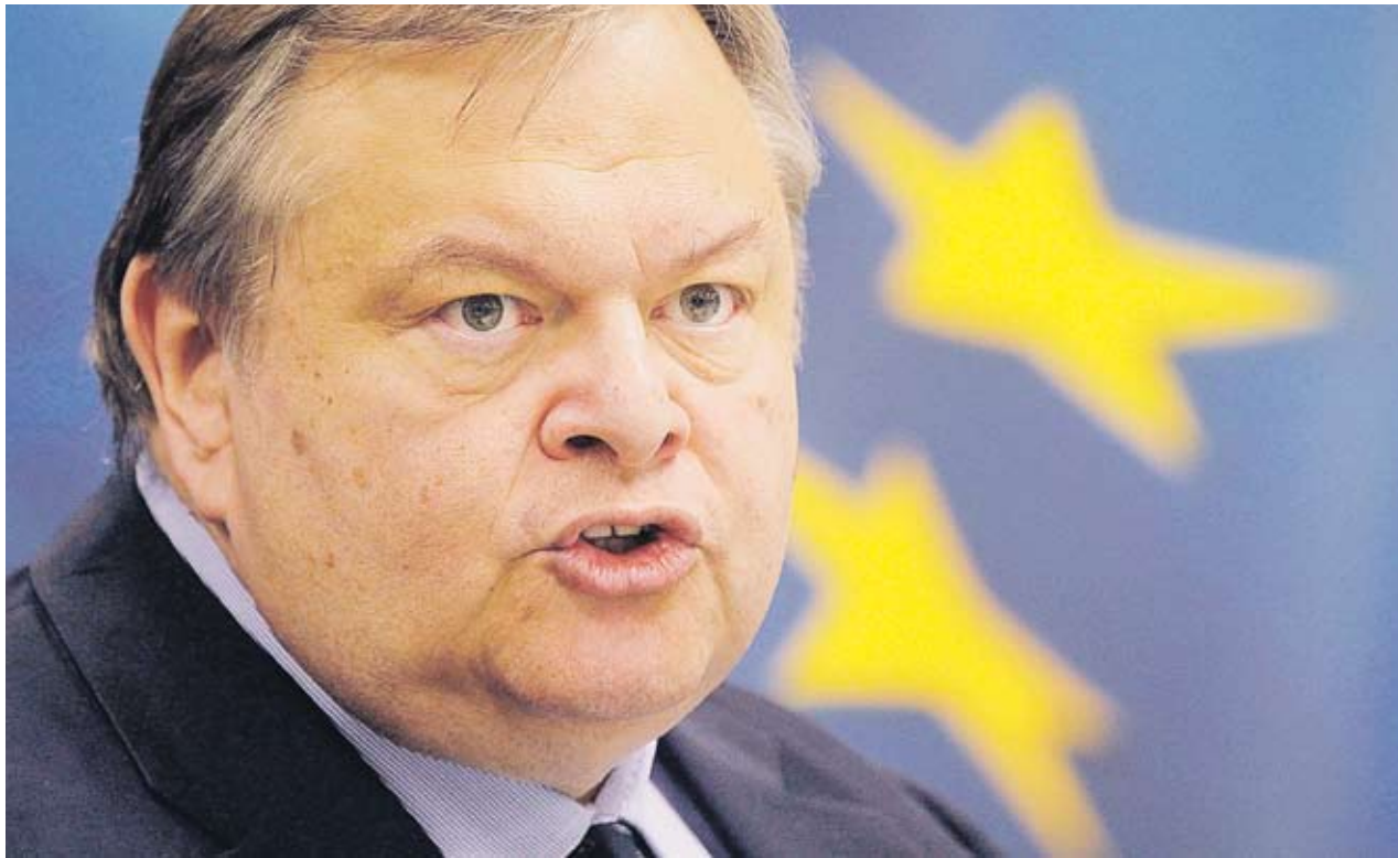
► Целите ни са да спрем да трупаме дългове и още от следващата година да генерираме излишък, каза гръцкият финансов министър Евангелос Венизелос

Гръцкият финансов министър Евангелос Венизелос обясни вчера, че целите на страната му за дефицита през 2011 и 2012 г. трябва да бъдат изпълнени, да се прекрати трупането на дългове