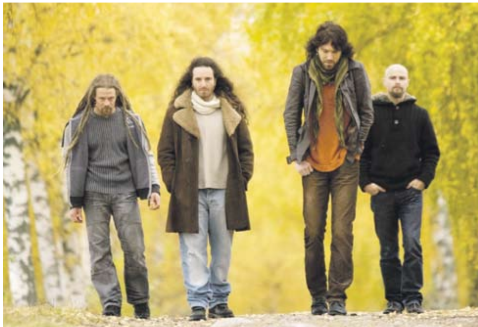
► Pain of Salvation са една от най-смелите групи в съвременния рок

която свири на сцената, а е дошла специално заради нея - с очакванията си и най-ценното - любовта към точно тази музика. Представяме ви селекция на най-интересното в музикалния ни живот през сезона есен/зима 2011.