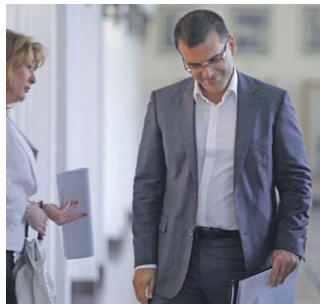
► Няма да има повишаване на данъците, но ще направим по-трудни ДДС измамите в няколко сектора, коментира в понеделник финансовият министър Симеон Дянков

Финансовият министър за пореден път се изказа положително относно работата на подчинените му приходна агенция и митници. По думите му НАП ще успее да навакса до края на годината заложените цели. „Последните 2 месеца вървят с близо 50 млн. на месец повече, отколкото трябва да направят, и ще наваксат”,