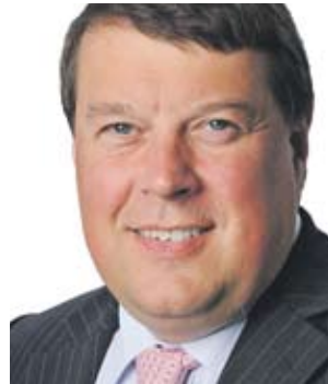
Губещ Тим Тоуки

Международната рейтингова агенция Fitch потвърди на 2-ия рейтинг на подкрепа на УниКредит Булбанк с изпълнителен директор Левон Хампарцумян. Това е възможно най-високата рейтингова подкрепа в момента заради ограничението, което идва от рейтинга на България ВВВ+. Fitch очаква УниКредит Булбанк да повишава рентабилността си до края на годината, както и през 2012 г. заради връщането към растеж на българската икономика.