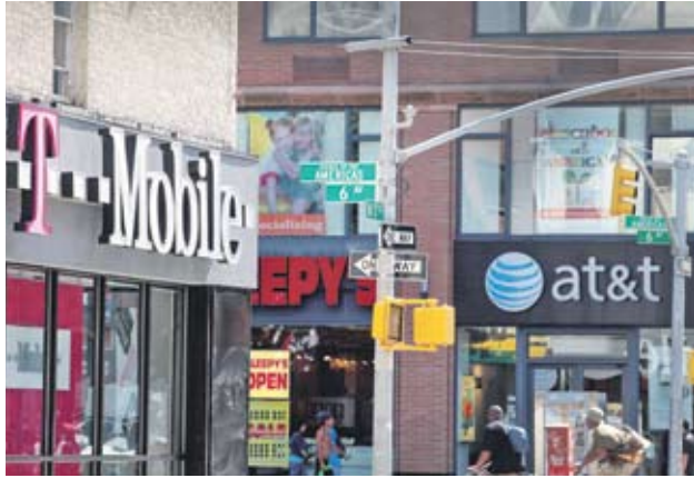
► Някои експерти смятат, че компанията може да реши, че разходите и несигурността при евентуално дело не си заслужават

Сделката ще доведе до по-високи цени и намаляване на конкуренцията, казват от правосъдното министерство на САЩ