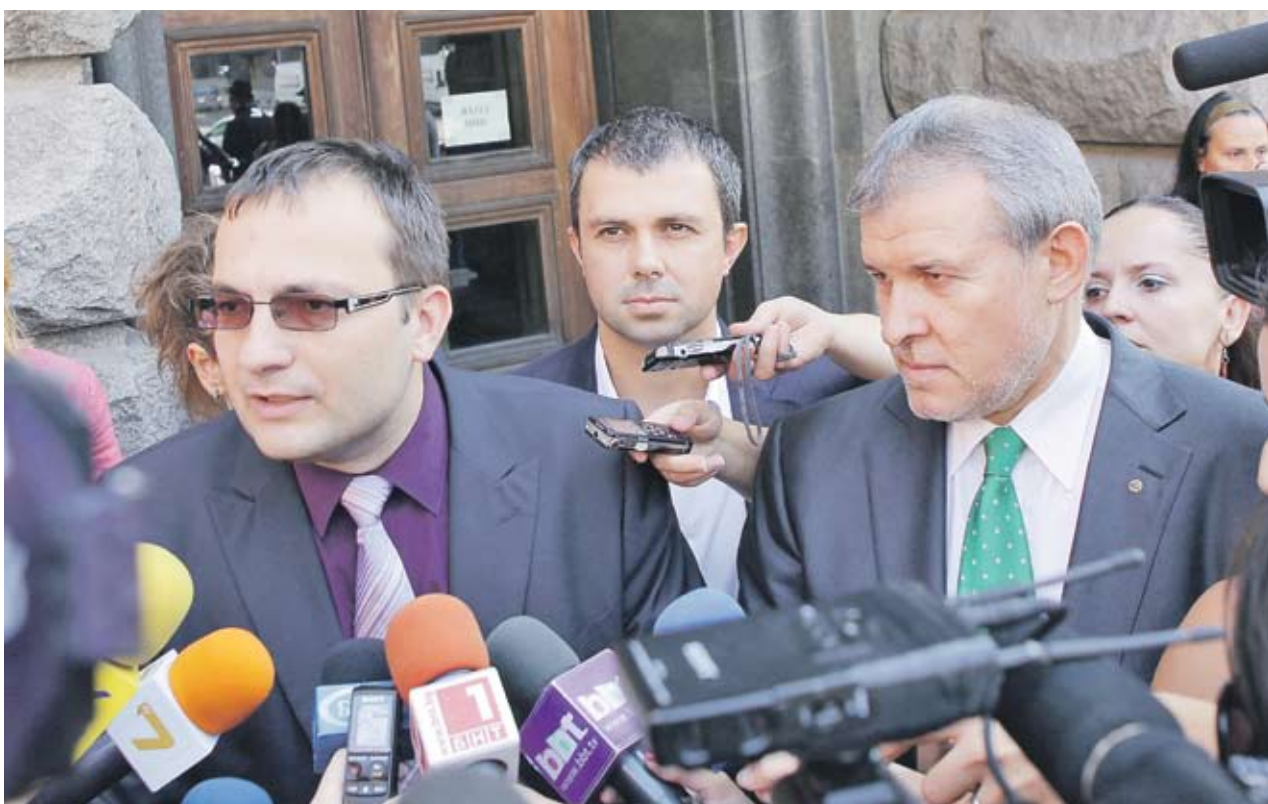
► Лидерът на СДС Мартин Димитров и кандидат-президентът Румен Христов след регистрацията на Съюз на десните сили в ЦИК

” В момента не мога да дам отговор дали Синята коалиция приключва. Това, че няма да правим самостоятелна регистрация, е подкрепа за спечелилия предварителните избори кандидат. А дали ще има кандидат за вицепрезидент, зависи от това дали ще има Синя коалиция и спазване на споразумението, така както е подписано. Ако до утрешния ден имаме резултат, всички договорености ще бъдат изпълнени. Ние в тази коалиция, в този състав не бихме могли да участваме по много причини и едната е, че те играят срещу нас на изборите