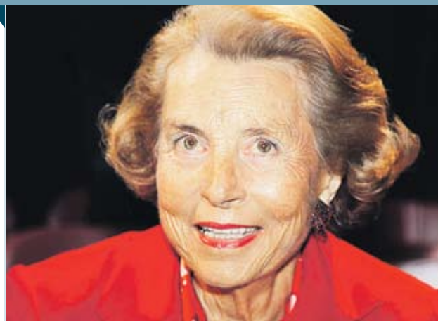
Най-богатата жена във Франция, наследницата на империята L'Oréal Лилиан Бетанкур, е една от 16-те подписали петицията за по-високи данъци

Френското правителство смята да въведе 3% допълнителен данък върху доходите на хората, които на година изкарват повече от 500 хил. EUR. Мярката е част от действията на кабинета за намаляване на бюджетния дефицит с 12 млрд. EUR през следващите