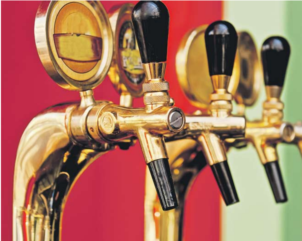
► Ейлт изисква специфични умения у бармана, който много внимателно трябва да постави кега, да го почуква на специални места, така че останалата мая да се утаи, и да го разсипва на ожагнелите си гости с ръчна помпа

В момента във Великобритания и Ирландия има поне 4000 производители на истински ейл, но никой не се наема да потвърди това число. В останалата част на света, в англо-саксонските държави като САЩ, Канада и Австралия, последните години също се появили хиляди малки пивоварни, като броят им расте с всеки изминал ден, а разнообразието включват портър, стаут, блед ейл, златен ейл, битер, лек битер, меки ейлове, ечеми-