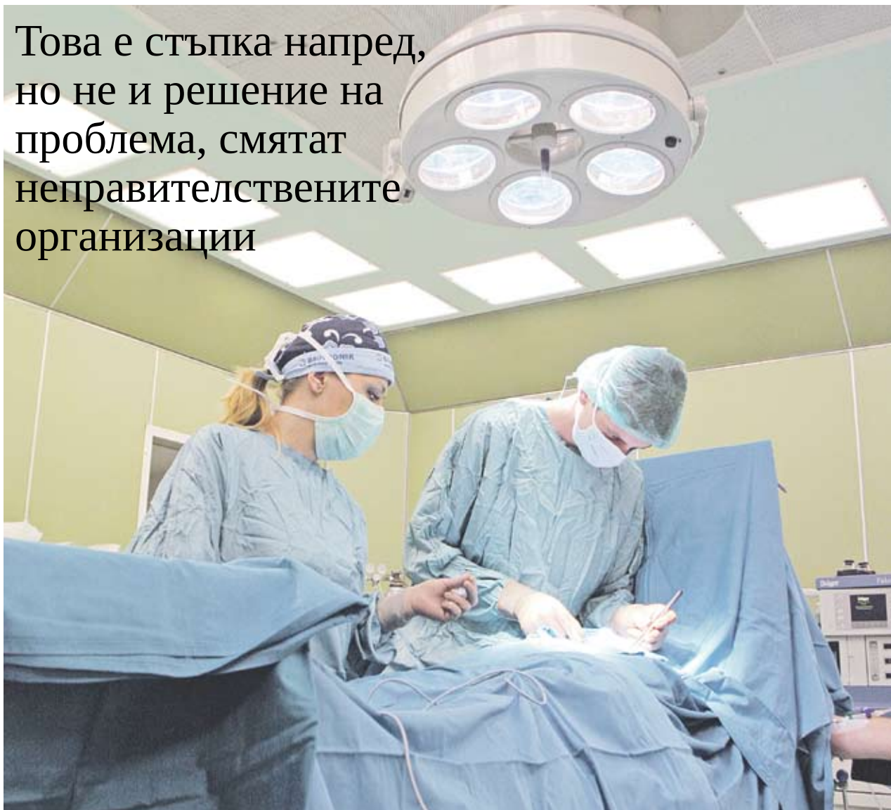
► Трансплантациите в чужбина струват между 150 хил. и 270 хил. EUR

Това е стъпка напред, но не и решение на проблема, смятат неправителствените организации