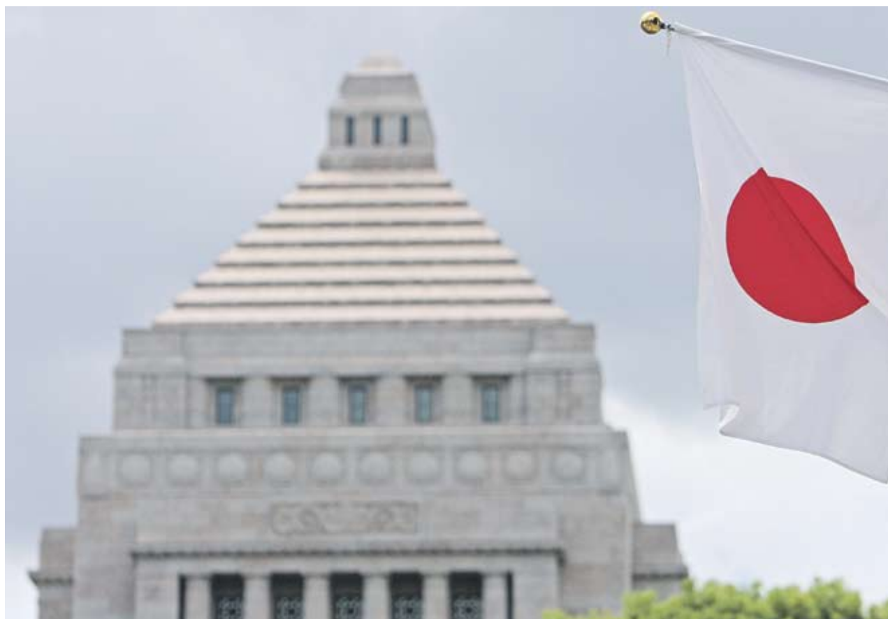
▶ Рейтинговата агенция предупреди през май, че може да понижи рейтинга на Япония заради все по-сериозните опасения, че страната не взема мерки, за да се справи с държавния дълг

Рейтинговата агенция предупреди през май, че