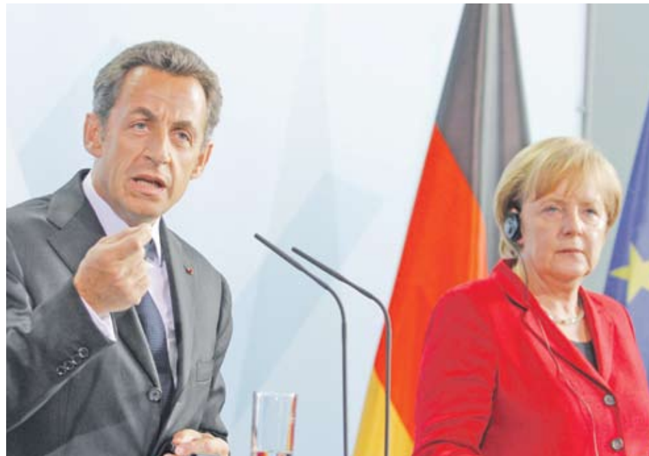
► Дори срещата между двамата лидери - германският канцлер Ангела Меркел и френският президент Никола Саркози - не успя да успокои пазарите в Еуропа. Индексите приключиха сесията във вторник със спадове

► Страните членки са отчетли увеличаване в търговския излишък със САЩ, Турция и Швейцария. Увеличение в дефицита има в търговията с Китай, Русия, Норвегия и Япония. Почти двойно е намалял дефицитът в търговията с Южна Корея. От всички страни членки на съюза най-голям излишък в общата търговия се наблюдава в Германия (+65.9 млрд. EUR), следвана от Холандия (+20.2 млрд. EUR) и Ирландия. Без изненада най-голям е търговският дефицит във Великобритания, Франция, Италия, Испания, Гърция и Португалия.