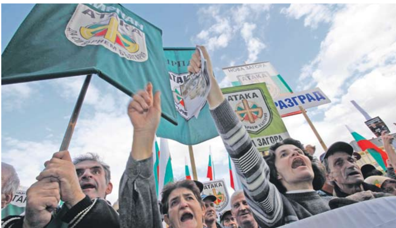
► Засега партия „Атака“ остава без лиценз за телевизия поне до следващото заседание на СЕМ