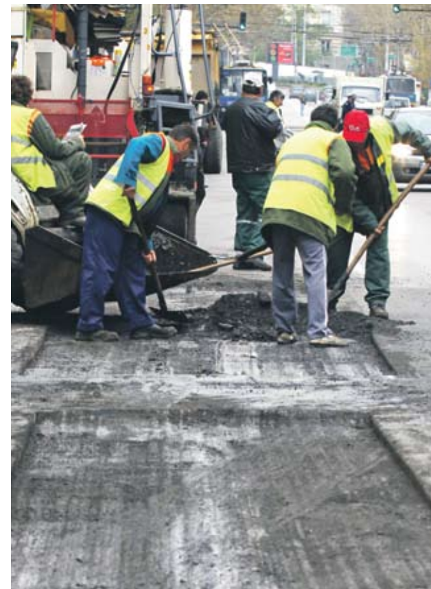
Добивните компании традиционно финансират инфраструктурни обекти в общините, в които работят

Носителят на миналогодишната награда за корпоративна социална отговорност през 2010 г. финансира проекти на обща стойност над 917 хил. лв., което е със 75.6 хил. лв. повече от предходната година. Даренията са част от социалната програма на дружеството за общините Челопеч,