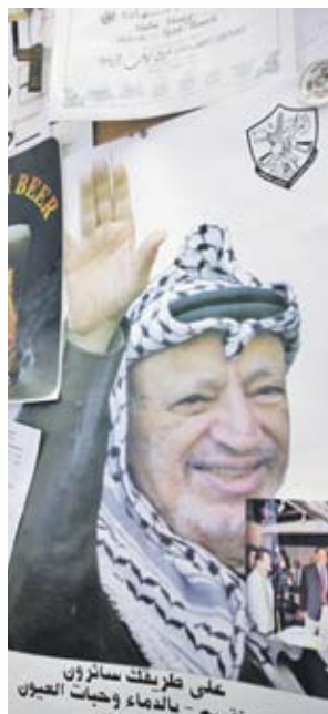
► Куфията е любимата кърпа за глава на Ясер Арафат

„Глобализацията позволи да се произведат по-евтини продукти, които всъщност въобще не се интересуват от идентичността на самия продукт. Едно от нещата, които ни обезпокоиха, беше, че масовото производство ще отнеме автентичността на продукта”, казва Касем пред ВВС.