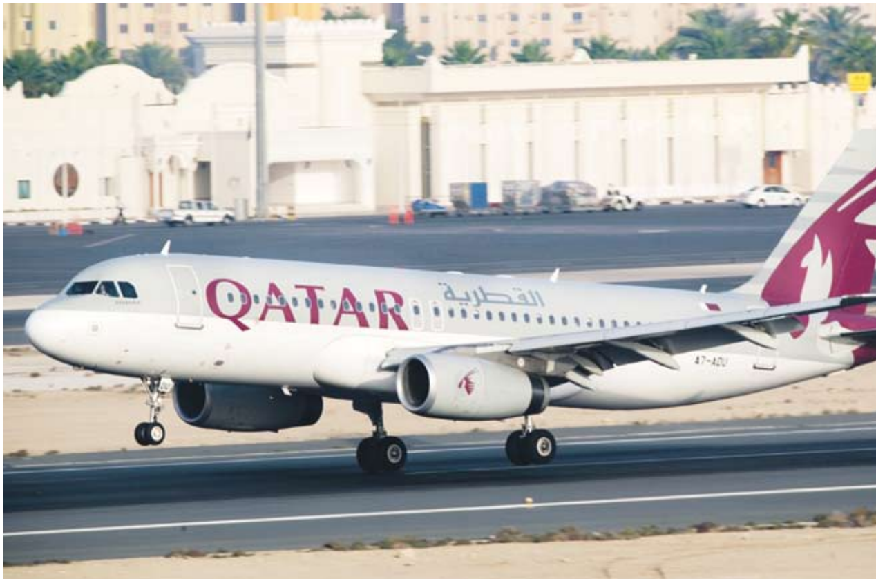
▶ Линията Доха - София ще се обслужва от самолету Airbus 320

От 14 септември авиокомпанията ще изпълнява 4 полета седмично