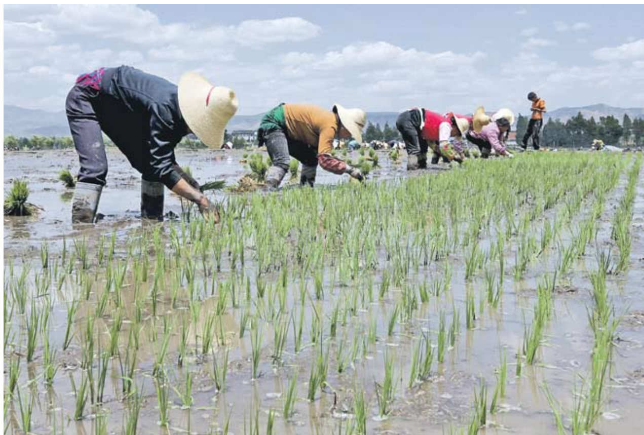
▶ Само от май госега цената на ориза се повиши с 15%

Индонезия ще внесе ориз за втора поредна година,