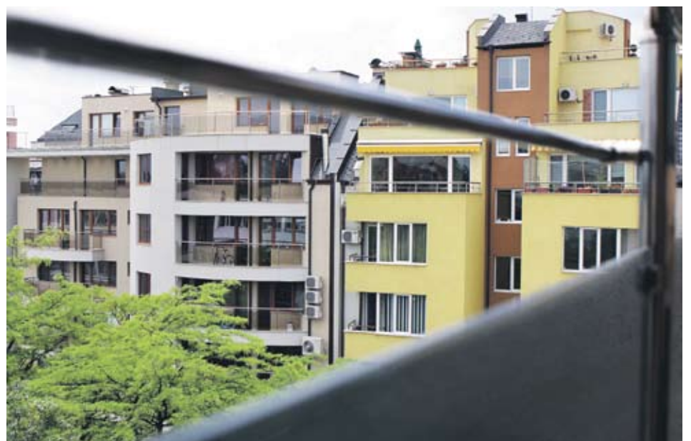
► “Промислено строителство - холдинг” се занимава основно със строеж на жилищни и офис сгради

Финансовите резултати на дружеството бяха силно засегнати от финансовата криза и за 2009 г. компанията отчете загуба от 207 хил. лв. Към края на март миналата година загубата достигна 414 хил. лв. Холдингът има шест дъщерни дружества - “Аркос - метал - Берковица - ПС” ЕАД, “Енергостроймонтаж - ПС - Б” ЕАД, “Белене, Завод за строителна техника” ЕООД, Плевен, “Промисле-