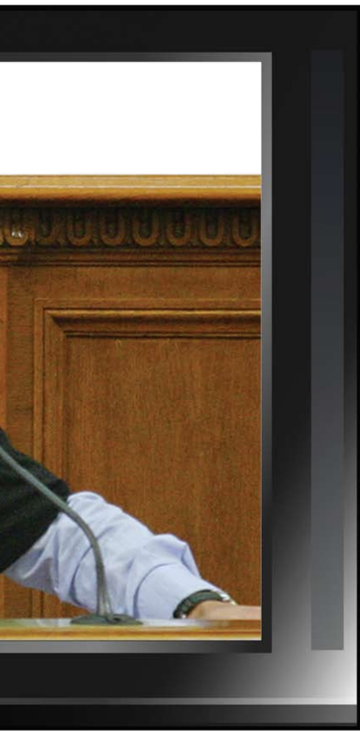
КОЛАЖ СТЕЛА МИХОВА