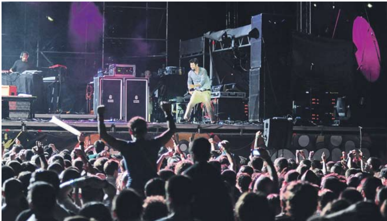
Въпреки недоброто озвучаване Чино Морено от Deftones гаже всичко от себе си

И последната вечер от Spirit of Burgas показва, че алтернативната сцена не изостава по талант и популярност