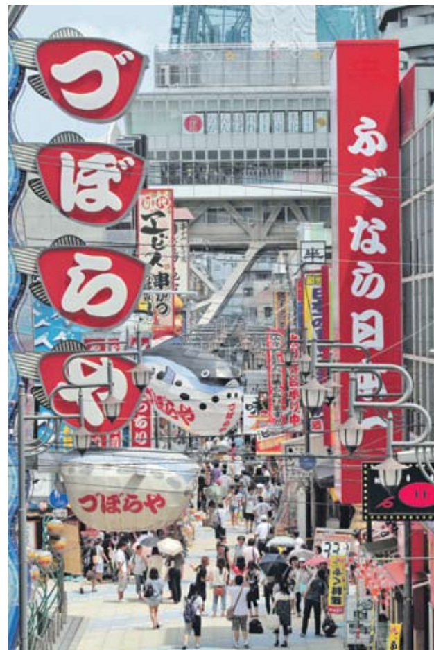
►Брутният вътрешен продукт на Япония е спаднал с 1.3%, което обаче е два пъти по-ниско от очакванията

призовават за "твърди решения за разходите и данъчното облагане в страните с големи бюджетни дефицити". ►В статията те отбелязват, че Европейската централна банка (ЕЦБ) трябва да направи решителни стъпки, за да вдъхне доверие на пазарите. Еврозоната трябва да покаже ангажимент за по-голяма фискална интеграция и управленски механизми, които да прегодват моралните рискове и да засилват бюджетната отговорност", се казва още в статията.