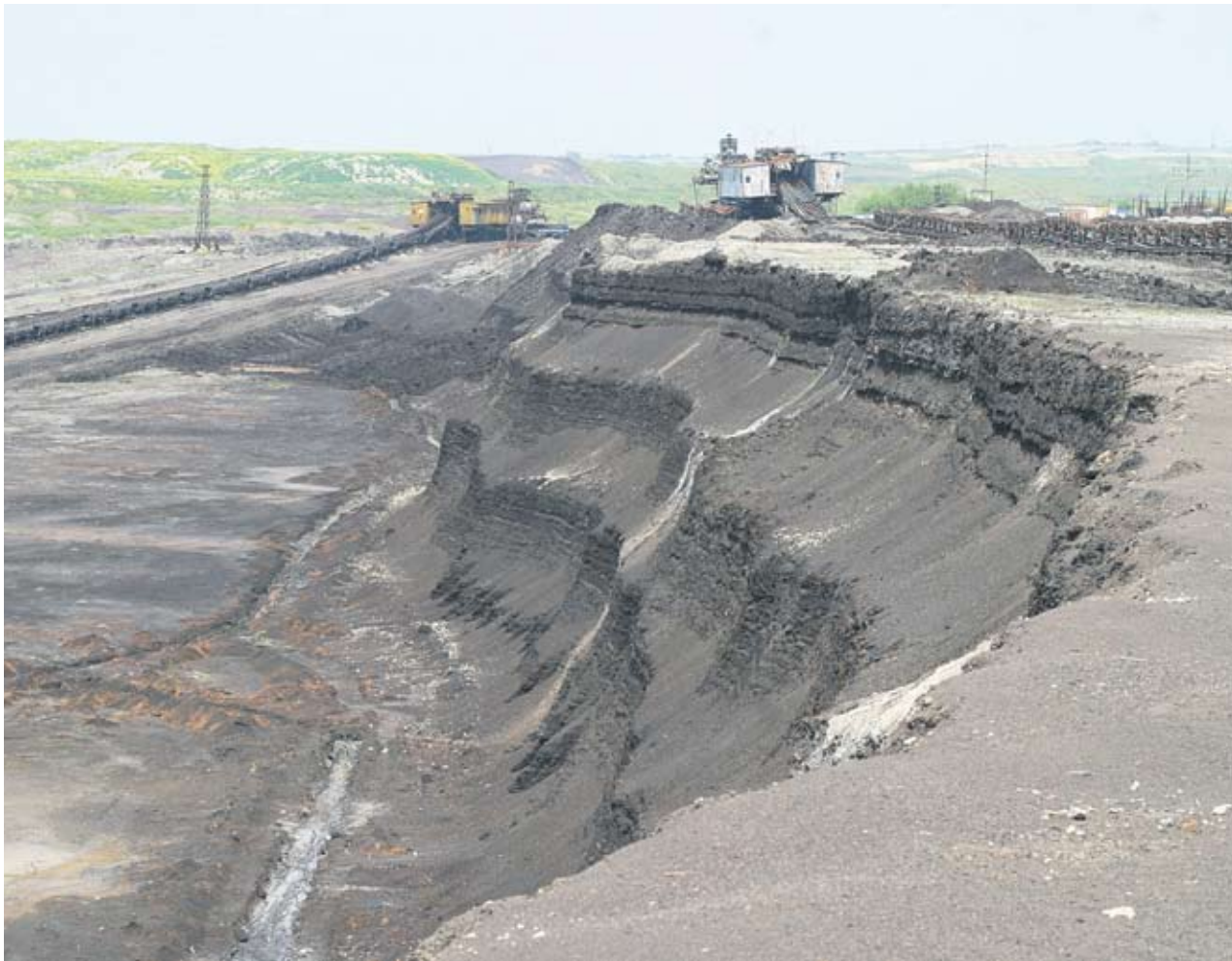
► Скандалите, свързани с различни обществени поръчки, обявени от мините, са почти ежегодни. Те стават причина и за смяна на различни ръководства