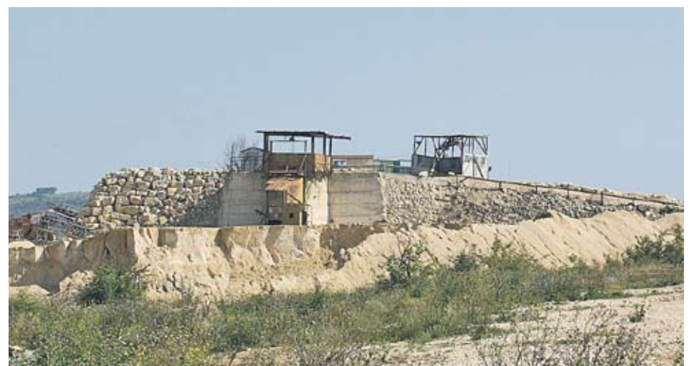
►Наг 3 млн. т от запасите на площадката на ЗСК "Девня" са иззети незаконно

► Ограничава издаването на разрешения за проучване на строителни материали - общоразпространени подземни богатства... за срок две години от влизането в сила на решението.