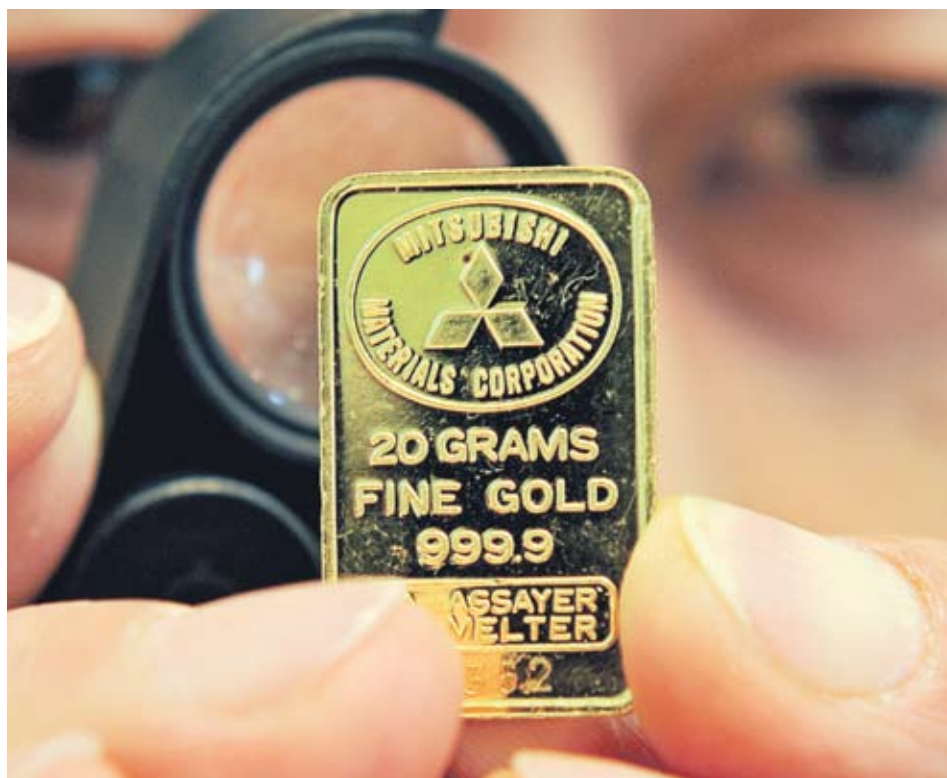
▶ Наг 1800 USD достигна цената на златото за тройунция преди повишаване на маржина по сделките