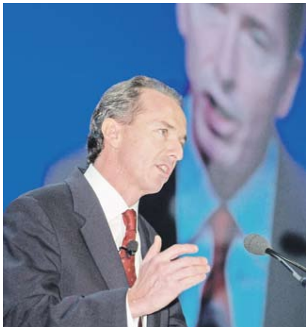
►Изпълнителният директор на Morgan Stanley Джеймс Горман заедно с още двама директори от финансовата институция са закупили 175 000 акции от банката