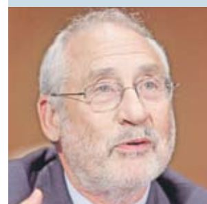
Джоузеф Стиглиц, Нобелов лауреат за икономика

обхванало централната банка. Дори ако Фед успее да спре, макар и временно, спада на борсовите индекси, това няма да е