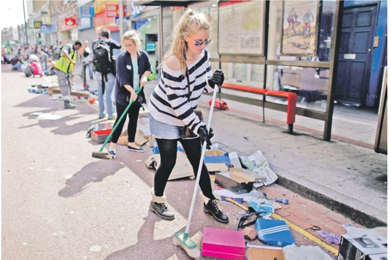
► За почистването на улиците във Великобритания след бунтовете ще бъдат отделени 11 млн. EUR

„Ще си платите за всичко, което направите”, каза премиерът на Великобритания Дейвид Камерън, като се обърна към бунтовниците от трибуната в парламента. За да се справи с безредиците, полицията ще умножи присъствието на пазителите на реда - от 6000 те ще станат 16 000 в Лондон. Полицията вече ще имат право да