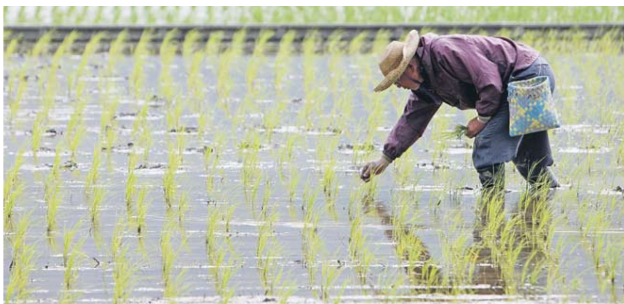
▶ Фермерите в Япония очакват резултатите от проучването, което ще покаже дали оризът им е радиоактивен

Правителството иска от 17 префектури в Източна Япония, където се произвеждат 54% от ориза в страната, да изследват земеделските си площи за радиация. Властите ще забранят доставки от места, където е установено наличие на цезий над 500 бекерела на килограм. Всички замърсени стоки ще бъдат унищожавани. Властите в префектура Чиба заявиха на 9 август, че при първите пет от общо 49 предварителни теста не са установили наличие на радиация в ориза. Според местните власти след прибирането на реколтата ще бъдат изследвани 277 области в префектурата. Япония ще произведе 7.7 млн. тона ориз за 2010-2011 г., превръщайки се в десетия по големина производител в света по данни на министерството на земеделието на САЩ. Според същата информация страната е и десетият по големина потребител. Освен централните власти и частните дружества ще предприемат изследване на добивите. Най-голяма-