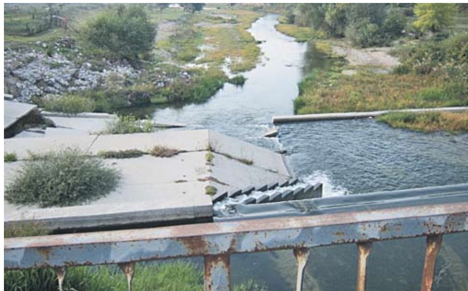
► Незаконният добив край с. Ръжево Конаре е довел до разрушаване на предпазната дига на десния бряг на реката и до обрушаване на брега

Популярна схема за кражба на инертни материали са програмите за рекултивация, казват запознати. Съответната община предоставя някаква площ, която уж трябва да се рекултивира с насипване на земни маси. Какво се случва на практика. Фирмата, която печели поръчката, първо изкопава пясъкa отдолу и го продава на цени, които