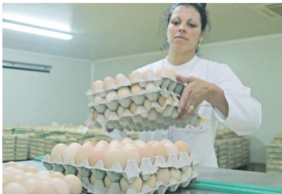
►Заради практиката на съгласуване цените на яйцата в България през 2007 г. са нагвишили средноевропейските

Глобата беше наложена от антитръстовия орган за нарушения на Закона за защита на конкуренцията, касаещи пряко или косвено определяне на цени или други търговски условия. В резултат на проверката, която КЗК образува по самосезиране, беше установено, че в периода 2002-2007 г. Съюзът на птицевъдите в България е организиран срещи между членовете си, за да координира и съгласува ценовото им поведение. Производителите на яйца са имали общ план за контролиране на пазара както по отношение на прилаганите цени, така и на обема на производство. Повишаването на цената на яйцата през лятото на 2007 г. е било толкова драстично,