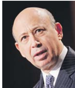
Губещ Лойд Бланкфайн

Министерството на регионалното развитие и благоустройството с министър Росен Плевнелиев е събрало 650 хил. лв. от глоби по концесионните договори. То събира общо 12 млн. лв. като концесия и приходи от плажове.