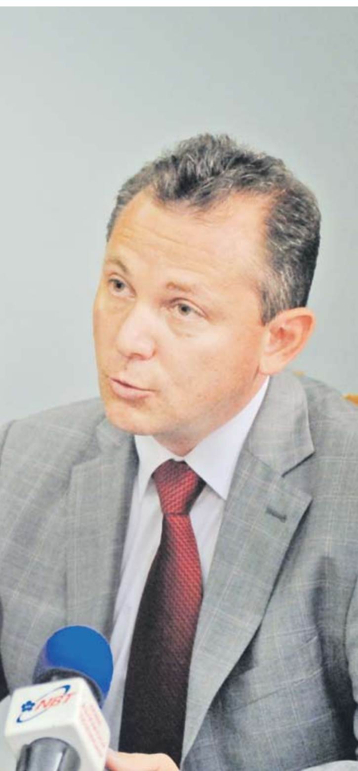
Димитър Георгиев, зам.-министър на вътрешните работи

▶ от всички дарения представляват канцеларски материали