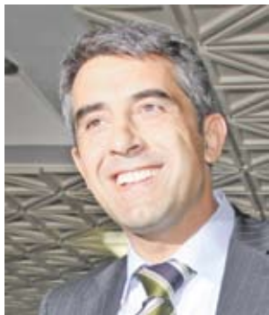
Печеливш Росен Плевнелиев