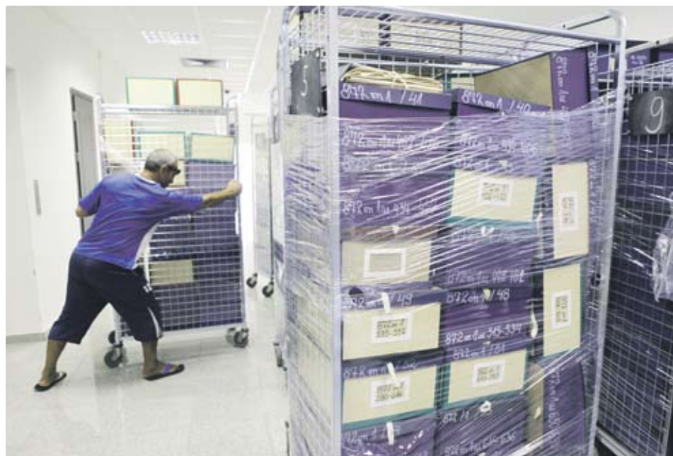
▶ Седмично в новата сграда се пренасят средно половин линеен километър кутии с държавни книжа