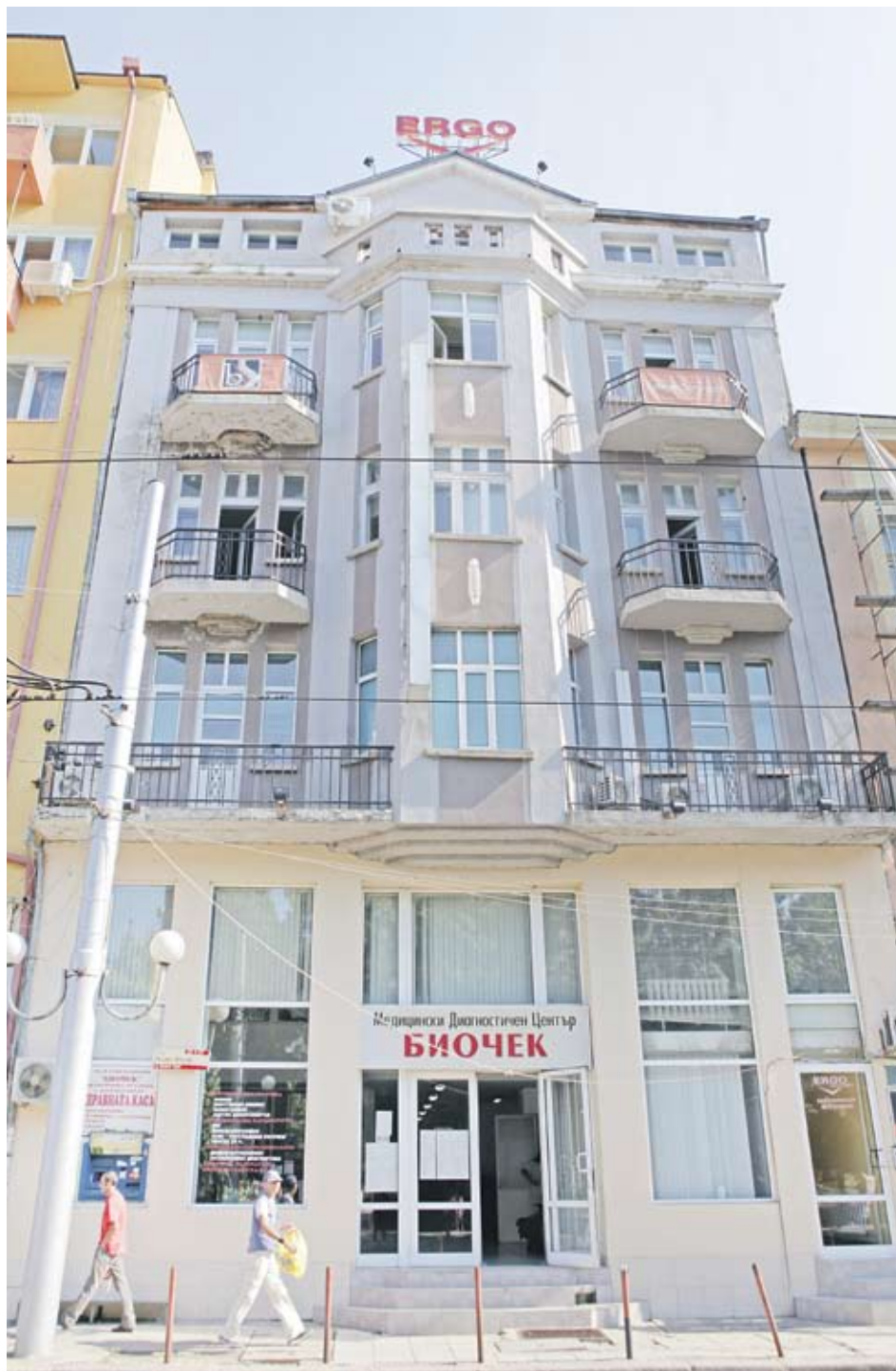
► Търговете за сградата ще бъдат на 12.08 сутринта

11 години в България Медицинският център „Би-