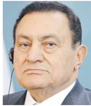
Губещ Хосни Мубарак