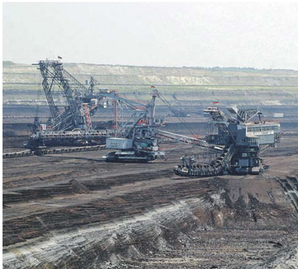
► Мините са оцетени с близо 1 млн. лв. от неизгодни сделки, твърдят от прокуратурата в Стара Загора

По този начин се заобикаля изискването на Закона за обществените поръчки (ЗОП) изборът на изпълнител да бъде направен с открит конкурс. Освен това неправомерно се дава възможност да се избира чрез събиране на три оферти. Според разследващите целта на обвиняемите е била ремонтът или строежът да се изпълни от предварително избрана от тях фирма. Общият размер на вредата се изчислява на 988 869.48 лв. За престъпленията, в които са обвинени двамата, се предвижда наказание от 1 до 8 години лишаване от свобода.