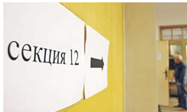
► За охраната на изборителните секции гържавата отпусна на МВР 4 млн. лв.