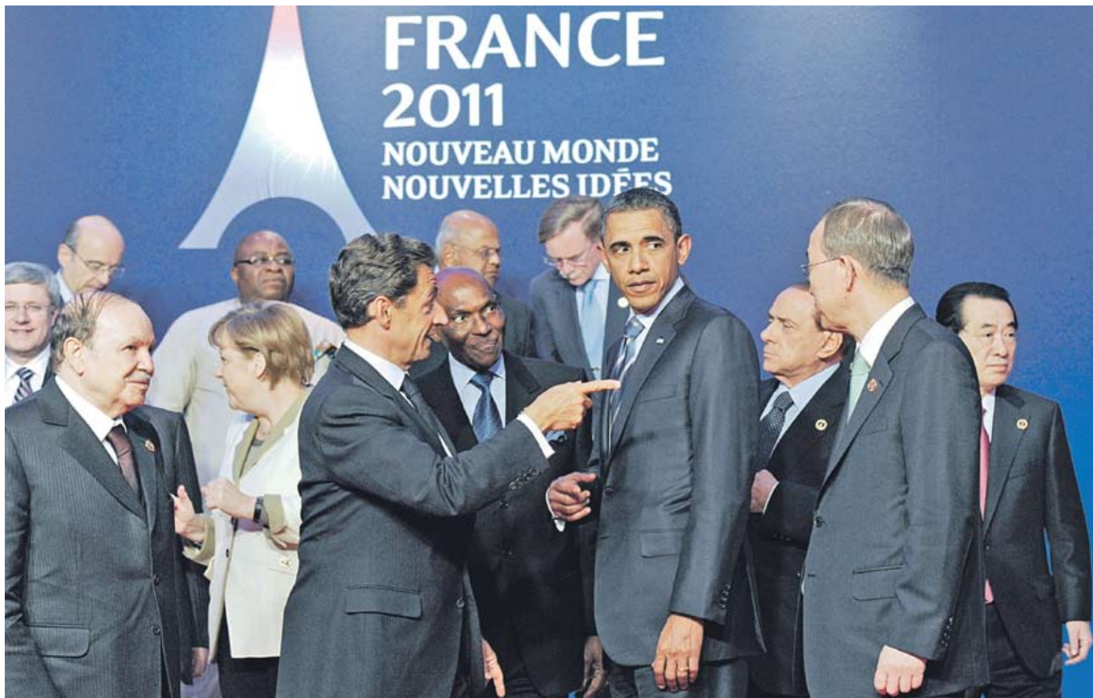
► Лигерите на водещите световни икономисти трябва да намерят начин да се справят с дълговите проблеми, в противен случай глобалната икономика ще навлезе в нова рецесия

Нагласите на инвеститорите се влошиха и заради опасността от нова дългова зараза в Европа, този път в Испания и Италия. Доходността по държавните облигации на двете страни се увеличи до рекордни нива. А това прави почти невъзможно финансирането на Мадрид и Рим от пазарите. Допълнително масло в огъня наляха и появилите се съобщения, че италианският финансов министър Джулио Тремонти има среща с лидера на Еврогрупата Жан-Клод Юнкер. Дватама се срещнаха, за да обсъдят положението на Италия. Според чужди ана-