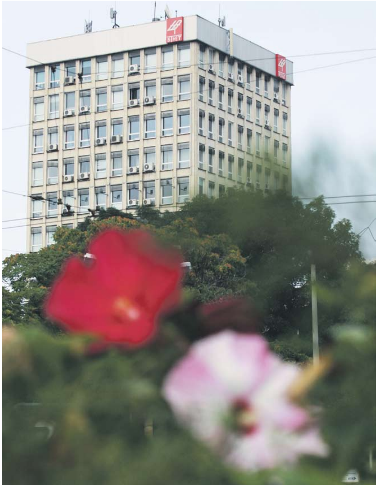
► БНТ приключва 2010 г. с дългове в размер на 5 млн. лв., и то благодарение на намесата на Министерството на финансите, което отпуска допълнително финансиране в размер на 11 млн. лв. през декември 2010 г.

Държавният бюджет предвижда субсидия за 2011 г. за БНТ в размер на 60 млн. лв., а за БНР - 49 млн. лв. Споредносителите на законопроекта собствените приходи на БНТ от реклама представляват под 10% от разходите. Финансовите резултати на телевизията също говорят за нестабилното ѝ състояние. Според отчета за дейността на медията за периода 1 август 2010 до 31 януари 2011 г. има отчетен ръст в рекламните приходи спрямо 2009 г. Въпреки това БНТ приключва 2010 г. с дългове в размер на 5 млн. лв., и то благодарение на намесата на Министерството на финансите, което отпуска допълнително финансиране в размер на 11 млн. лв. през декември 2010 г. По този начин успяват да се покрият част от задълженията, които са основно към БТК за използване на преносната мрежа. Вносителите на законопроекта прогнозираят БНТ да привлече приходи от 10 до