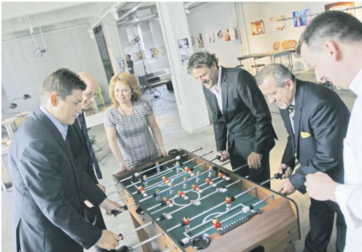
►Поканихме изпълнителните директори на пет големи компании да участват във фотосесия на известния фотограф Темелко Темелков (вдясно)