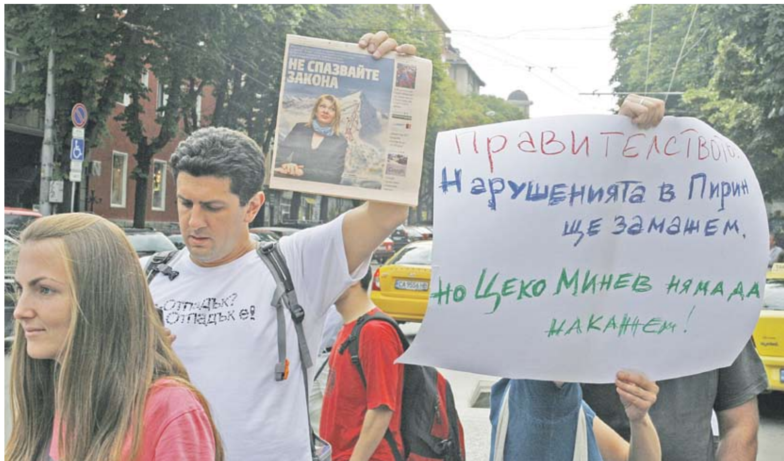
► Природозащитници блокираха кръстовището на "Попа" в София в знак на протест срещу решението на правителството да узакони незаконните писти на "Юлен" в Банско