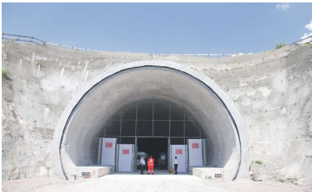
► Тунелът "Блесберг" е дълъг 8314 метра

"Адвал" АД е специализирано основно в тунелно строителство и укрепващи конструкции. Дружеството работи от 90-те години на миналия век в Германия - самостоятелно и като партньор. По същите схеми работи и в Испания, Гърция и в България. За по-малко от 20 години "Адвал" АД е построило над 50 км метро, магистрални, железопътни