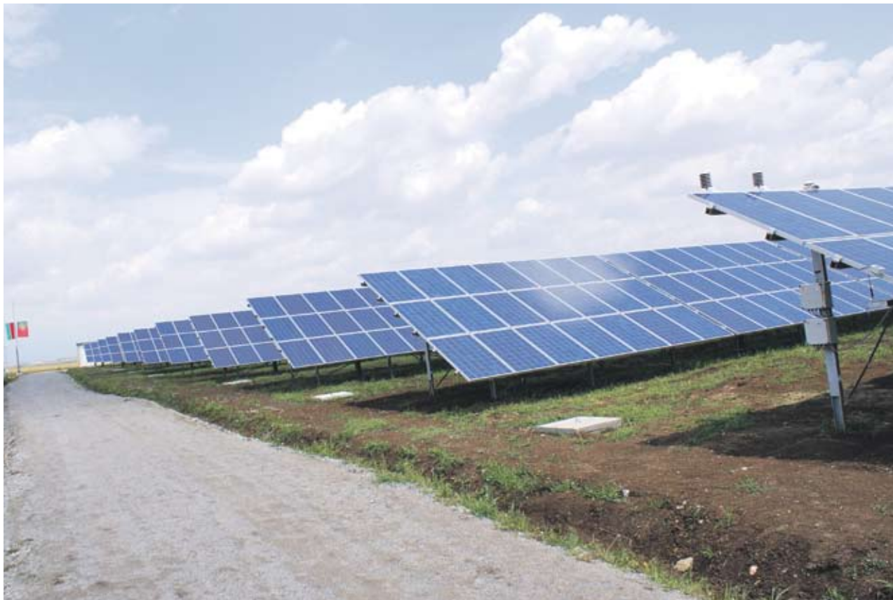
► Фотоволтаичният парк в Безмер ще произвежда 5 хил. кВтч електроенергия годишно

Фотоволтаичният парк в Безмер ще произвежда 5 хил. кВтч електроенергия годишно, заяви при откри-