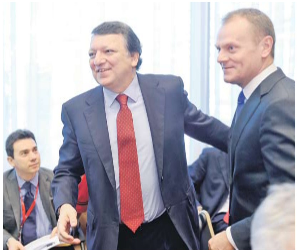
► Полското председателство ще възроди вярата в необходимостта от съществуването на европейските институции, заяви полският премиер Доналд Туск (вдясно)

По време на председателството, което Полша поема от Унгария, се очаква Хърватия да подпише споразумение за присъединяване към ЕС. Освен това Полша се надява ЕС да подпише споразумение за асоцииране с Украйна, което ще позволи да се разшири икономическото сътрудничество като компонент от по-широката програма за развитие на