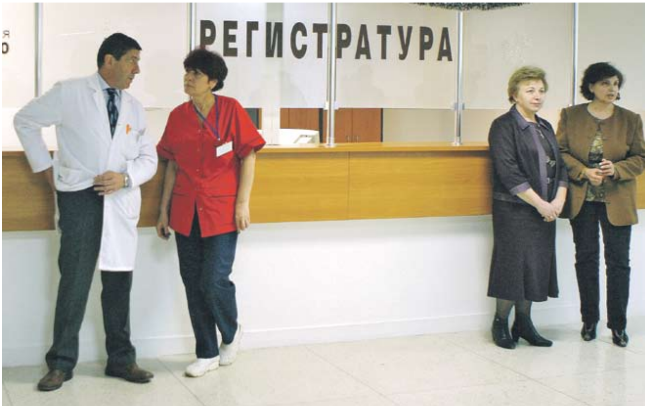
► Болните служители и работодателите им ще си спестят висенето по гишета, когато бъдат въведени електронните болнични листове

Промените засилват и контрола срещу злоупотреби с осигурителната система, чрез въвеждане на допълнителна информация дали осигурителните права на болния са прекратени и дали обезщетението се обжалва. Новият болничен лист е и по-добре пригоден за електронното обработване на данните, което се предвижда да бъде въведено в бъдеще. Сегашните изменения не