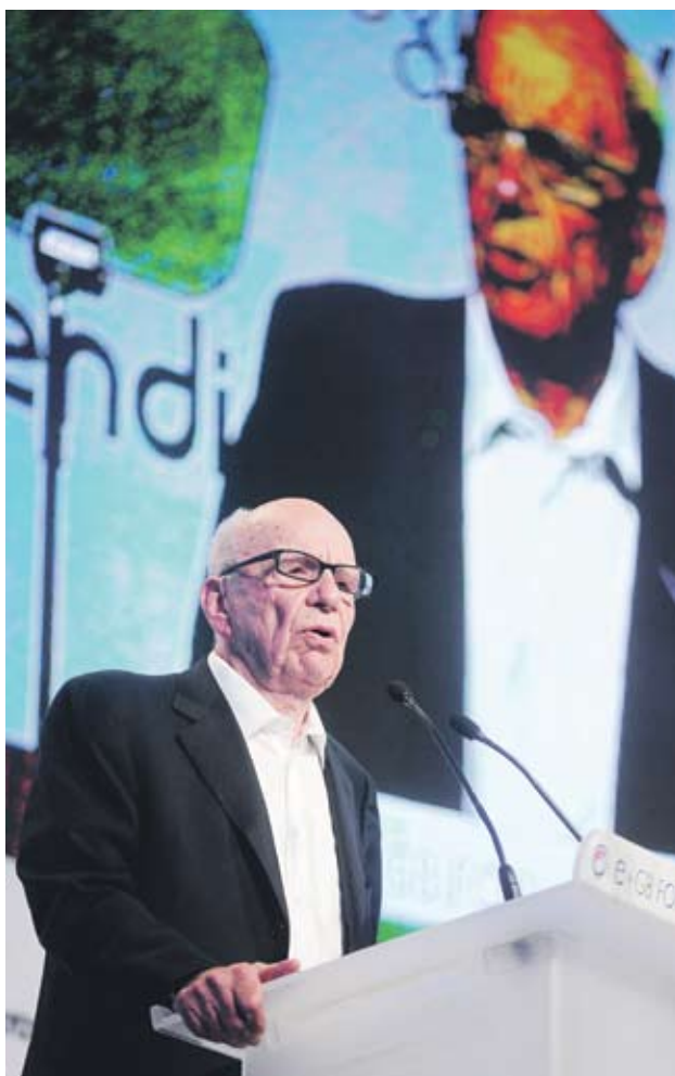
► Успехът на News Corp. да надделее при наддаването за MySpace се смяташе за голям успех за Мърдок, но сега той продаде сайта с голяма загуба

появиха голям брой вероятни купувачи. News Corp. се надява да получат около 100 млн. USD за сайта, който по време на своя пик през 2008 г. имаше над 80 млн. потребители само в Съединените щати - двойно повече от Facebook. Основана през 2003 г., MySpace беше замислена като мрежа, в която приятелите да се срещат онлайн и да обсъждат любимите си музикални групи. Сайтът бързо стана популярен сред младежи, които можеха да прекарват часове в изработка на персонализирана страница със свои дигитални тапети, снимки и други елементи. Растежът на компанията беше прекалено бърз и скоро сайтът започна да отчита отлив на потребители. През първото тримесечие на 2011 г. News Corp. отчете загуби в размер на 165 млн. USD главно заради MySpace.