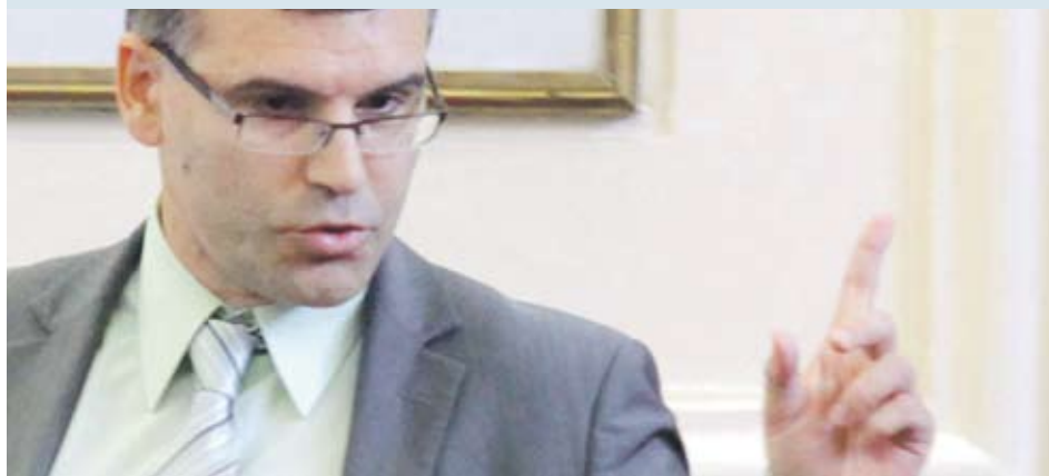
Симеон Дянков, министър на финансите

„ Приетите правила ще предпазват страната от необмислени ходове и гарантират стабилни условия за растеж “