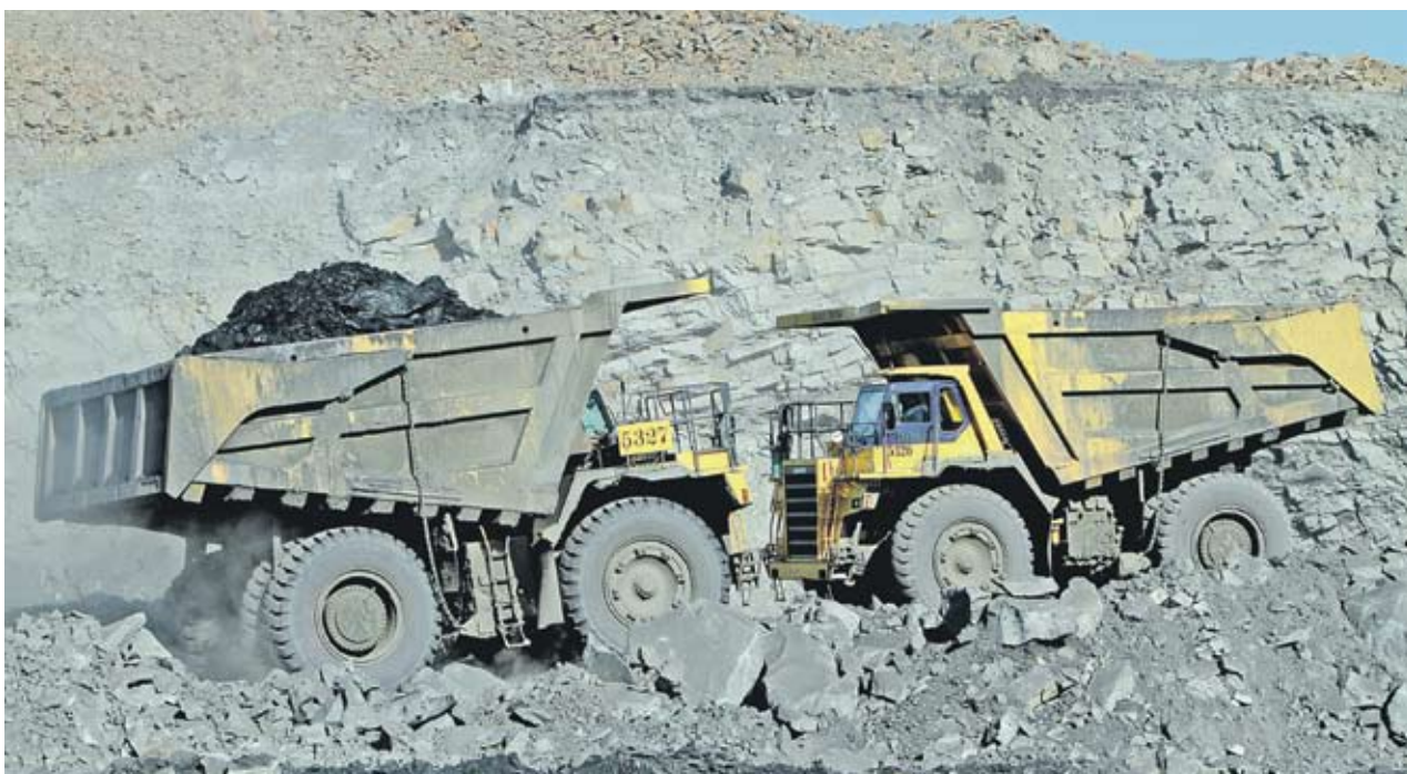
▶ Интересът на индийските компании остава силен въпреки икономическия спад в Австралия

Желанието на различни компании да придобият австралийски активи не е намалело, въпреки че през първото тримесечие на 2011 г. икономиката на страната отчете най-големия си спад от 20 години насам, а австралийската валута поскъпна с 30% спрямо щатския долар за последната година. Обявените планирани сделки досега тази година са в размер на 55 млрд. USD, показват изчисленията на Bloomberg. Според Barclays в момента в про-