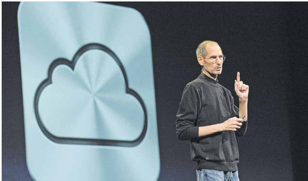
► Стив Джобс представи в Сан Франциско новите софтуерни продукти iOS 5, Mac OS X Lion и iCloud

Основната "облачна" услуга на Apple е iCloud. Тя съхранява съдържание в облака и автоматично и безжично го доставя до всички устройства, които са свързани с акаунта. Освен ежедневните неща като музика, книги, снимки и видео в облака ще се съхранява и информация за настройките на устройствата и всички закупени приложения, като всичко ще става автоматично и през WiFi. Така, ако си купите приложение от iTunes на компютъра, няма да има нужда да свързвате iPhone-а си с него, а директно ще можете да свалите приложението. Ъпдейтите на iOS също ще стават чрез WiFi, което абсолютно изключва нуждата да връзвате мобилните си устройства