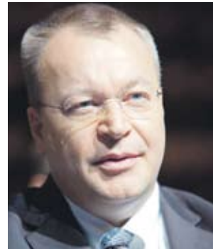
Губещ Стивън Елоп

Президентът на САЩ Барак Обама подкрепи Бан Ки-мун за втори петгодишен мандат начело на ООН, предаде АФП, поздравявайки се на съобщение на Белия дом. От Вашингтон са отбелязали, че под ръководството на Бан ООН е изиграла ключова роля при реагирането на кризи и предизвикателства по целия свят.