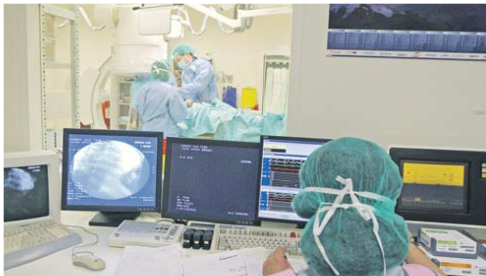
► Здравноосигурителните дружества отбелязват ръст на brutния прирост въпреки липсата на държавна политика в здравеопазването