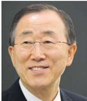
Печеливш Бан Ки-мун