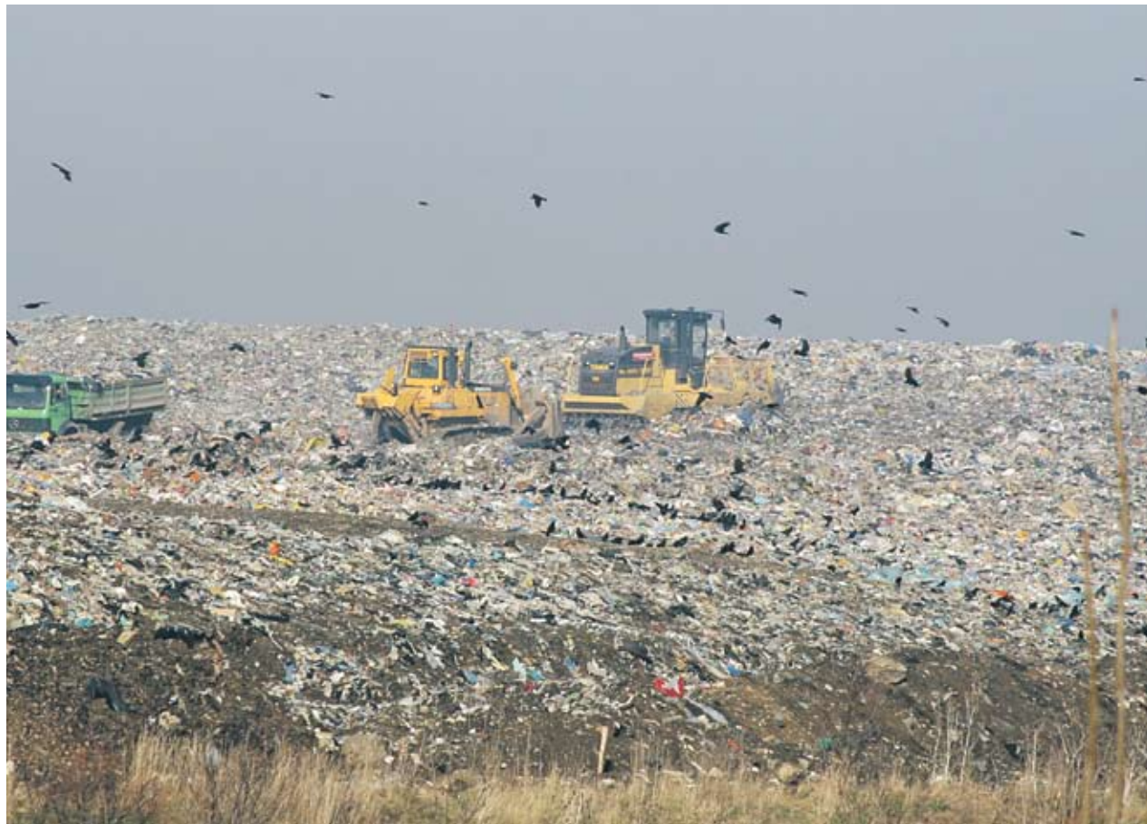
► Единственото сигурно около такса смет е, че ще расте

Според проучване на Българската стопанска камара в цялата страна плащаната от работодателите такса смет варира от 300 до 3000 лв. на заето лице. Спо-