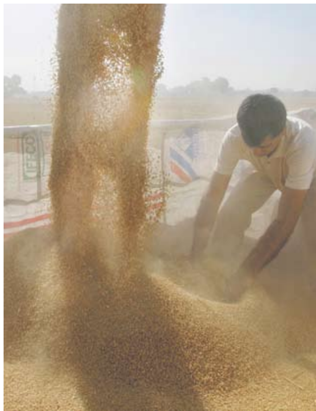
► ФАО очаква тази година добивът на пшеница в Европа да остане непроменен

Прогнозите идват на фона на отчетените понижения през май