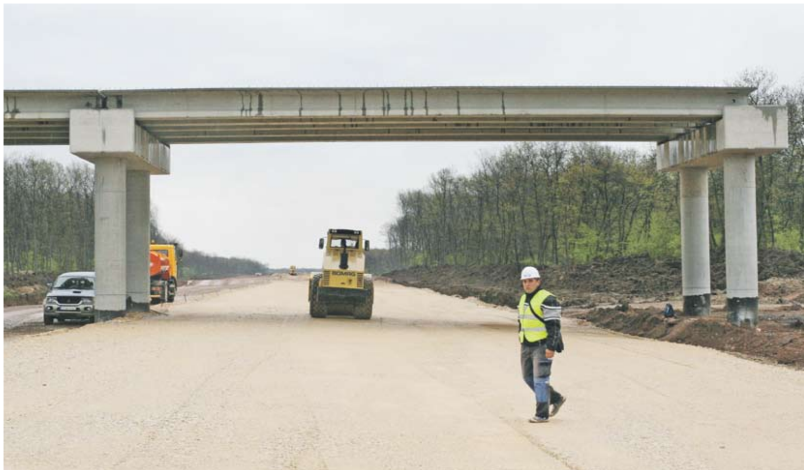
► Конкурсът за строежа на лот 2 на "Марица" привлече рекордните 14 участника, сред които 5 италиански и 3 гръцки фирми

Плевнелиев припомни, че е възможно както при конкурса за лот 2 на "Тракия" пътната агенция да прецени и да направи допълнителна експертиза върху решенията на комисията и ако всички доклади са положителни, тогава да се