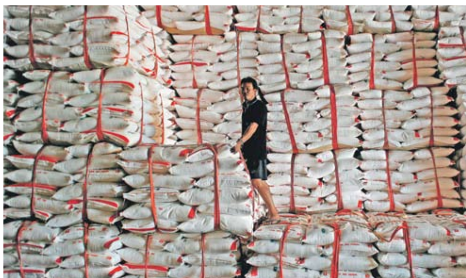
▶ Увеличаването на вноса на захар в Китай се очаква да охладу инфлацията, която миналия месец достигна 5.4%

Местното производство във втория по големина консуматор в света се очаква да намалее през тази година