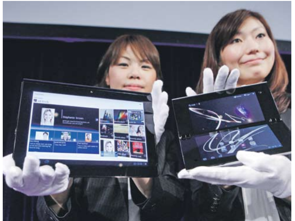
Sony представи първия си таблет, все още цената не е ясна, но очакванията са той да се предлага под 500 USD