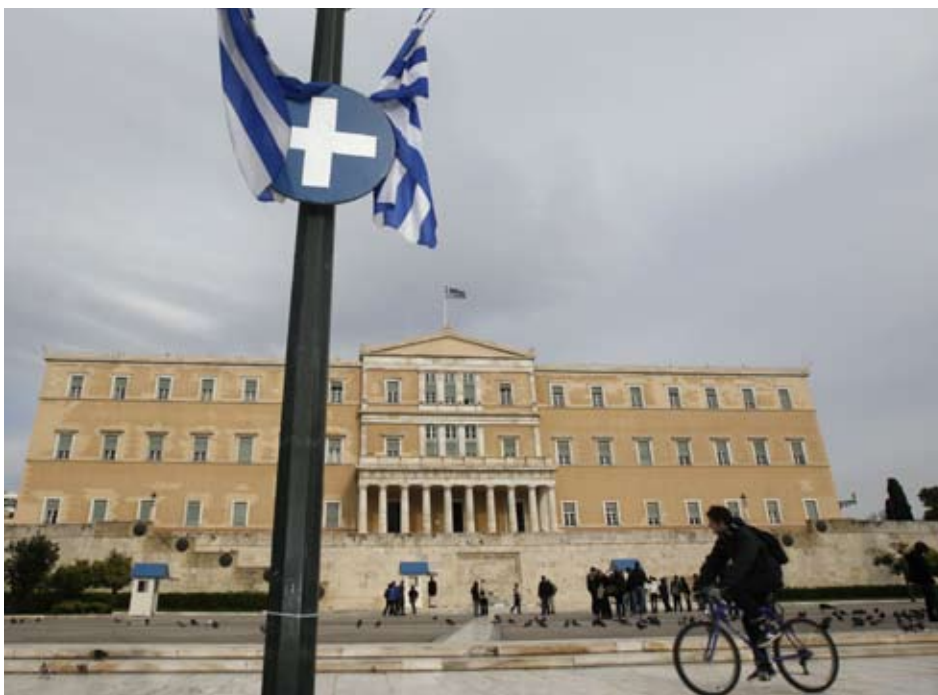
► Ревизията на Евростат е поредният удар по опитите на страната да достигне целите, заложи в спасителния пакет

Външният дълг на еврозоната е достигнал рекордно равнище през 2010 г.,