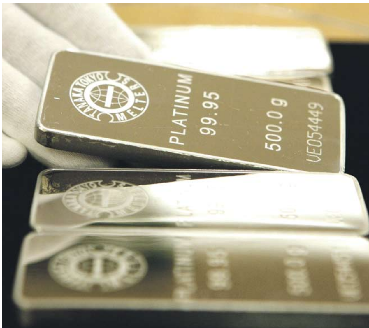
▶ Платината трябва да се повиши с още 27%, за да достигне историческия си връх от 2301.50 USD, който отбеляза през март 2008 г.

Търсенето от производители на катализатори се е увеличило с 3.58 млн. тройунции тази година, или с 64% повече, отколкото през 2009 г. Обикновеният автомобилен катализатор съдържа 4 г (0.13 тройунции) платина, паладий или родий.