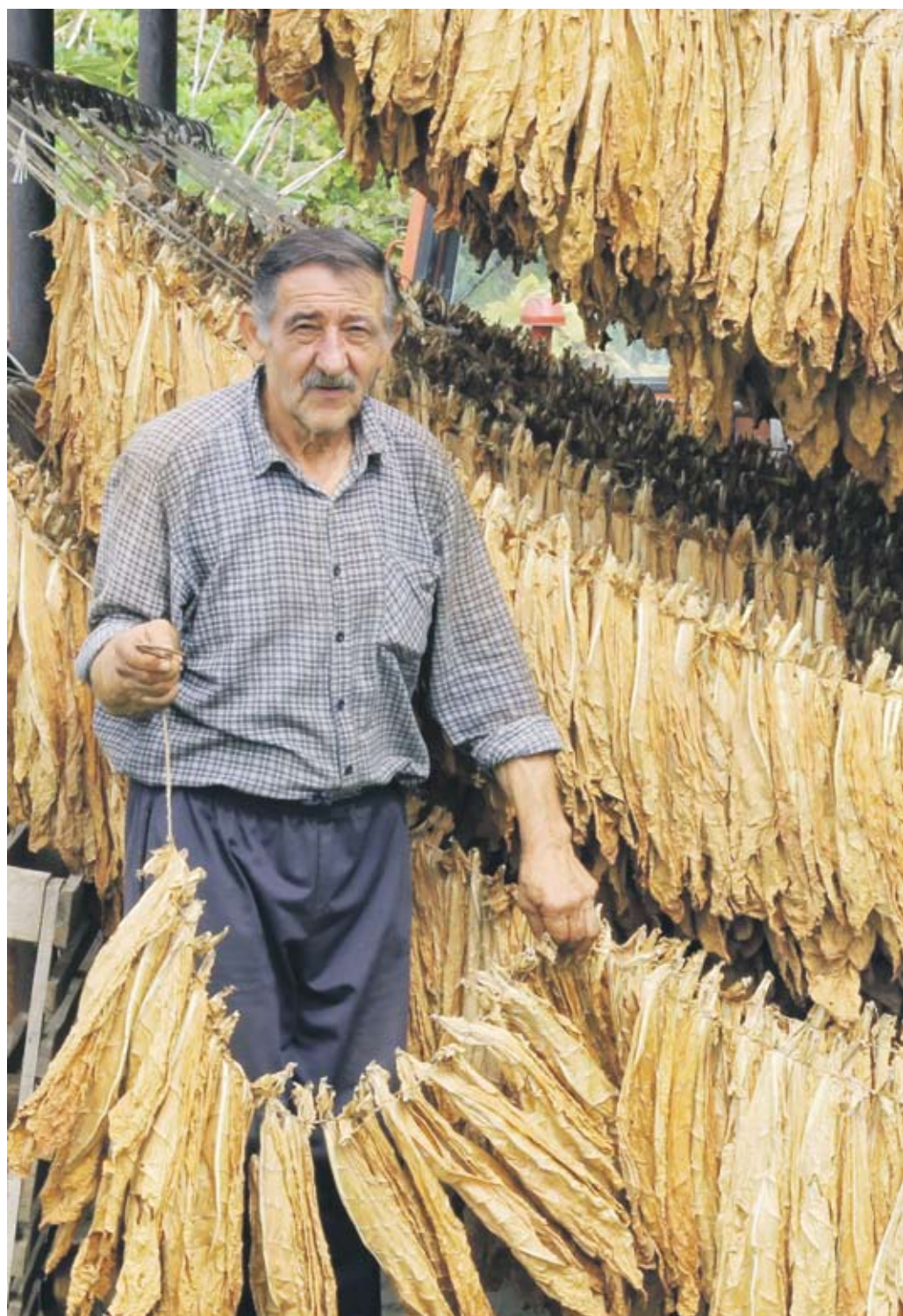
► Държавата ще гарантира изкупуването на определен процент български тютюн,

Купувачът ще трябва да поеме и социални анга-