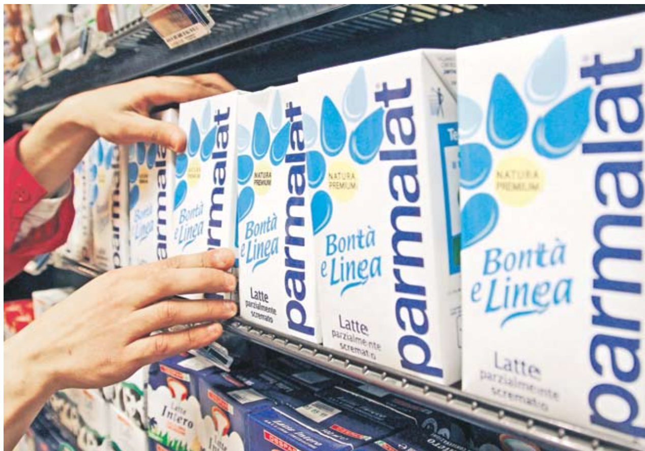
► Ако бъде успешна, сделката ще създаде най-голямата група за млечни продукти в света, чиито комбинирани приходи се изчисляват на 14 млрд. EUR годишно

Политически въпрос Съобщението, разпростра-