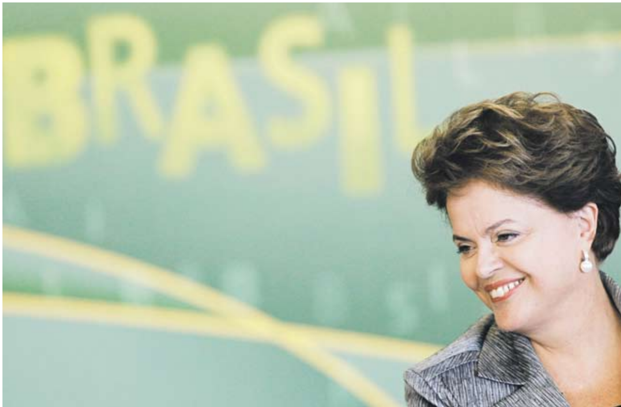
► Проучваме и други алтернативи, като предсрочно изкупуване на бразилски държавни облигации, държани от португалското правителство, казва Дилма Русеф

„Една от възможностите е да изкупим част от португалския дълг. Проучваме и други алтернативи, като предсрочно изкупуване на бразилски държавни облигации, държани от португалското правителство“, обяснява Русеф. Каквито и мерки да бъдат предприети от бразилска страна, те трябва да бъдат съобразени със законовите ограничения върху използването на бразилските валутни резерви.