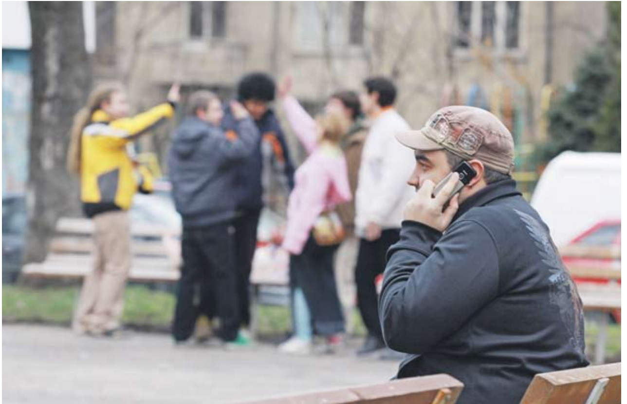
► Досегашните абонати на "Глобул" и "МобилТел" остават с валидни клаузи за удължаване на договорите

Всички тези решения се вземат малко преди гласуването на нов Закон за електронните съобщения, подготвен от Министерството на транспорта, информаци-