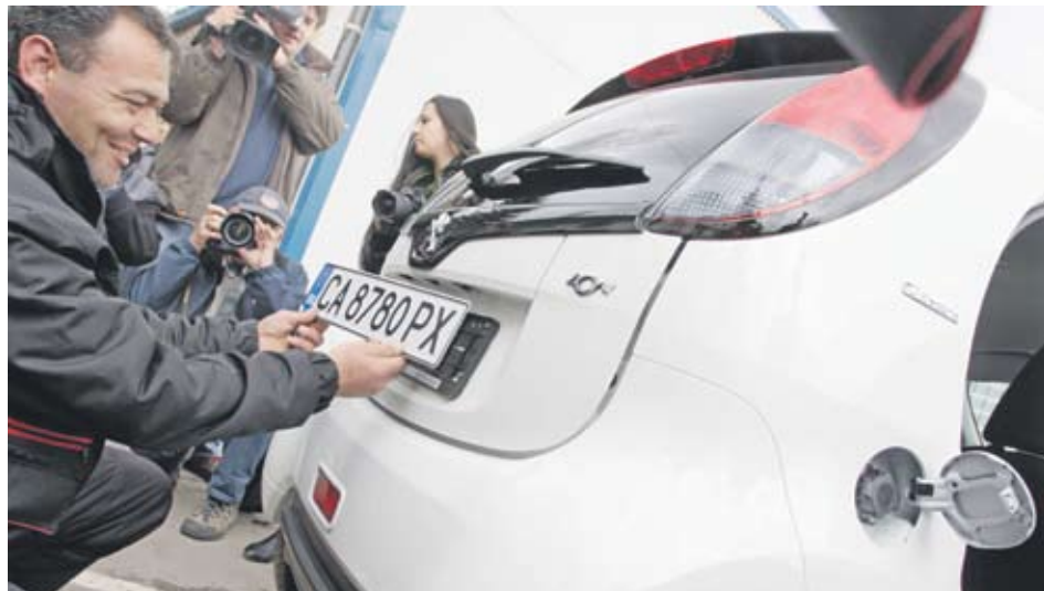
► В момента у нас има няколко десетки електромобила, но те основно са собствена разработка, твърдят от индустриален клъстер "Електромобили", който обединява различни компании

Веднъж заредени, електромобилите може да изминат 150 км, а нормалният градски преход е не повече от 70-80 км. 90% от пътуванията, които хората правят всеки ден, са под 60 км, твърдят от "София Франс Ауто", които внасят Peugeot iOn, модела на първия регистриран електромобил.