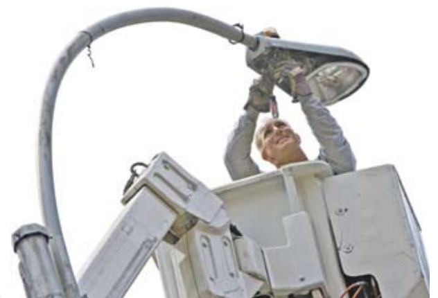
► Уличното осветление в много общини ще бъде погменено със светодиодни лампи

В средата на февруари производството си откри и компанията "Окта лайт България", в която 51% държи производителят на акумулатори "Монбат". В производствената линия в Годеч дружеството е инвестирало над 5 млн. USD. За конструирането и производството на мощните светодиоди при откриването от компанията обявиха, че ще бъдат наети 26 висококвалифицирани специалисти, а други 70 души работят в производството на светодиодни осветители.