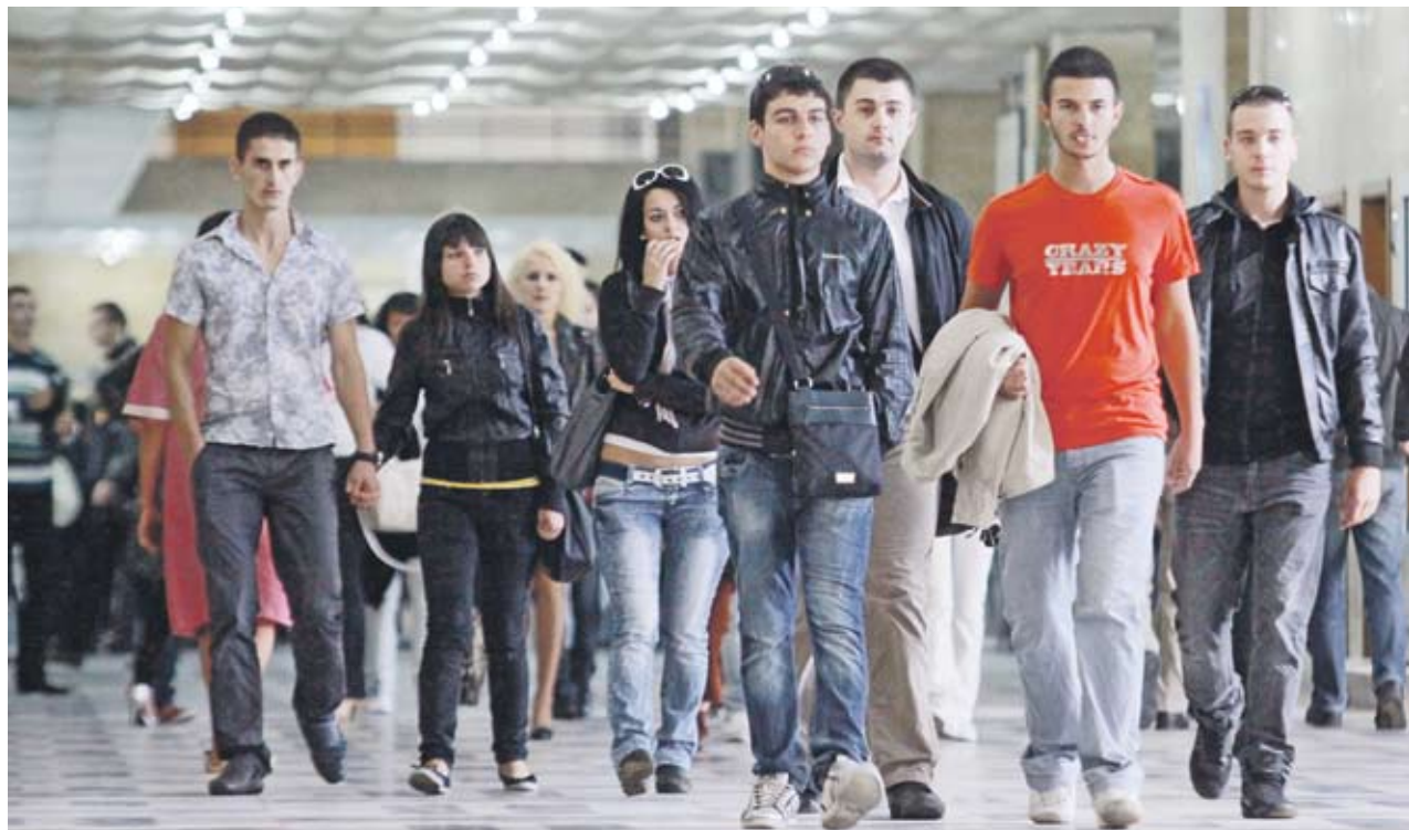
► Компаниите вече не търсят просто квалифицирани служители, а личности

Стажантските програми вече не се провеждат заради липсата на конкретни служители или просто за да се намери евтина работна ръка за нискоквалифицираните дейности. "Подборът се прави много внимателно и много рядко само по автобиография. Стажантите имат ясни задачи, а не правят кафе и не работят само на ксерокса",