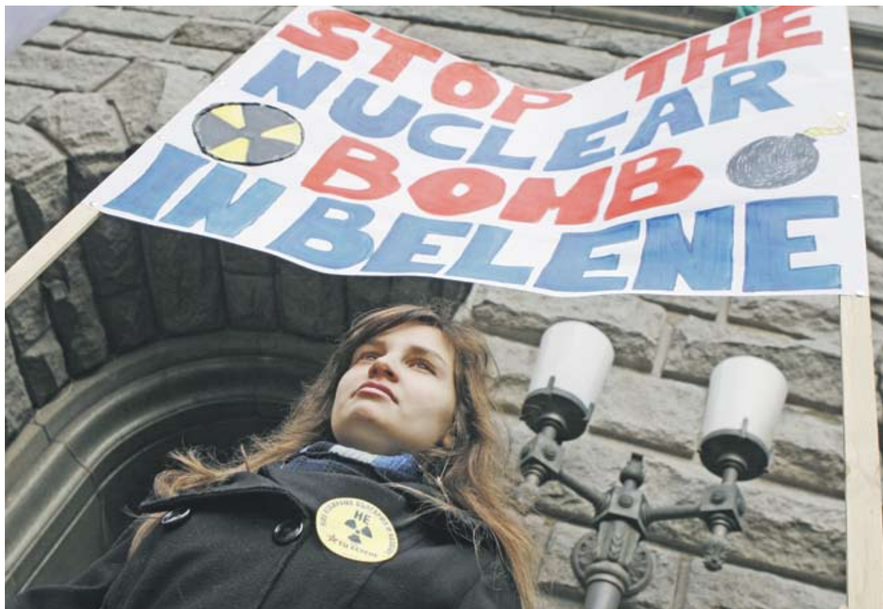
► Противници на АЕЦ "Белене" протестираха пред Министерския съвет срещу изграждането на централата, от което правителството още не се е отказало