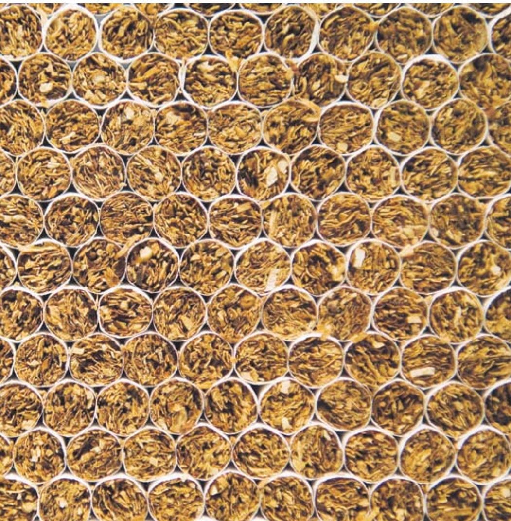
спорта на цигари

не до 2/3 от заложените 450 млн. лв. в бюджета", коментира Главчев пред Агенция "Фокус".