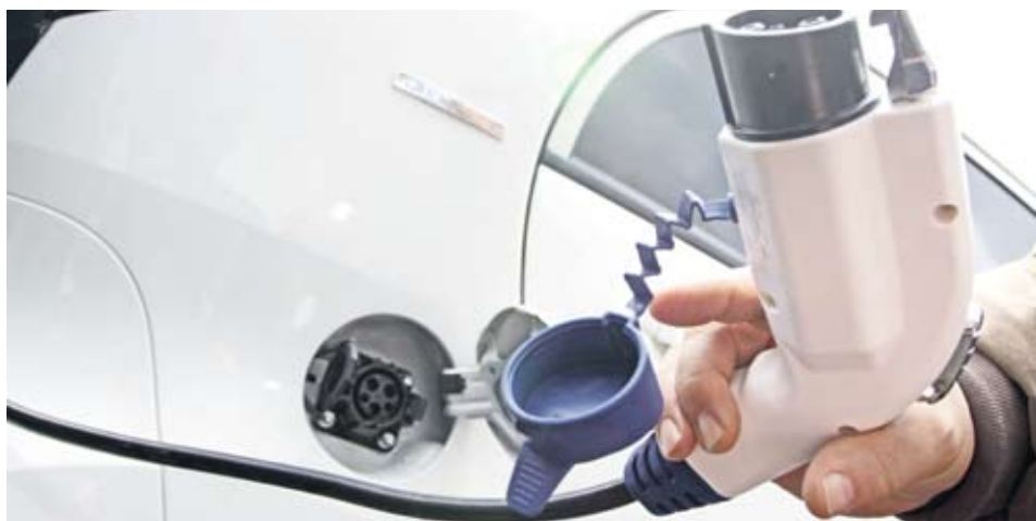
► При извънградски преходи е възможно батерията на електромобила да се зареди частично в "зарядна станция", но такава у нас още няма