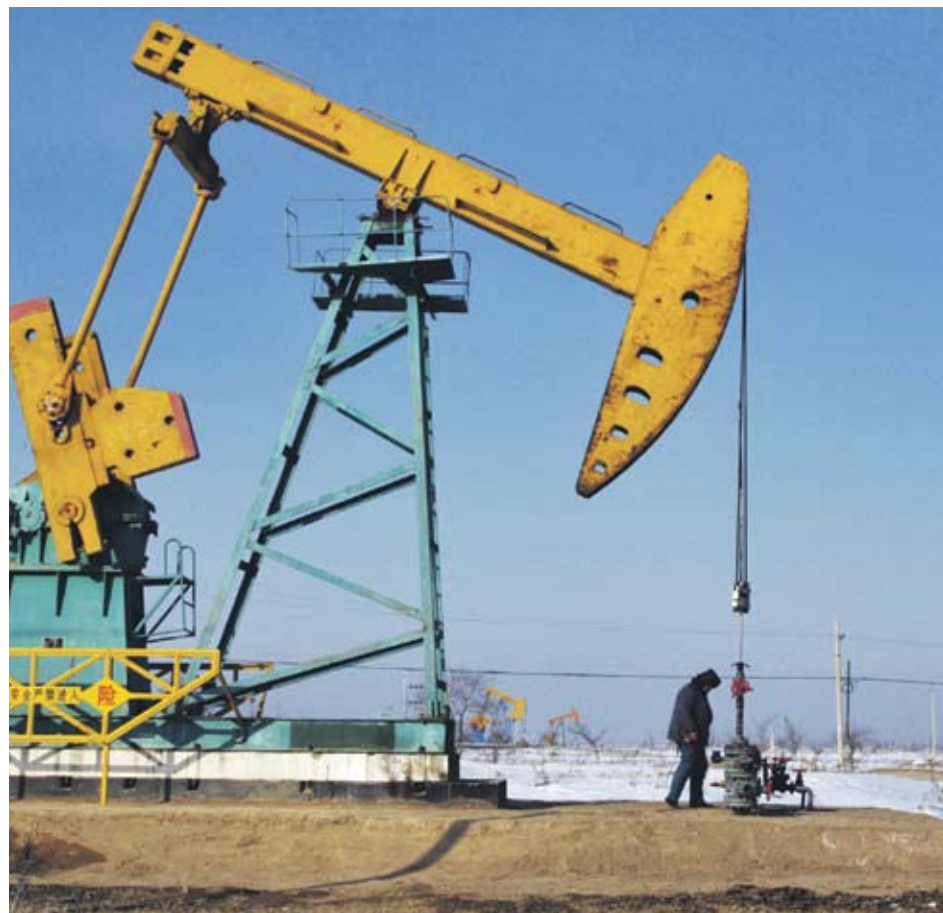
▶ Повишените запаси в САЩ изненадаха анализаторите и бяха с основна тежест за изменението в цената на петрола

▶ млн. барела са се увеличили запасите на суров петрол в САЩ през миналата седмица и са достигнали 355.7 млн.