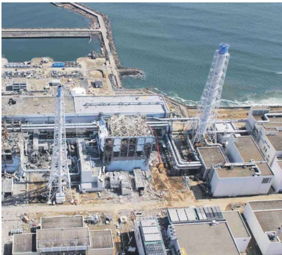
► Операторът на централата ТЕПКО призна, че овладяването на кризата в реакторите във Фукушимата ще продължи дълго време и че средствата, които тя успяла да осигури, няма да ѝ стигнат

Радиоактивността на морската вода около атомната централа е 3355 пъти по-висока от пределно допустимата норма