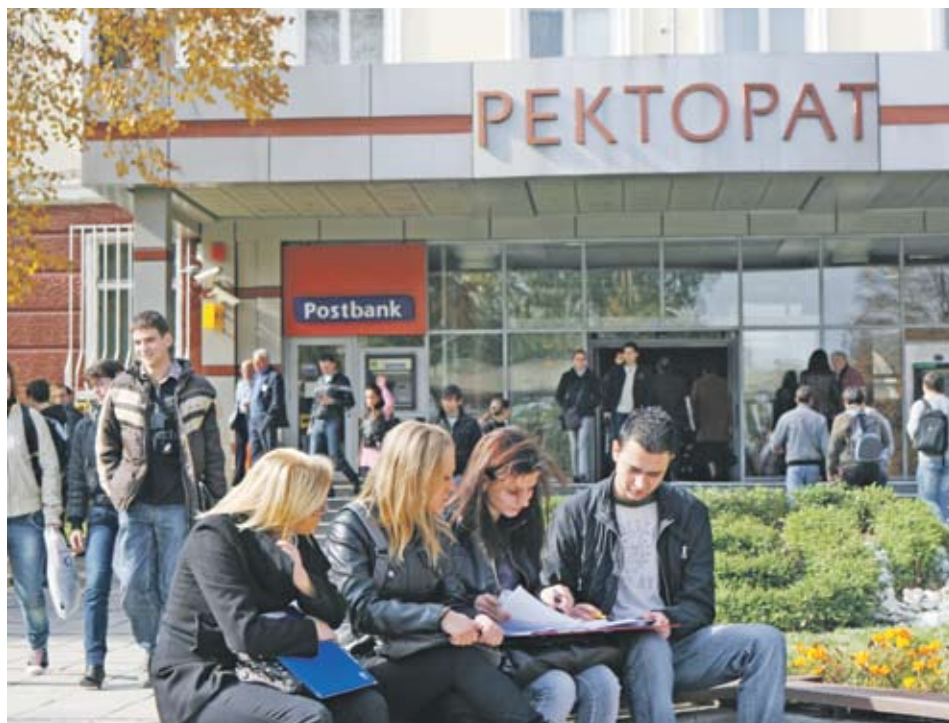
► Първокласните университети трябва да получават по-голямо финансиране

Накратко, смятам, че академичните специалности ще бъдат само леко видоизменени, но за сметка на това през следващите десет години ще станем свидетели на революция в образователните методи, прилагани във висшето образование и в начина, по който студентите ще бъдат обучавани. ■