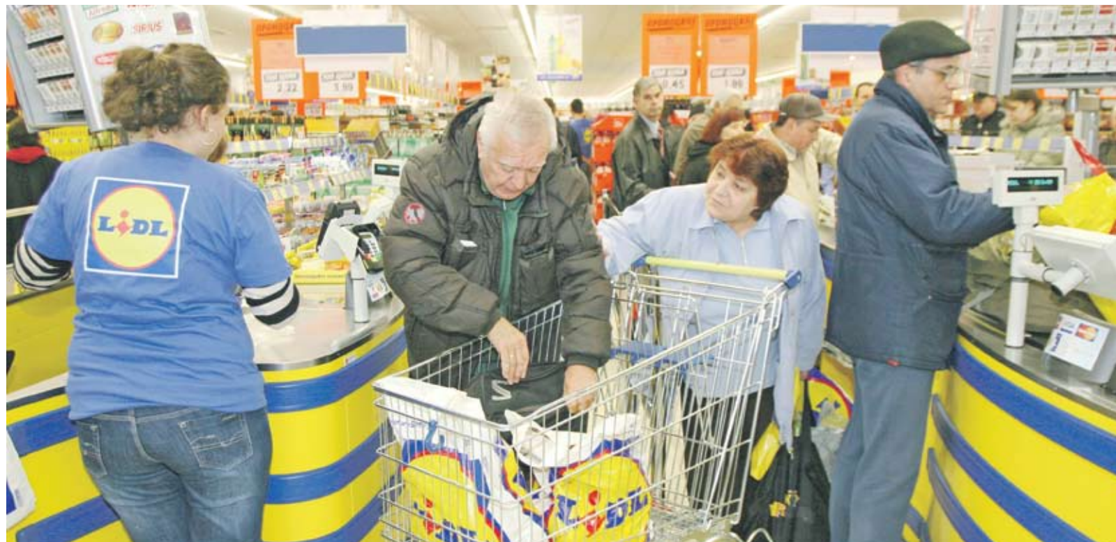
► Най-успешни са магазините в столицата. Бумът на клиенти е попреминал след Нова година

„Лидл“ вече има 2003 служители, като от тях 1600 работят в магазините. От 870 служители, които бяха наследени от „Плюс“, на работа са останали 800,