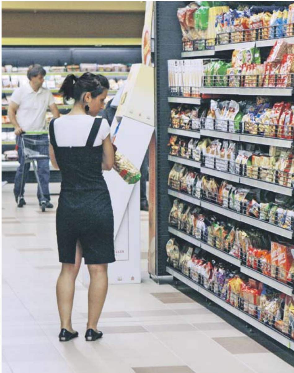
► В началото на февруари КЗК преяви обвинения срещу шест големи търговски вериги за наличие на картелно споразумение