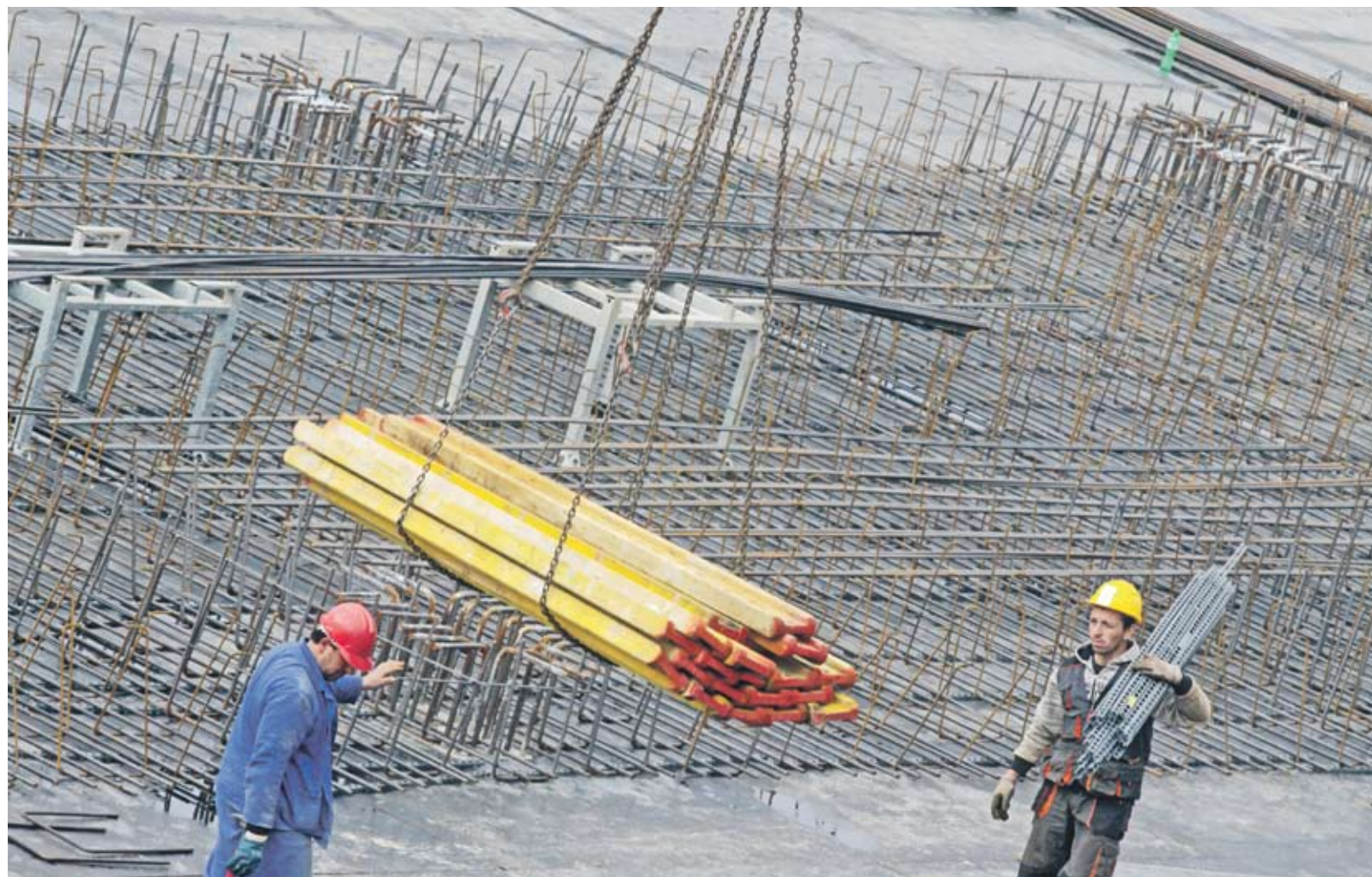
► Ориентировъчните цени в пътното, високото и хидротехническото строителство са заплаха за конкуренцията, смята КЗК

През май миналата година КЗК глоби камарата, защото беше публикувала на сайта си ориентировъчни цени във високото, хидротехническото и пътното строителство. Проучването на антимонополния орган показало, че изработването на ценовите показатели е било с цел тяхното реално приложение в строителния сектор в страната. По закон определянето на цени - пряко или косвено, е най-тежкото нарушение на конкуренцията и води до сериозни увреждания на пазара. Затова е прието, че