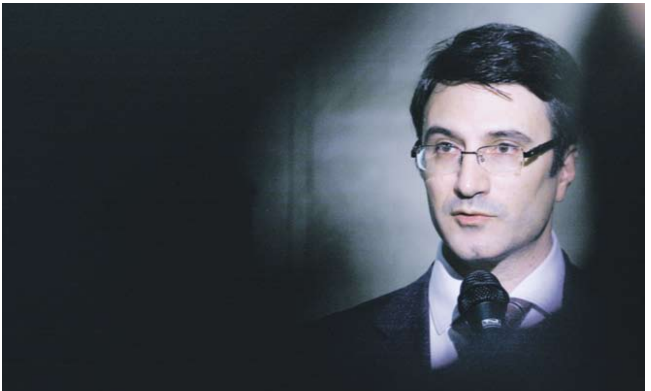
► Експертите в министерството ще проверят дали формулата за ценообразуване на "Лукойл" завишава цената за вътрешния пазар, обясни Трайков

Трайков отново се обяви против премахването на задължителния биокомпонент в дизела, както и срещу идеите за понижаване на ДДС. "Сега вече имам поточни данни за цената на биокомпонента, което съвсем недвусмислено потвърждава, че биокомпонентът заедно с ДДС прави горивата с около половин стотинка по-скъпи. Тоест по някакъв начин тези горива от този, който ги смесва, се продават по-скъпо, за да не се стимулира консумацията на горива, в