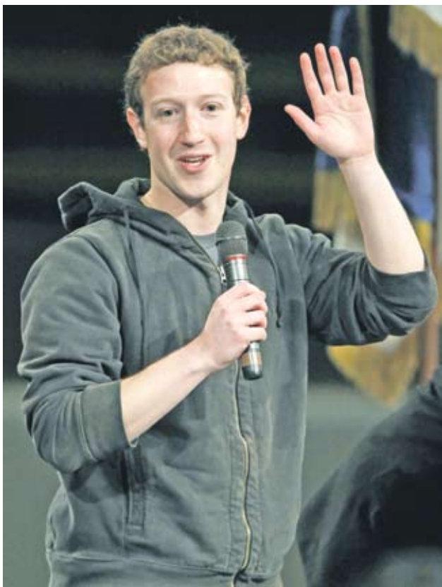
▶ Марк Цукърбърг, основател на социалната мрежа Facebook

страна от AT&T казват, че остават оптимистично настроени за изхода на сделката, която според тях ще донесе значителни ползи на потребителите, като увеличено високоскоростно LTE покритие. □