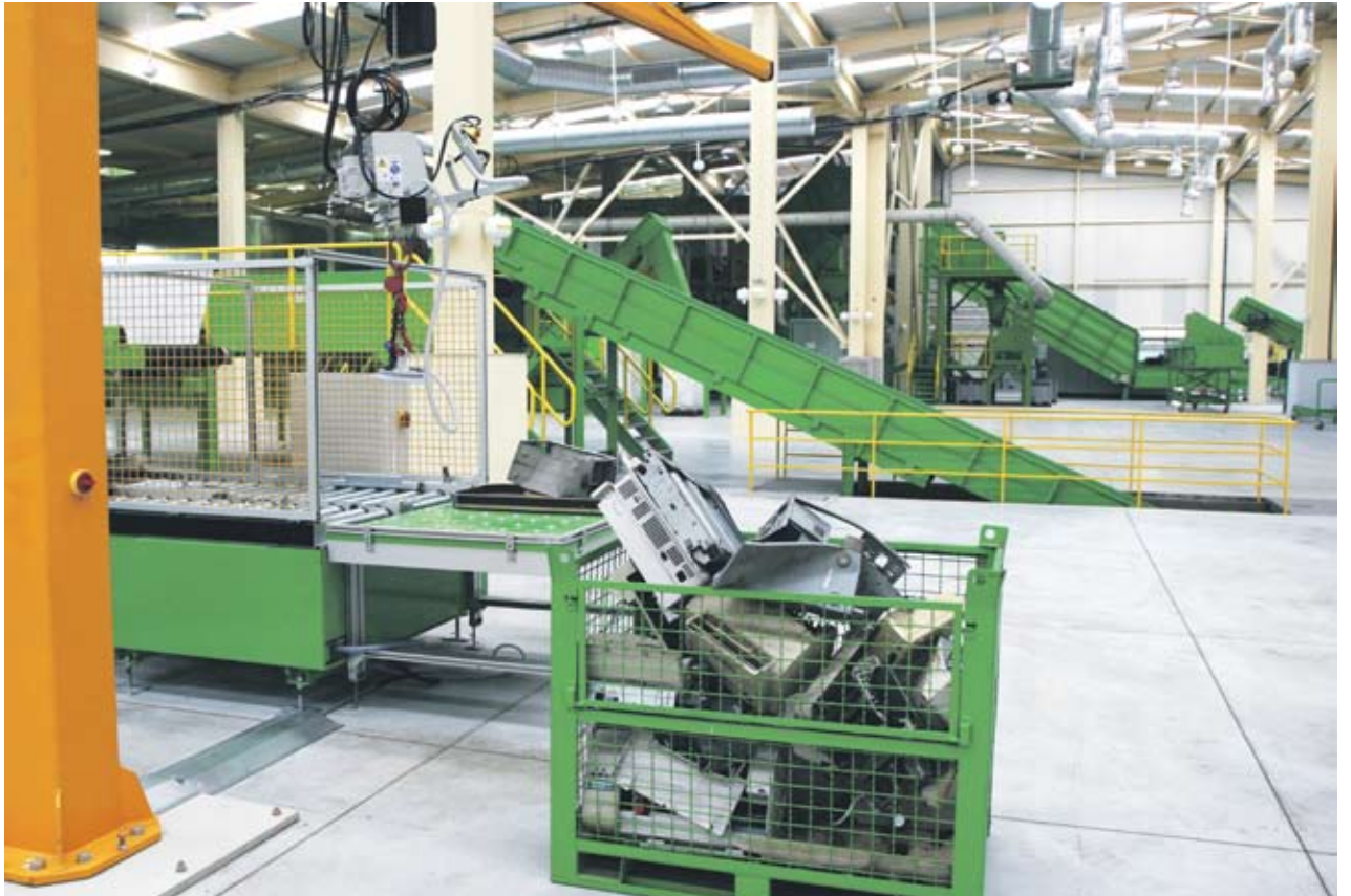
► Според промените площадки за дейности с вторични суровини ще може да оперират само в населени места, където има приети и влезли в сила общи градоустройствени планове. Това може да забави развитието на рециклирането у нас, а България и без това заема последното място в ЕС