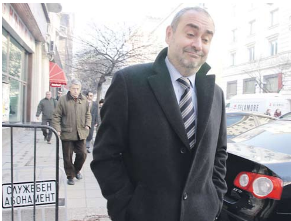
▶ Пенгезов ще поиска от главния прокурор Борис Велчев да провери изказванията на министъра на вътрешните работи Цветан Цветанов, че бивш магистрат е помагал в престъпната дейност на октоподите