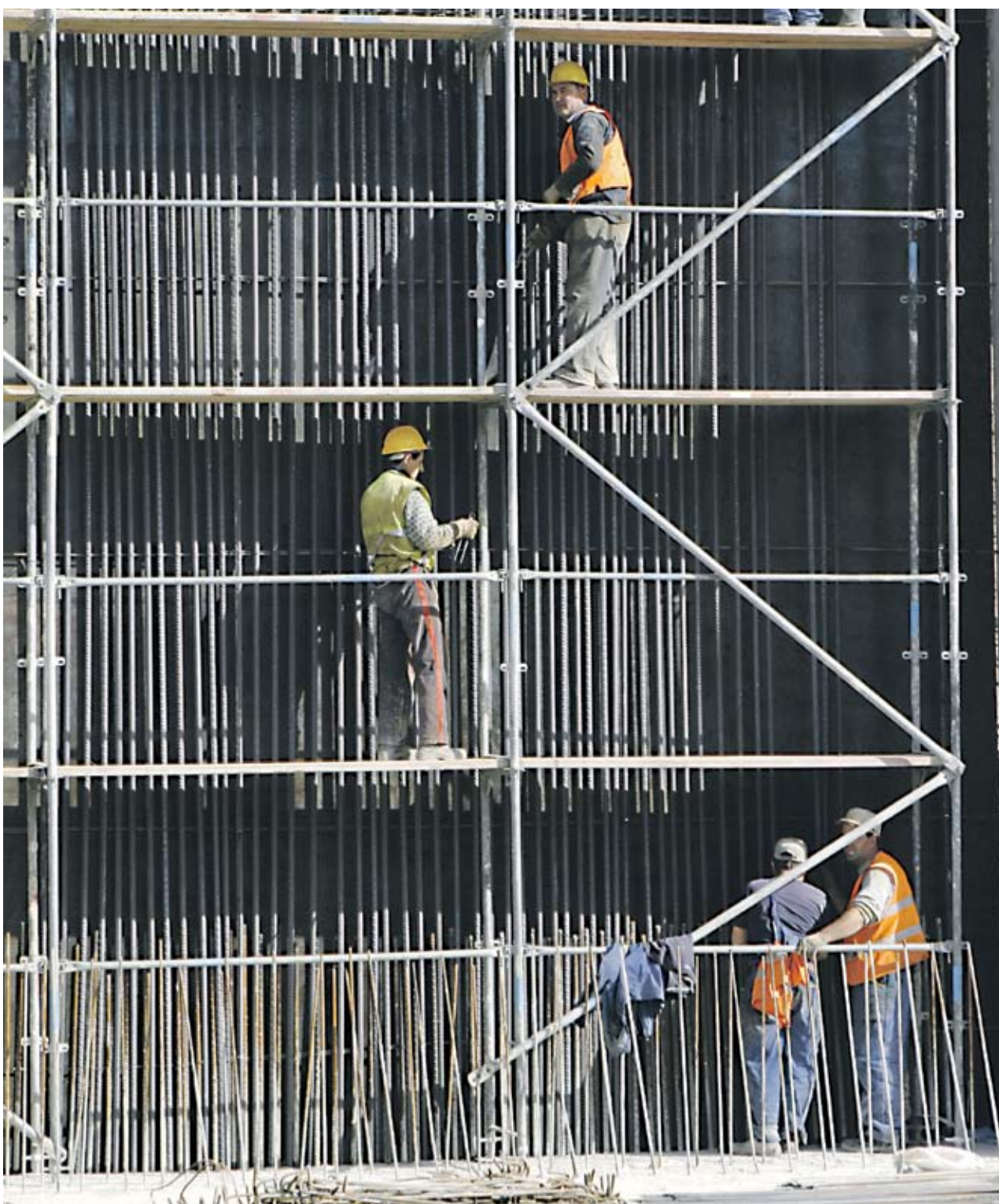
► Много фирми купуват този продукт като част от социалната отговорност към работниците си

Официалните данни на КФН показват, че в края на октомври миналата година в общото застраховане най-много приходи от „Злополука“ е реализирало „Булстрад“. Дружеството е продало полици за 3.05 млн. лв., което е 16.2% пазарен дял. Второто място е за ЗАД „Алианс България“, което има 2.93 млн. лв. приходи от този продукт, или 15.5%