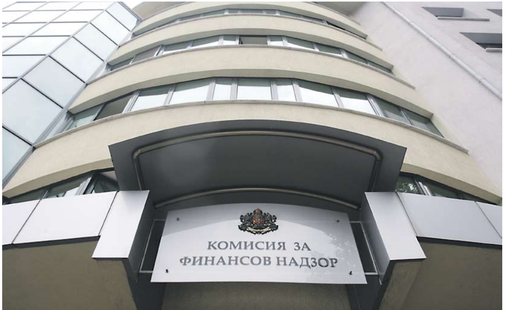
► Новият вариант на таксите, които КФН събира, трябва да бъде одобрен от Министерския съвет