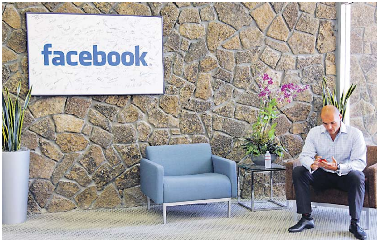
▶ В момента операторът на социалната мрежа Facebook се оценява на 50 млрд. USD

Офертата предизвика силен интерес, тъй като Facebook се оценява на 50 млрд. USD. Това е осуетило плановете на Goldman Sachs да продаде акции само на специалните си клиенти. Заради широкото медийно отразяване предложението е привлякло и вниманието на Комисията по ценни книжа и фондови борси и банката е решила да прекрати операцията в САЩ.