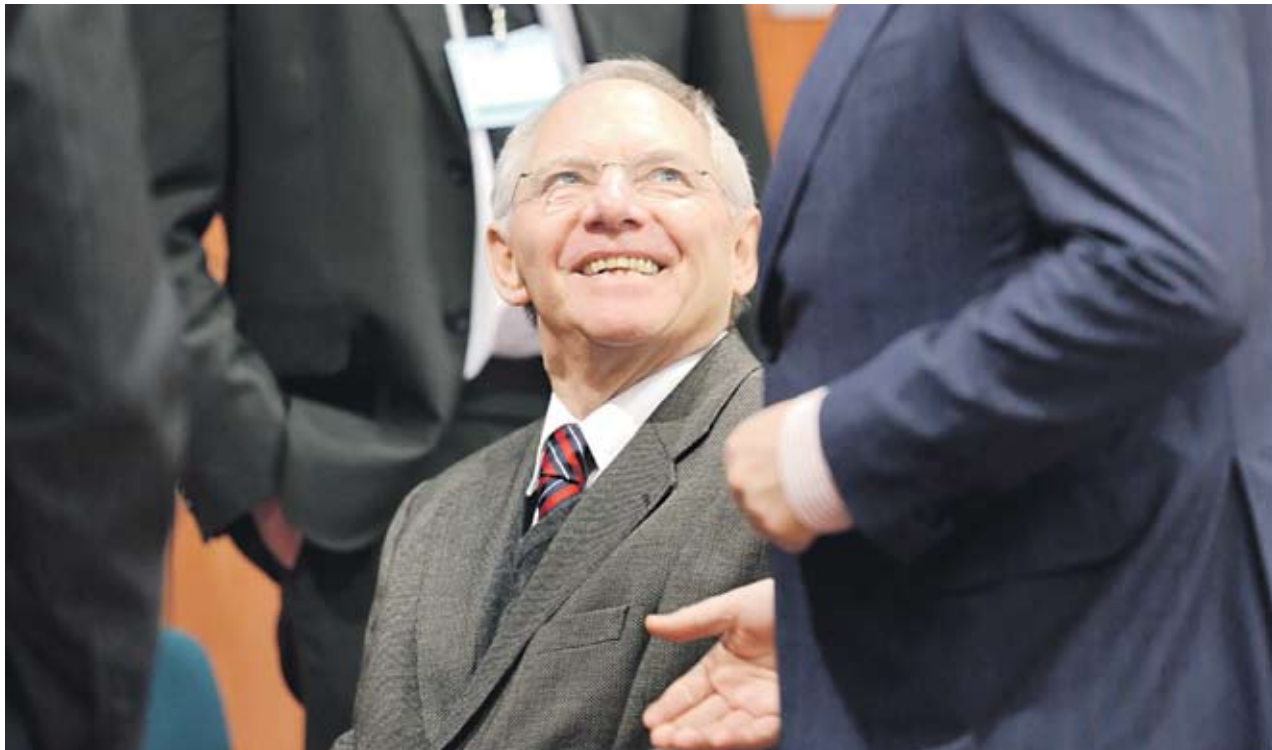
► Германският финансов министър Волфганг Шойбле каза, че пазарите са се успокоили и затова няма спешна нужда да се увеличава спасителният фонд

Проведените през 2010 г. стрес тестове на банките в Европа показаха, че критериите не са били много строги, тъй като в края на