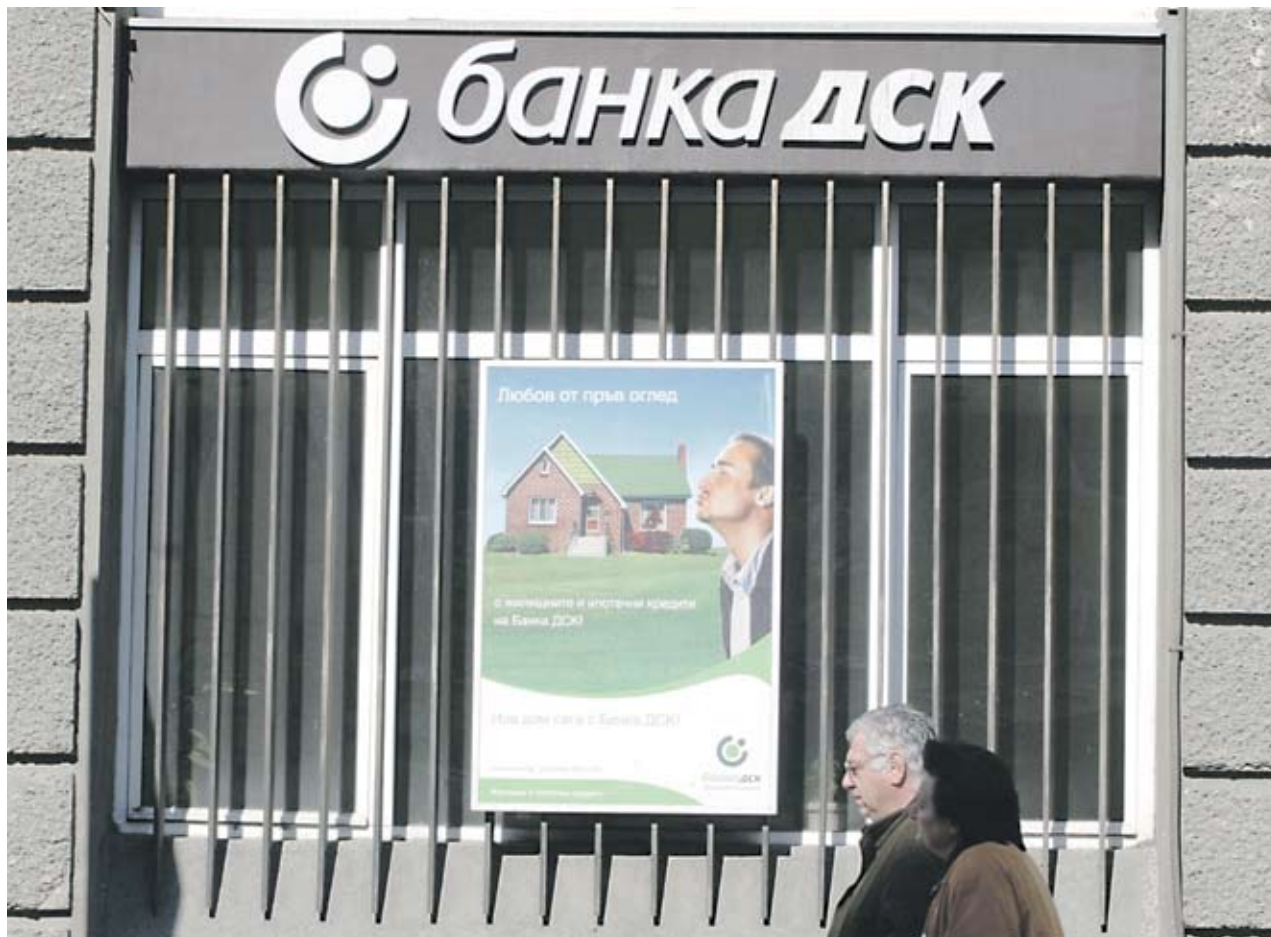
► Според bankerите промените няма да доведат до особен ефект за кредитополучателите. Икономистите са на мнение, че те крият риск от по-високи лихви

Според бившия еврокомисар по въпросите на потребителите Меглена Кунева не трябва да има наказателна такса при ипотечните кредити. Тя обаче обясни, че това би довело до много сложни преговори. Още преди година, когато беше обсъждана Европейската директива за потребителския кредит, споровете бяха