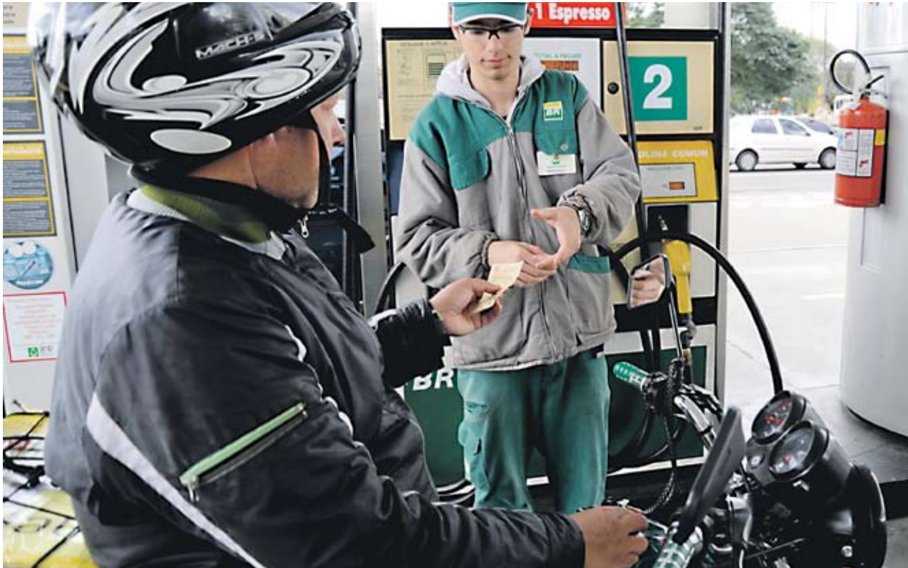
► По-голямото търсене на горива от световната икономика кара котировките на нефта да растат

добивът от платформите ще бъде възобновен. През миналата седмица цената на американския лек суров петрол се повиши с 4%, след като на 8 януари нефтопроводът