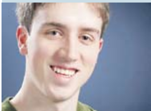
Адам Д'Анджело, гл. изп. директор на Quora

Все още не мислим да отваряме публичния достъп до сайта. Искаме първо да генерираме голямо количество качествено съдържание, а лимитираните акаунти са способ да контролираме спама и зловерните потребители. Винаги сме знаели, че искаме да бъдем система за въпроси и отговори. Не бяхме сигурни в детайлите, но сега сме убедени, че това ще е основният акцент на сайта.