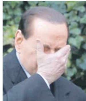
Губещ Силвио Берлускони

Компанията „Софарма Трејдинг“ с изпълнителен директор Димитър Димитров е реализирала продажби на стоки и оборудване за 401 млн. лв. от началото на миналата година, което е с 14.4% повече от 2009 г. На месечна база за декември 2010 г. спрямо същия период на 2009 г. продажбите са скочили с близо 23% до 41 млн. лв. Фирмата е реализирала печалба преди данъци в размер на 504 хил. лв.