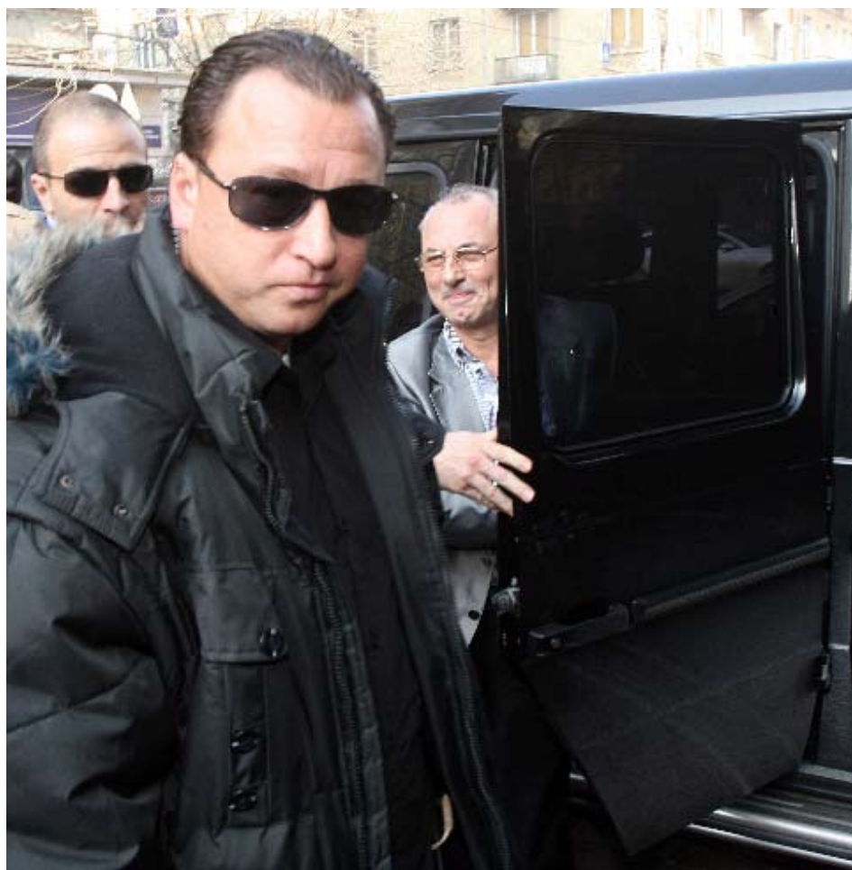
► Лигерът на ДПС Ахмед Доган, който не се появява на публични места в последната година, пристигна вчера на заседание на ръководството на партията. След това обаче той не се появи на пресконференцията. ДПС ще решава следващия месец дали да изключи от партията Касим Дал, който миналата седмица напусна ръководството и отправи обвинения срещу Доган