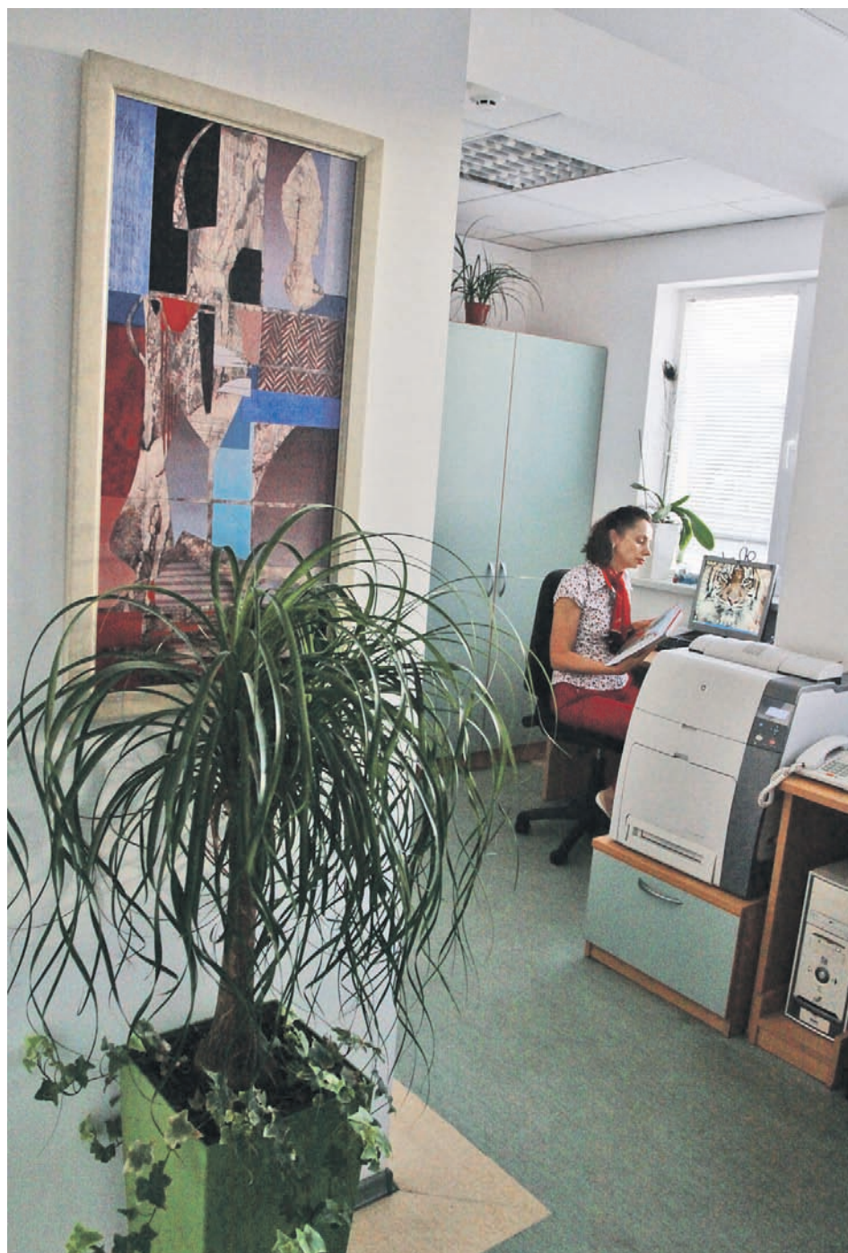
► Компаниите ще продължат с голямото преместване на офисите си и през 2011 г.

► процента от анкетиранияте вярват, че перспективата пред бизнеса у нас е добра