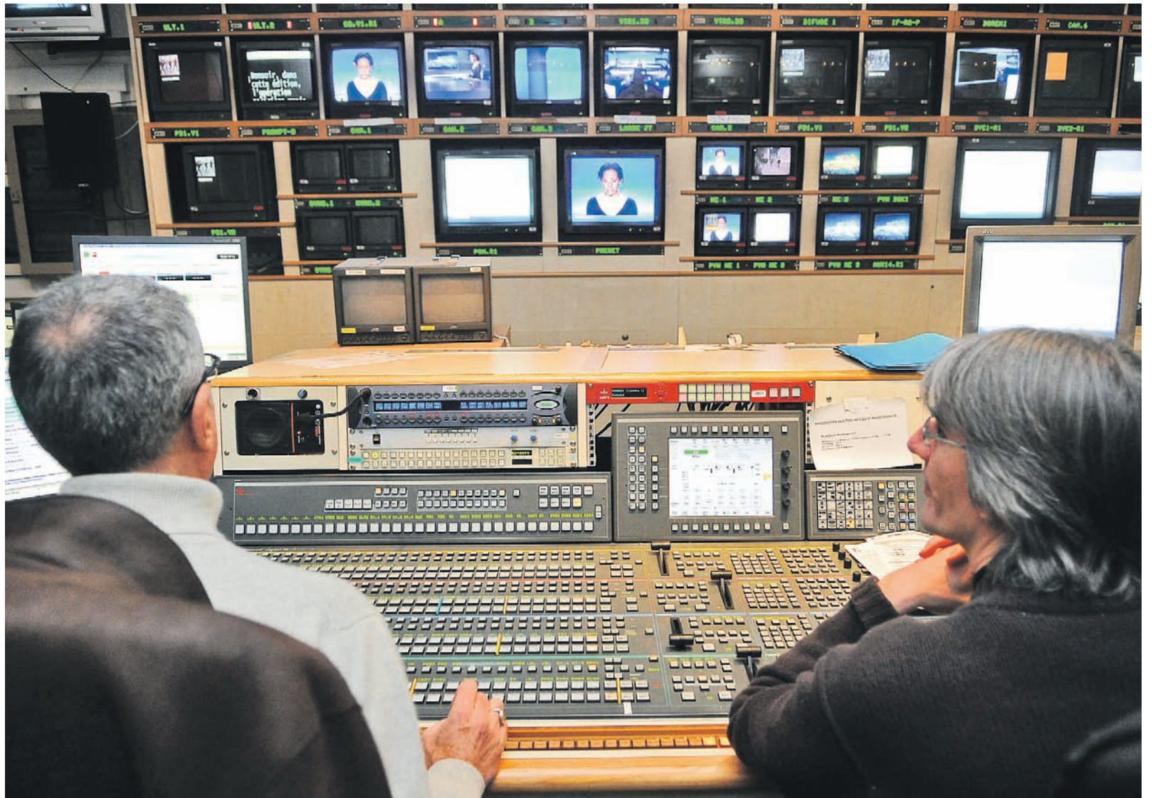
► News Corp прогаде на CME bTV заедно с двата прилежащи нишови канала, пет радиа и няколко списания за 400 млн. USD (300 млн. EUR)

За продажбата на bTV се говореше още от 2008 г., когато Рупърт Мърдок със свое изказване сигнализира, че ентусиазмът му за медийния пазар в Китай и Индия расте и се охлажда за този в Русия и Източна Европа. Сделката обаче стана факт две години по-късно. През февруари 2010 г. от News Corp обявиха, че продават собствеността си на CME за 400 млн. USD. Цената изненада медийните анализатори у нас. Мнозина очакваха тя да е доста по-висока. Месеца преди сделката агенцията "Ройтерс" съобщи, че bTV ще бъде продадена за 500 млн. USD. А само година преди сделката се говореше, че цената на телевизията заедно със специализираните канали и петте радиа