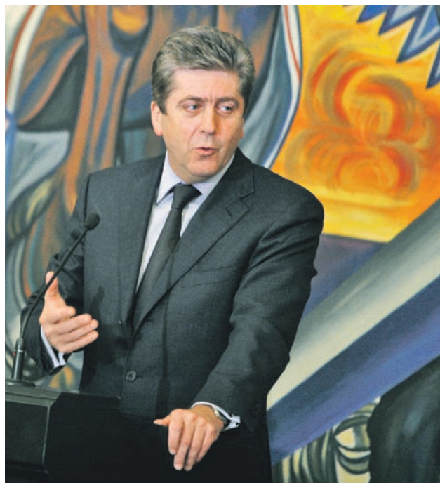
► Георги Първанов