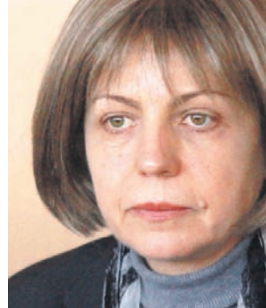
Губещ Йорданка Фандъкова

Силно поскъпване на борсата отбеляза на първата сесия на БФБ за 2011 г. "Трейс Груп Холд" АД, чийто главен изпълнителен директор е Цветан Цонев. Акциите на дружеството се оскъпиха със 7.7% до 58.15 лв. Така те достигнаха до най-високото си ниво от май миналата година. Добрите новини около пътният холдинг в последните дни на 2010 г. явно са оказали положително влияние върху търговията с акциите му.