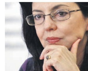
► Лигерът на ДСБ Иван Костов и бившият еврокомисар Меглена Кунева са сред потенциалните кандидатури