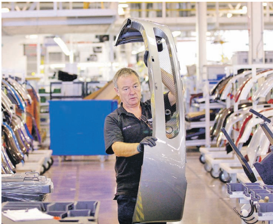
▶ Увеличението на поръчките за автомобилните компании е основната причина за отличните резултати на Германия