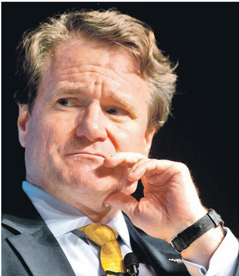
► Решаваме значителна част от проблемите, наследени след закупуването на Countrywide, като защитаваме интересите на нашите акционери, каза гл. изп. директор на Bank of America Брайън Мойнихан