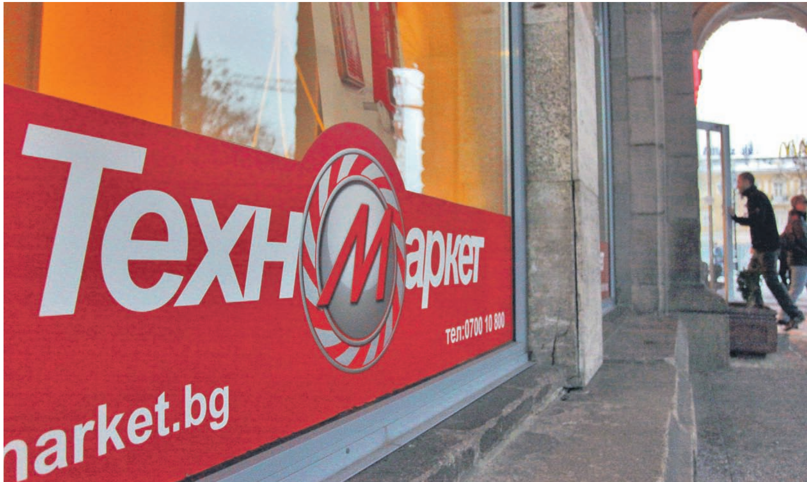
► Липсата на ликвидност и натискът на кредиторите принуждават мажоритарният собственик на обекта TechnomarketDomo да мисли за продажба

► процента са намалели консолидираните продажби на TechnomarketDomo за първите шест месеца на 2010 г.