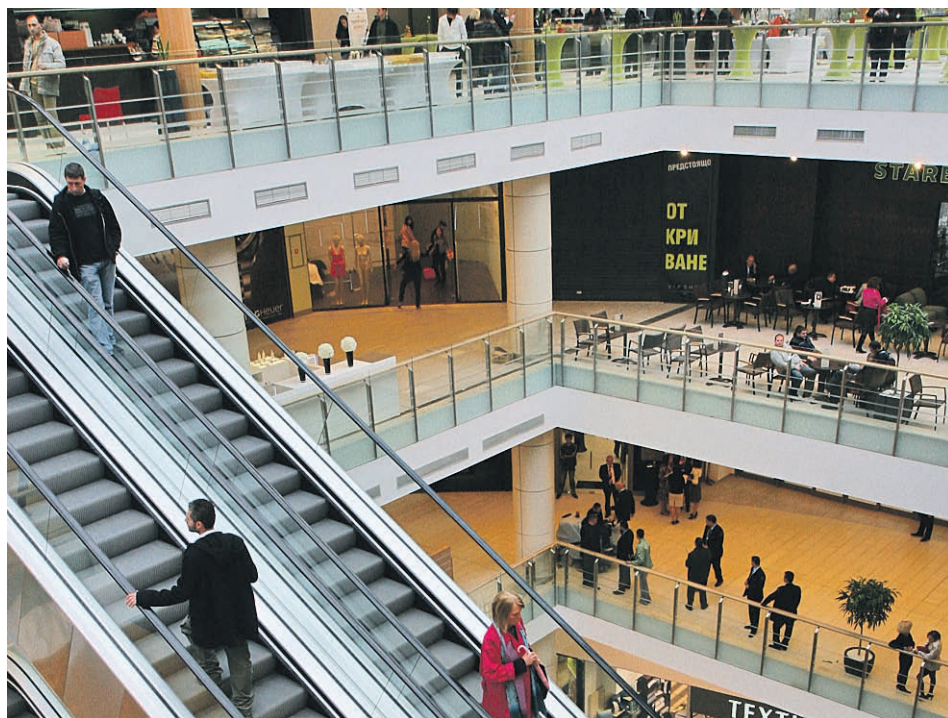
► Само 3 нови мола ще отворят врати през 2011 г.

Изключение правят централните части, “Изток”, “Изгрев”, където цените все още са твърде високи за възможностите на купувачите. Друг фактор за мотивиране на търсенето на имоти в определени райони се явява все по-агресивната експанзия