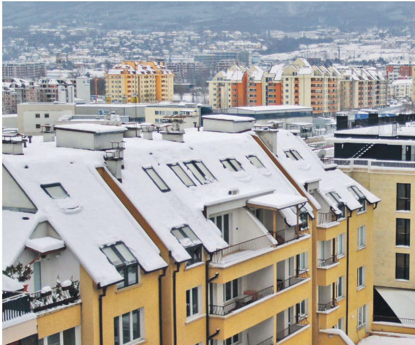
► Качествените жилища, с добра инфраструктура ще бъдат търсени и през 2011 г. Луксозните имоти ще

Очакванията са да се запази очерталата се тенденция банките да водят битка за клиенти на полето на ипотечните кредити, което ще окаже положително въздействие за раздвижването на имотния пазар. В същото време обаче от “Адрес” не очакват повишение на сделките с имоти през новата година в сравнение с отминалата.