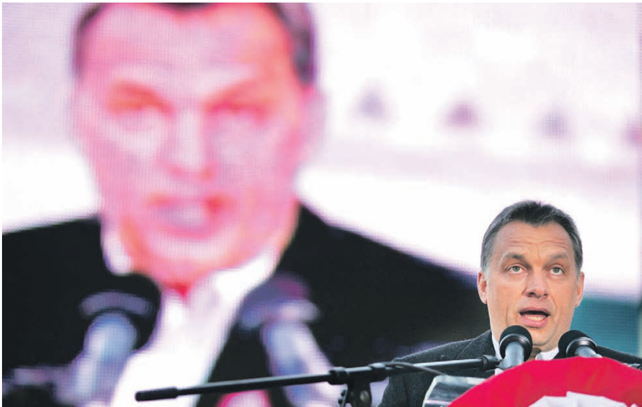
► Унгарският премиер Виктор Орбан застава зад медийния закон, който според анализаторите налага политическа цензура над медиите