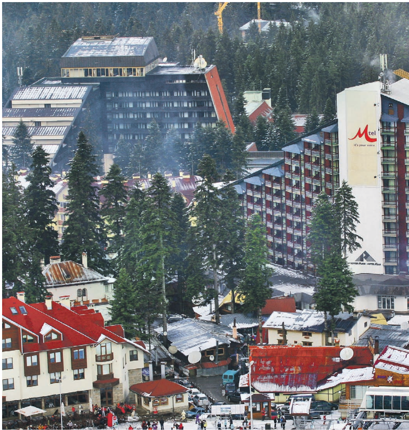
Хотелите в зимните ни курорти за поредна година бяха заети почти на 100% за посрещането на Нова година

Предварителната прогноза е за ръст от 5-6% в сравнение с миналата година