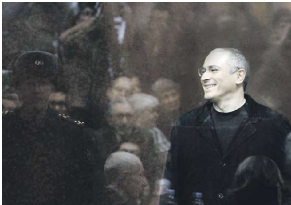
▶ Състоянието на Михаил Ходорковски се оценява на 15 млрд. USD от сп. Forbes

Кариерата на Ходорковски започва през 80-те години на XX в. като директор на фирма за внос на компютри, която е под чадъра на Комсомола. Четири години преди разпадането на СССР - през 1987 г., той основава една от първите частни банки Менатеп. Първите си милиони натрупва няколко години по-късно, когато редица държавни компании са приватизирани за жълти стотинки. През 1995 г. купува "Юкос" за 350