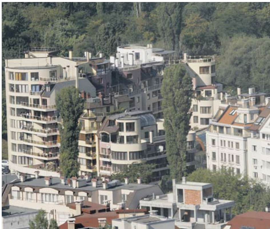
►Имотите на стотици хиляди български семейства можеха да се окажат обект на конфискация, ако проектозаконът "Кушлев" беше приет в последния си вид