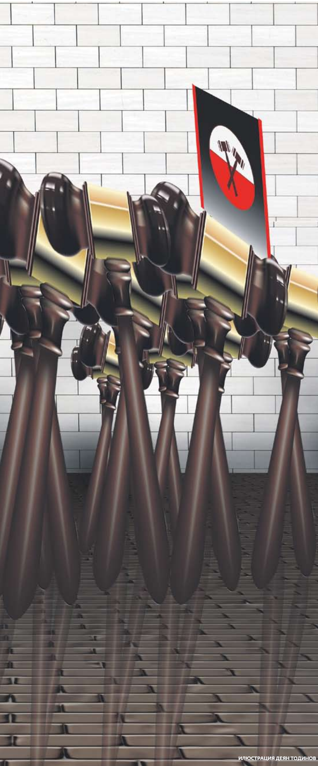
ИЛЮСТРАЦИЯ ДЕЯН ТОДИНОВ

Дали решението на правната дирекция на МС дойде като резултат от това, или пък има други причини, не е съвсем ясно. Със сигурност обаче по-добрият вариант е проектът да бъде задържан, докато проблемите бъдат изчистени и докато се намери гаранция, че мощното оръжие ще бъде насочвано само срещу тези, които са го заслужили по всички международни стандарти. ■