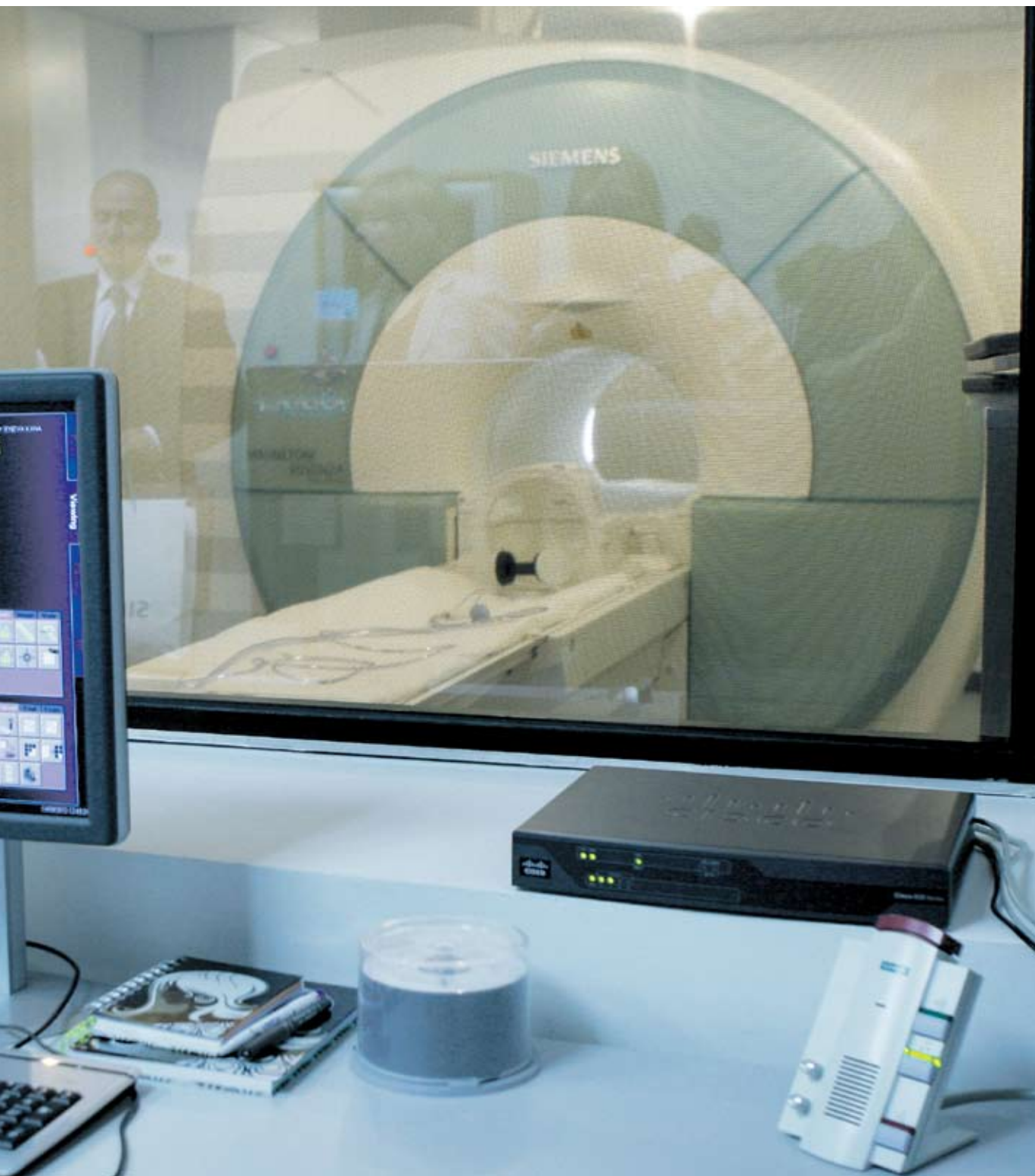
които няма да бъдат закрити, ще се инвестират над 288 млн. лв.