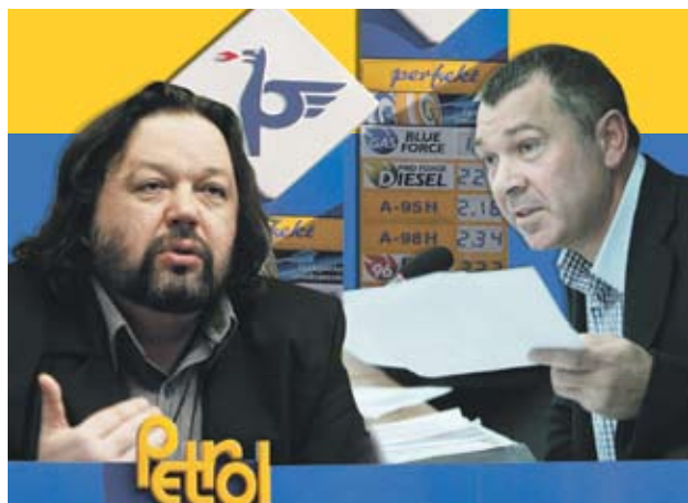
КОЛАЖ СТЕЛА МИХОВА

Обвиненията продължават с открити и платени писма до медиите