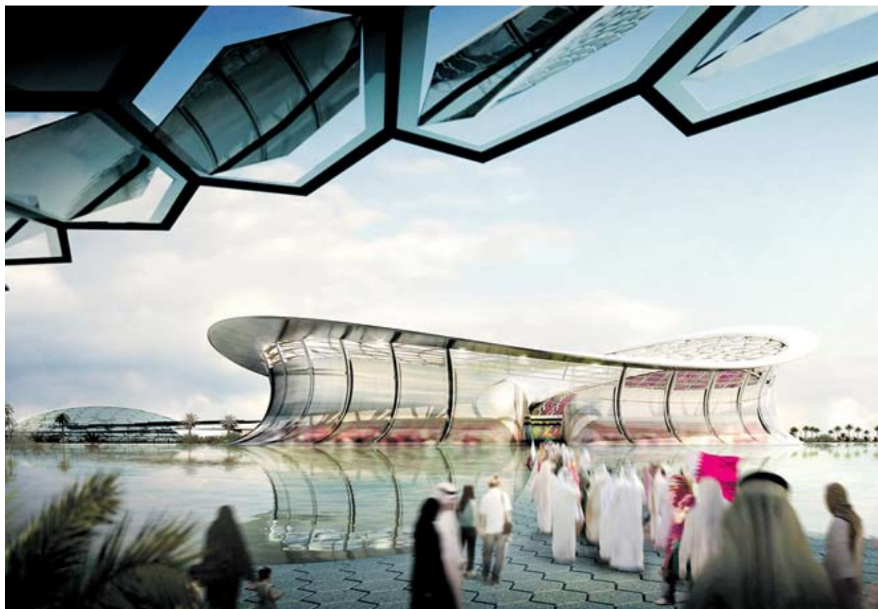
► Стадионът "Лосейл" е проектиран за Световното по футбол през 2022 г. и капацитетът му ще бъде 86 250 души