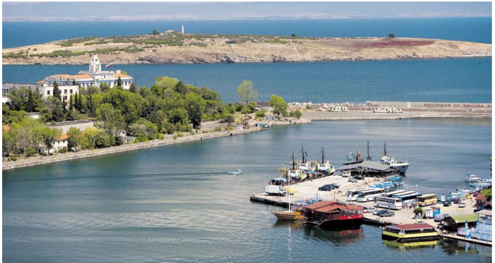
► Според легендите преди 2000 години на остров Св. Кирик се е извисявала огромната бронзова статуя на бог Аполон