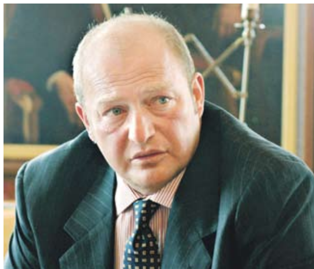
▶ Председател на борда на директорите на „Коч холдинг“ е Мустафа Коч

Доходът на 2200-те най-заможни домакинства тази година ще стигне 2.24 млрд. USD