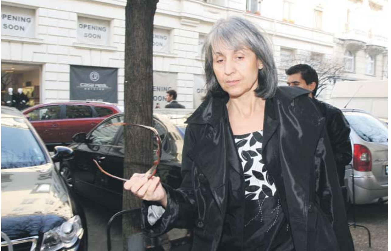
► Правосъдният министър Маргарита Попова видя злонамерена кампания в критиките към законопроекта. „Не изключвам и съзнателни инсинуации“, каза Попова