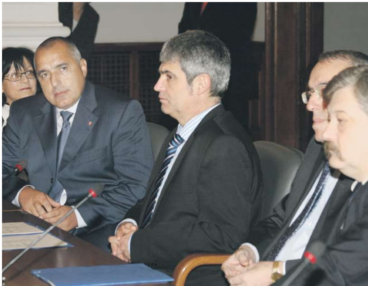
▶ Работодатели и синдикати подписаха споразумения за по-гъвкави форми на труд в присъствието на премиера Бойко Борисов