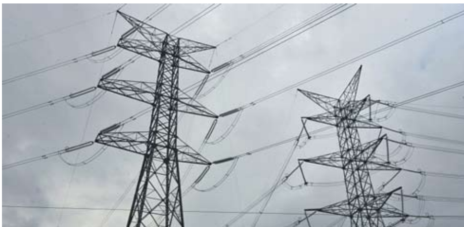
►Преди ген ДКЕВР определи забавените плащания по изкупуването на съоръженията като „лоша практика“, при която ползите са за ЧЕЗ, а загубите - за потребителите