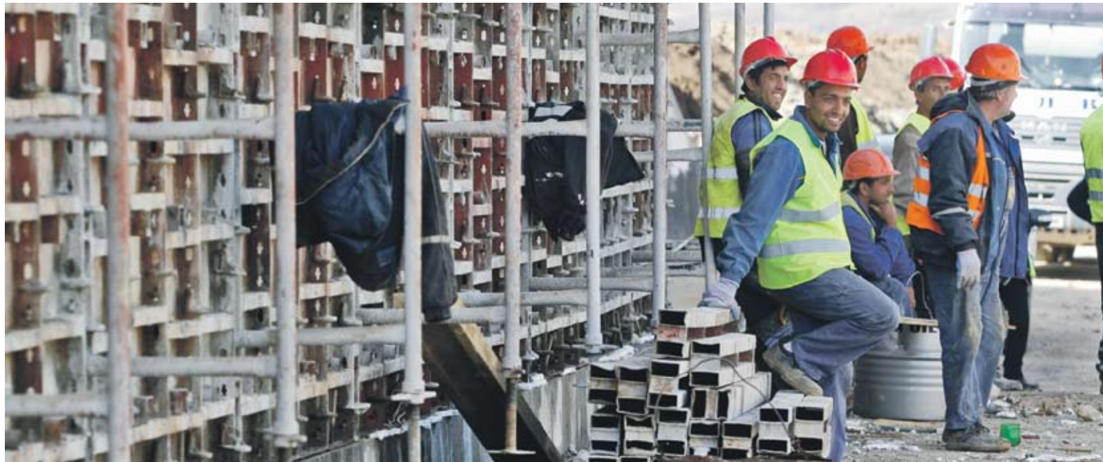
▶ Най-много неразплатени задължения има към строителния бизнес

По сметка в БНБ остават близо 210 млн. лв., предвидени за разплащане по тази схема, припомнят от финансовото министерство. Все още няма решение какво ще стане с този ресурс, но засега не се предвижда друга възможност за по-