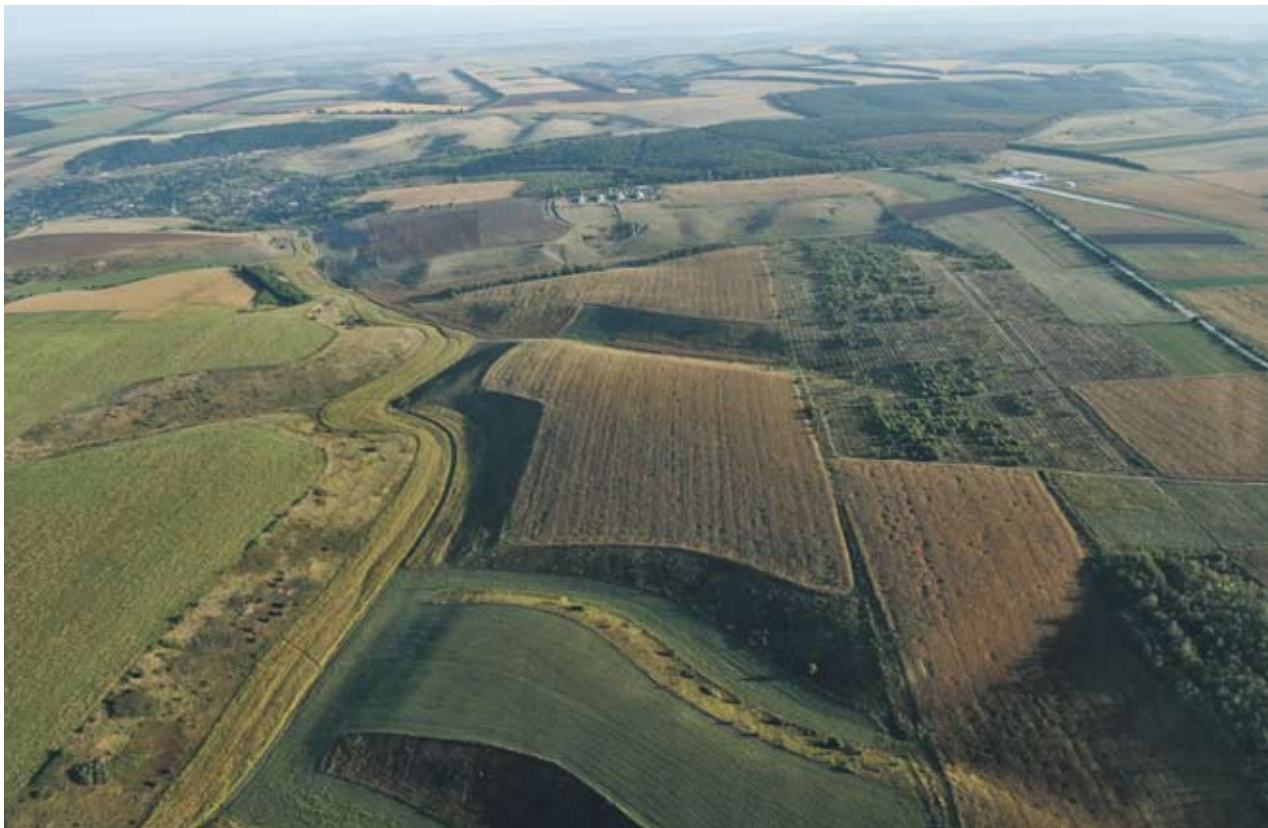
►Проблемът със закона е в липсата на ясни дефиниции и съответно възможността за свободно тълкуване