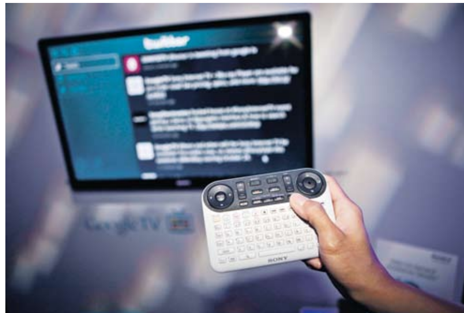
► Sony Internet TV, първият телевизор с висока резолюция, базиран на платформата Google TV

Фох, последната от които е най-големият продуцент на хитови телевизионни сериали в САЩ.