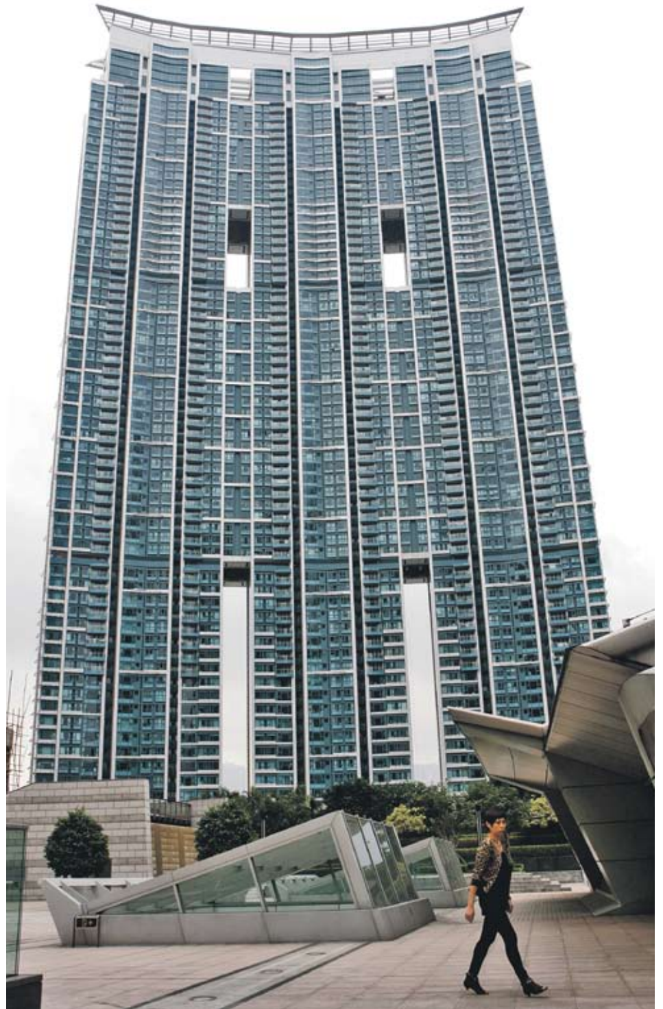
▶ Апартамент на 72-рия етаж в небостъргач в центъра на Хонконг беше продаден за 44 млн. USD.

▶ процента става таксата при продажбата на имот 6-12 месеца след придобиването му