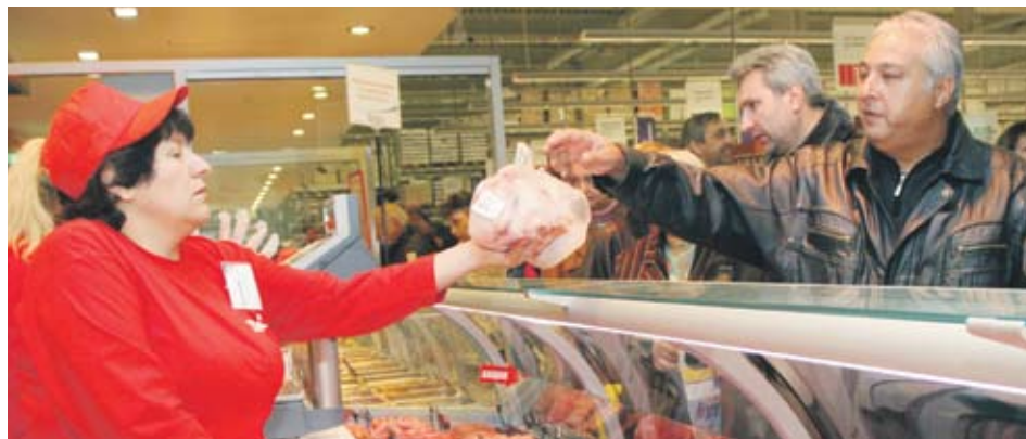
▶ Пада потреблението на месни продукти, плодове и зеленчуци

с миналата година. Така например българинът е похарчил 317 лв. за храна през третото тримесечие, докато преди година този разход му е струвал 322 лв. Статистиката отчита, че се е увеличило потреблението на картофи, хляб и кисело мляко, а пада потреблението на месни продукти, плодове и зеленчуци.