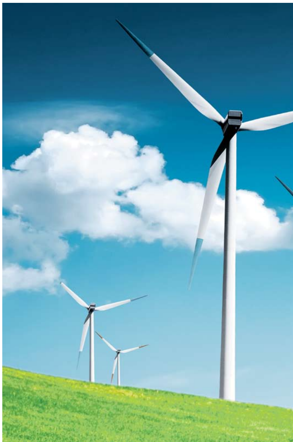
► Поредният проблем пред ВЕИ сектора може да отблъсне реалните вместо фалшивите