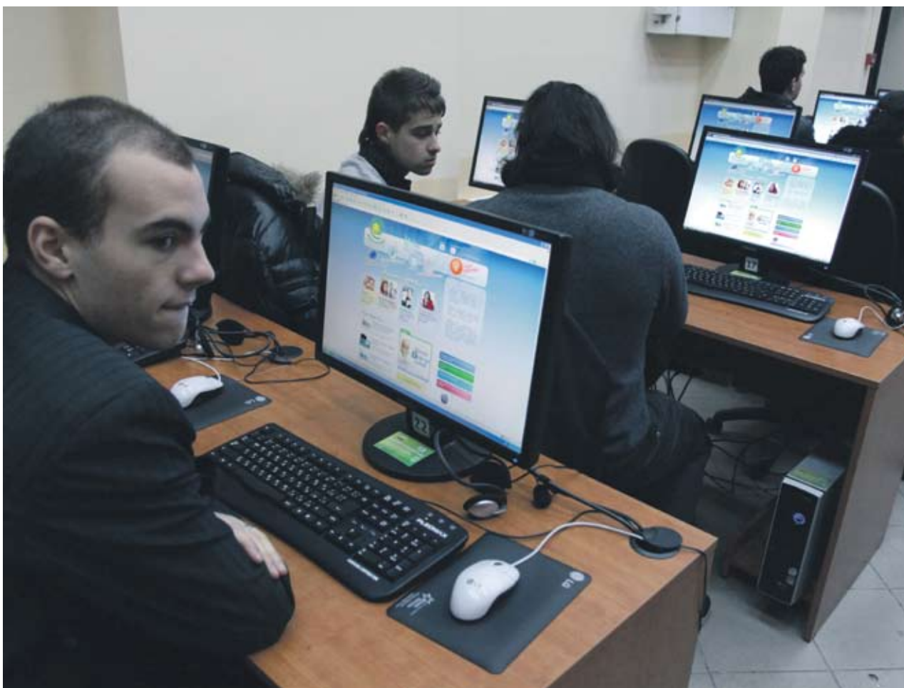
► Интересът към ваучерите за обучения на заети лица доведе до удвояването на евросубсидиите, предназначени за тази цел

2009 г. бе третата от старта на ОПРЧР и въпреки това тя бе приключена с отчайваща статистика. Договорените средства бяха само 21% от бюджета на програмата, а реално платените - около 3%. Не можем да кажем, че тогава имаше само един проблем - слабо разплащане. Към него трябва да добавим и изключително сложните условия за изпълнение на проектите, които понякога ги правеха неизпълними. Освен това имаше и силно забавяне както при оценка на подадените проекти, така и при одобрението на отчетите за изпълнение. Причината за всичко това, от една страна, бяха несъвършенства в нормативната уредба, но от друга (и то основна) - недостатъчният административен капацитет и неефективното използване на регионалните звена. През тази „черна“ година