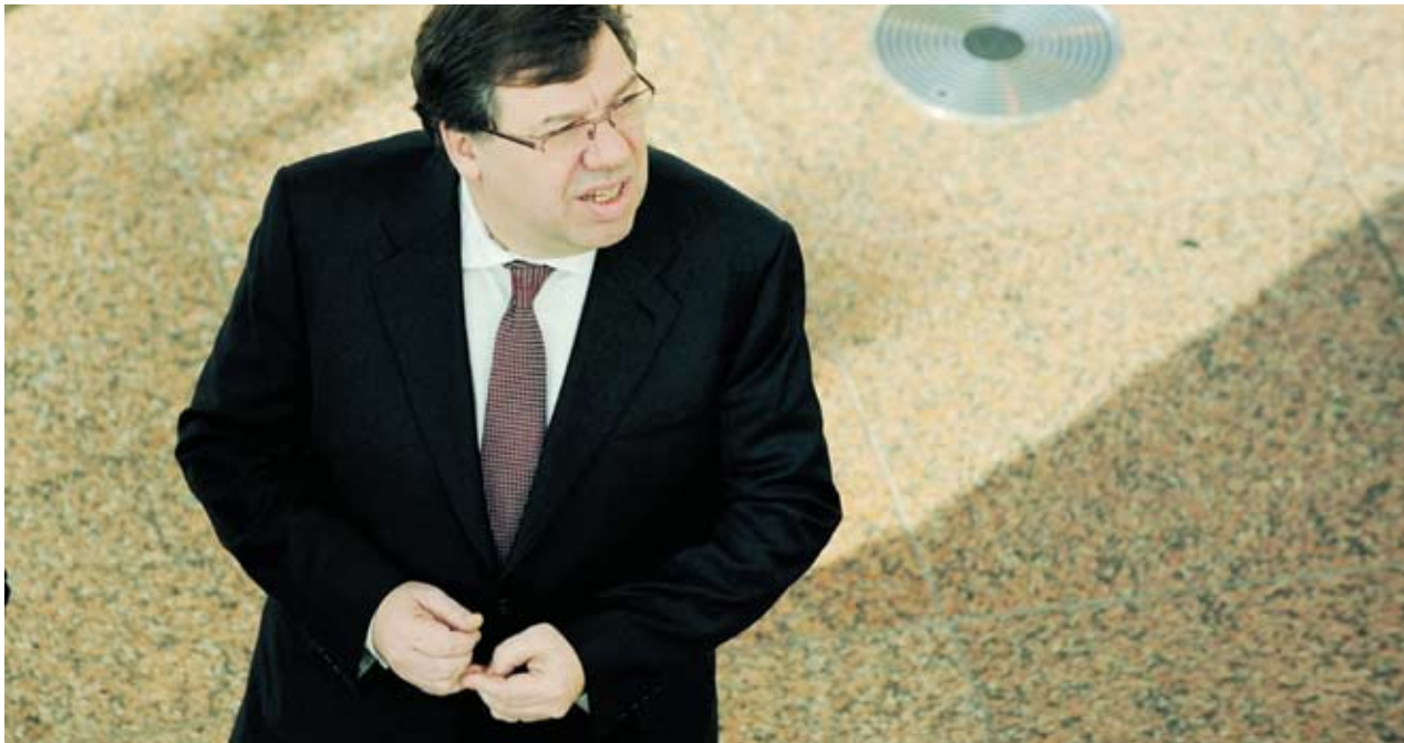
► Правителството на Брайън Кауън определи ниския данък печалба като „крайъгълен камък“ на политиката си отхвърли възможността той да бъде увеличен

Междувременно държавната ирландска телевизия RTE съобщи, че страната ще получи 85 млрд. EUR спасителен заем от ЕС и МВФ, но информацията беше частично опровергана