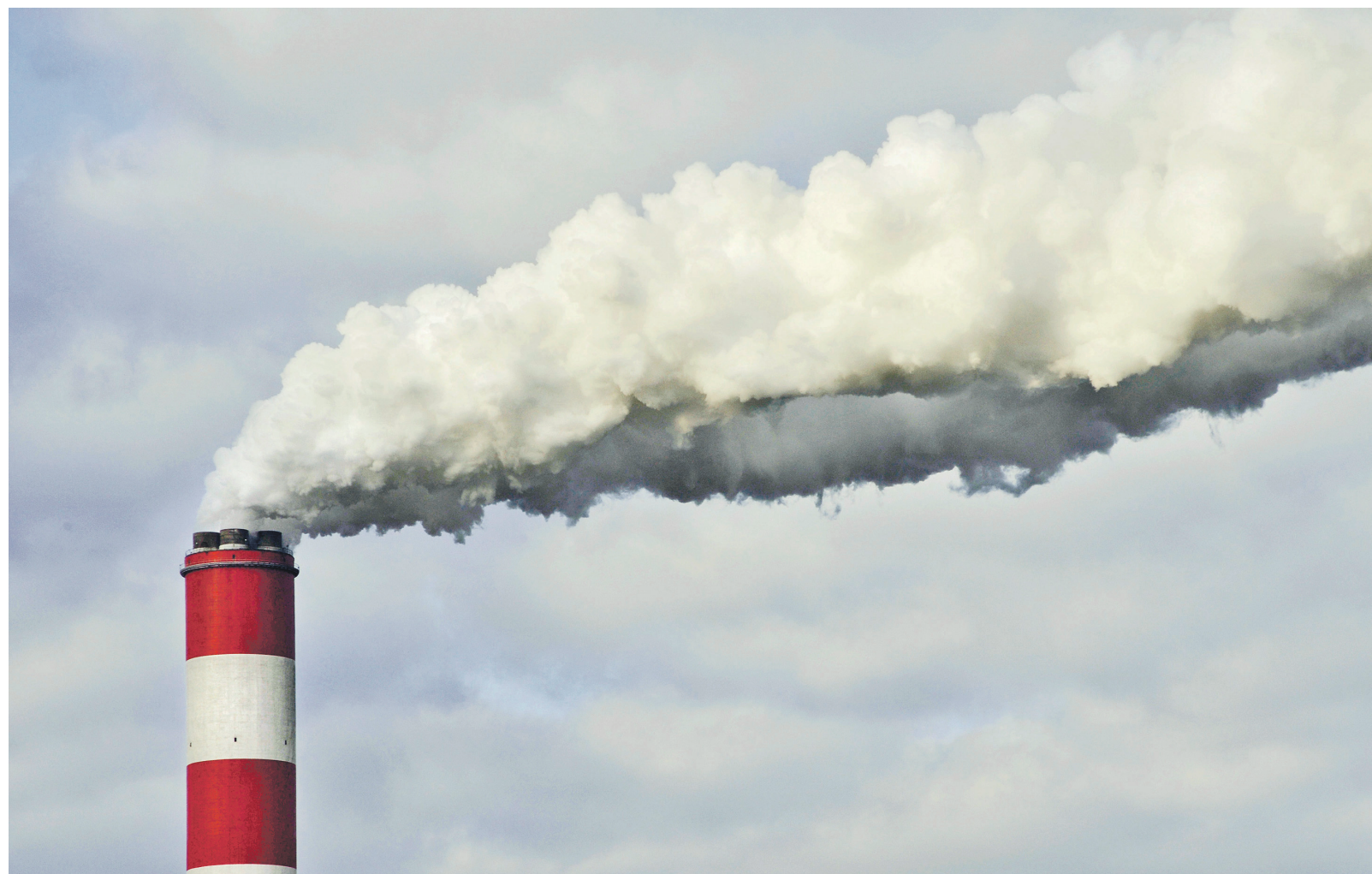
▶ Руската група Mechel гържи дял от „Топлофикация-Русе“ от 2007 г.

Руската група се занимава с производство на стомана и добив на въглища и според Bloomberg чрез сделката си гарантира още един пазар, тъй като русенската топлоцентра работи на твърдо гориво. Според Дмитрий Смолин, анализатор в московската компания UralSib Capital, българската топлоцентра е един от трите най-големи чуждестранни потребители на продукцията на Mechel. Според анализаторите придобиването ще увеличи капацитета на производство на Mechel с около 70%.