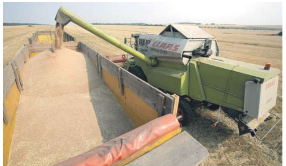
► Зърнопроизводителите могат да кандидатстват за кредитиране за покупка на семена и торове