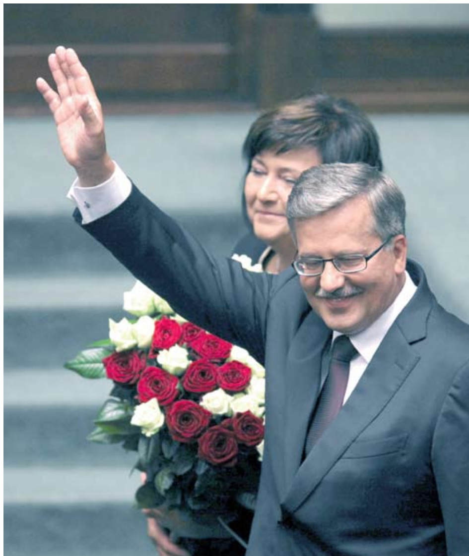
▶Бронислав Коморовски поема Полша в период на политическа стабилност, коментират анализатори

▶процента от поляците подкрепиха Бронислав Коморовски на втория тур от президентските избори в страната