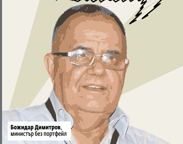
Божидар Димитров, министър без портфейл