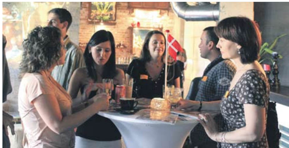
► Тук-тамовците споделяха личен опит с учениците, които искат да следват в чужбина, под флагите на различни държави от цял свят