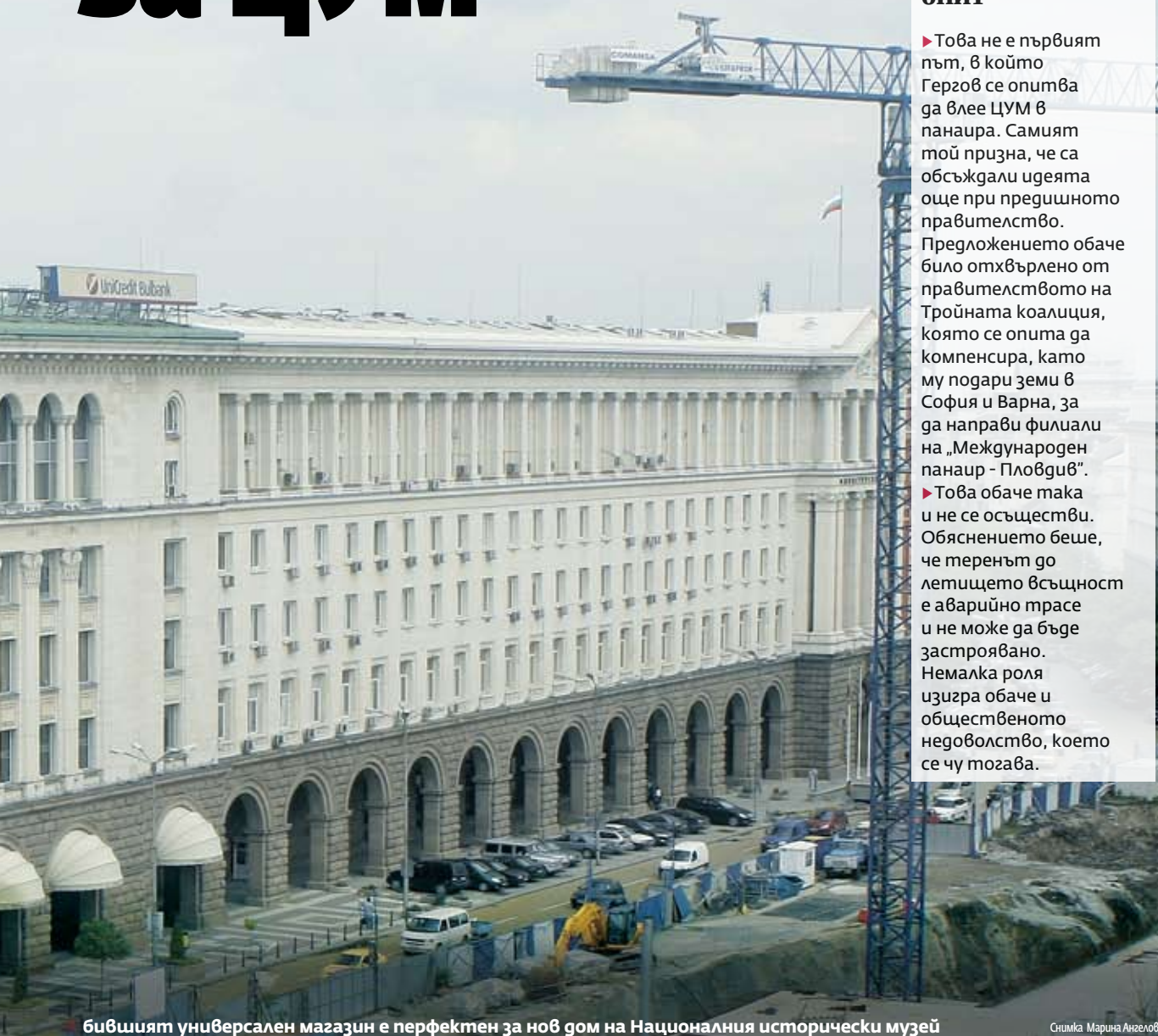
бившият универсален магазин е перфектен за нов дом на Националния исторически музей