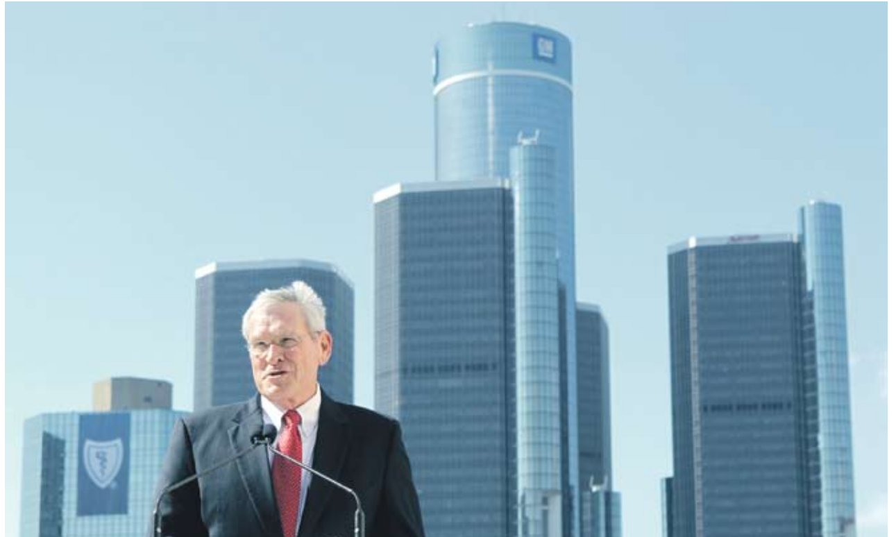
► Главният изпълнителен директор на GM Ед Уитакър каза, че най-вероятно всички акции ще бъдат предложени за търговия наведнъж

Компанията има намерение да отвори отново една от автомобилните си фабрики, която беше закрыта през 2009 г. Уитакър отказа да уточни за кой завод става дума. Две от предприятията на GM са в