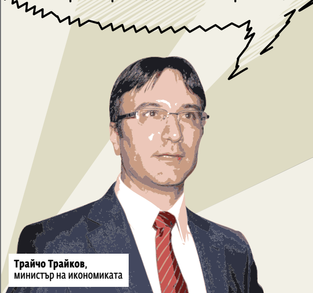
Трайчо Трайков, министър на икономиката

Това е неприемливо. Ние се борим точно срещу скритата приватизация на Панаира. Гергов да каже конкретна цена