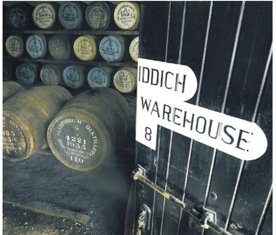
► Венецуела е най-големият пазар за скоч в Латинска Америка и шестият по големина вносител в света

Доставките на уиски започнаха да намаляват, след като Чавес затегна контрола над валутната търговия през май и закри нерегулирания пазар. Според него обменните бюра са виновни за изтичането на капитали, за налагането на изкуствени обменни курсове и за прането на пари. Решението си