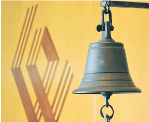
▶ На 3 август акциите на “Интеркапитал ПД” са били допуснати за търговия на Варшавската фондова борса

Кредиторите на “Интеркапитал ПД” задължиха фон-