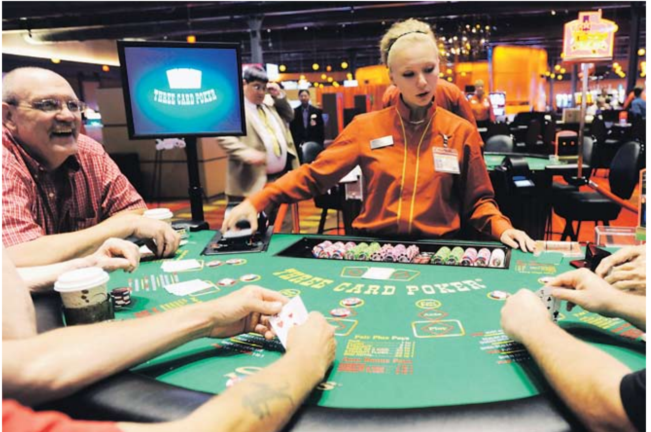
► За разрешение на игрално казино организаторът трябва да докаже инвестиция от поне 600 хил. EUR според новия закон за хазарта

Според асоциацията именно наличието на казина в големите хотели ще привлече платежоспособни туристи, дори и извън активния сезон. Срещу забраната на игрални зали в хотелите се обявили и от повечето туристически асоциации, сред които Българският съюз по балнеология и SPA туризъм,