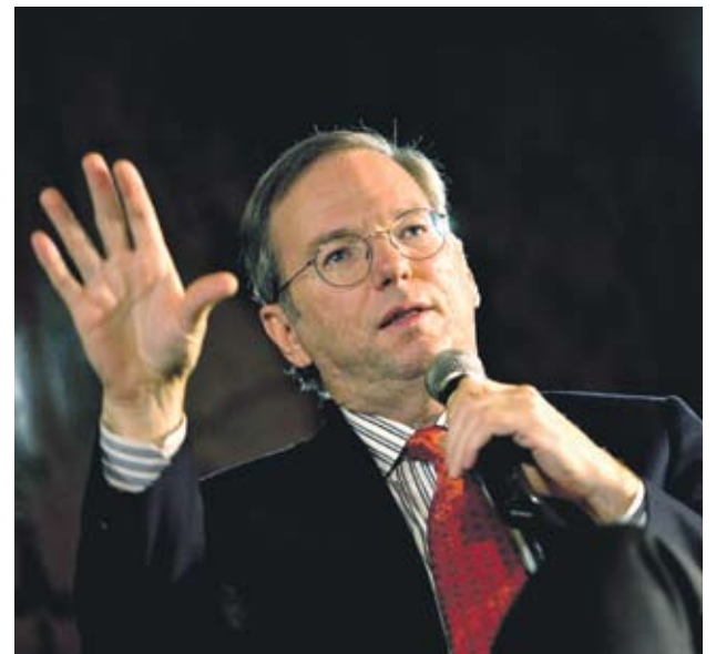
► Главният изпълнителен директор на Google Ерик Шмид не вижда нищо нередно в преговорите с Verizon

Дори и този сценарий не се нрави на обществото. „Интернет е твърде голям, за да оставим бъдещето му в ръцете на две компании“, смята от фондацията Public Knowledge.