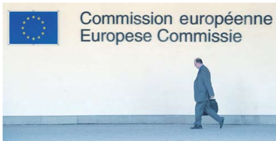
▶Спасителният фонд на Брюксел ще се опита да гарантира стабилността на еврото

Дори и дотогава фондът ще може да издава облигации, гарантирани от страните членки на еврозоната.