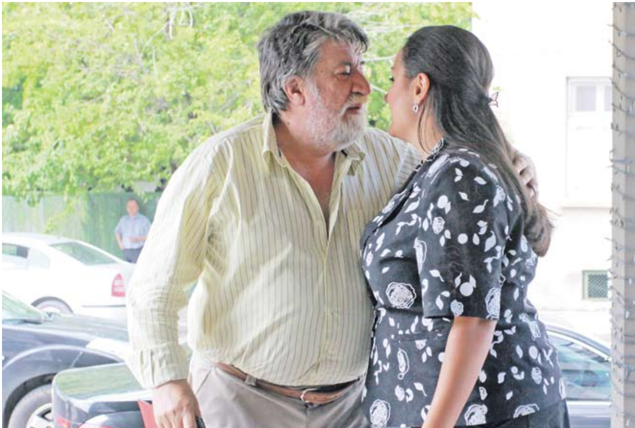
► Министърът на културата Вежди Рашидов ще получи близо 11 млн. лв. за ремонт и модернизация на културни институти в страната

"През следващите 3 седмици ще бъде отворена схема, по която ще може да кандидатстват всички общини с над 10 хил. жители за ремонтване на културно-исторически обекти на тяхна територия", каза регионалният зам.-министър. Общините ще може да кандидатстват общо за 173 млн. лв. налични свободни ресурси за културното наследство по ОП "Регионално развитие".