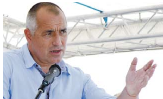
► Борисов обеща да изплати парите по проекта след завършването на ремонта

През ноември 2009 г. беше постигнато споразумение срещу приемането на нови 30 хил. т софийски бали боклук на сметището край Цалапица срещу 8 млн. лв., които държавата трябва да изплати. Пловдив трябва да получи 3 млн. лв., а община Раковски - 5 млн. лв.