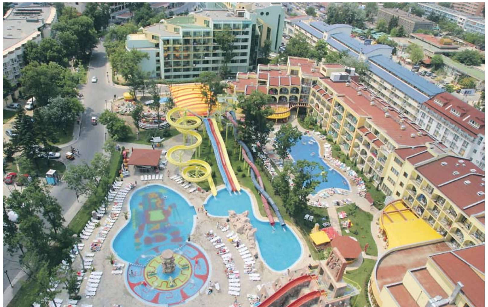
► След Слънчев бряг за данъчни хайки да се готвят и другите ни морски курорти