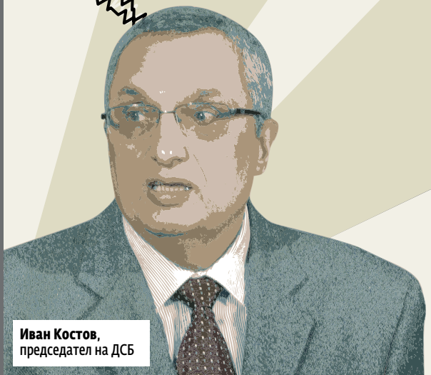
Иван Костов, председател на ДСБ

Това ще бъде идеалното съчетание с най-богата археология на града, която е точно пред магазина.