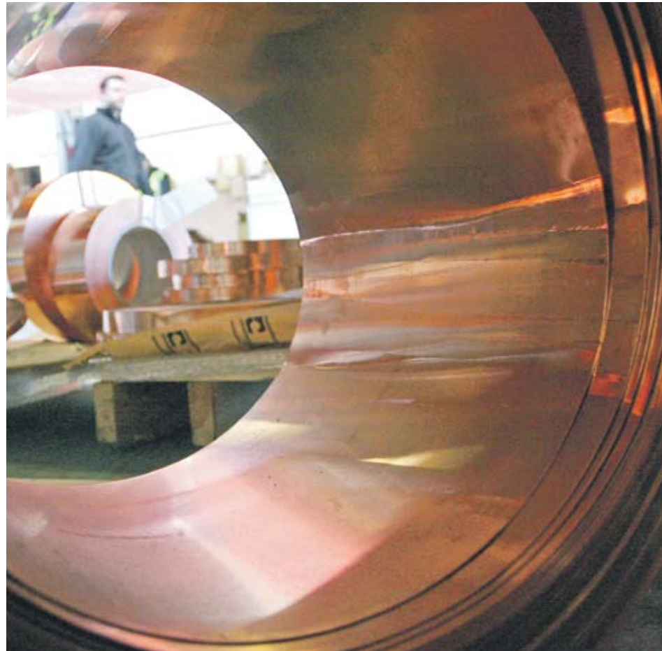
► Рестрикциите при ипотечното кредитиране ще свият търсенето на мед от страна на Китай

На борсата в Лондон фючърсите на метала за септември поскъпнаха с 0.62% до 7431.9 USD/t. Тримесечните фючърси също поскъпнаха с 0.05% и се котираха за 7403 USD/t. На борсата в Шанхай медта се търгуваше за 57 770 юана за тон (8534 USD/t), което е повишение с 0.6%.