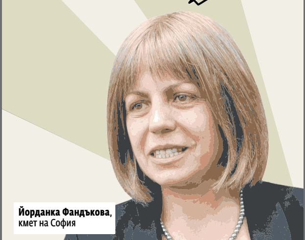
Йорданка Фандъкова, кмет на София