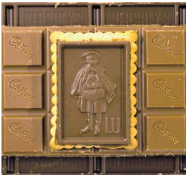
► Шоколадите на Cadbury увеличиха продажбите на Kraft Foods, след като гигантът предложи по-висока оферта за придобиване на компанията от конкурента Hershey Co.

След придобиването на стойност 19 млрд. USD свободно търгуемите акции на американския производител се увеличиха с 18%. В резултат на това печалбата му на акция се сви от 0.56 до 0.53 USD, пресмята WSJ. Консолидираните приходи от продажби са скочили с 25% през първото полугодие до 12.25 млрд. USD. Органичният растеж на гру-