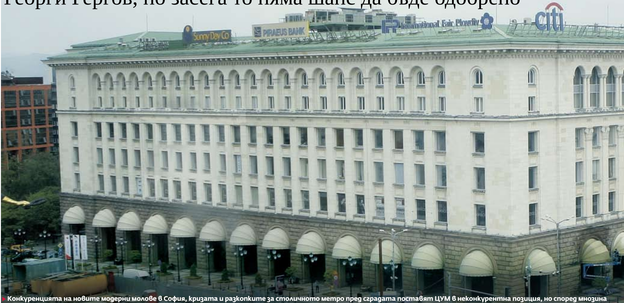
Конкуренцията на новите модерни молове в София, кризата и разкопките за столичното метро пред сградата поставят ЦУМ в неконкурентна позиция, но според мнозина