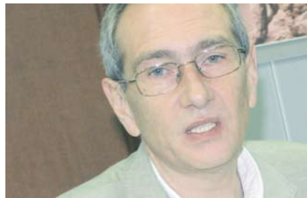
► Дистанционното обучение е най-подходящо при надграждането на вече придобити знания и умения, смята един от авторите на SUDigital доц. д-р Тодор Попнеделев