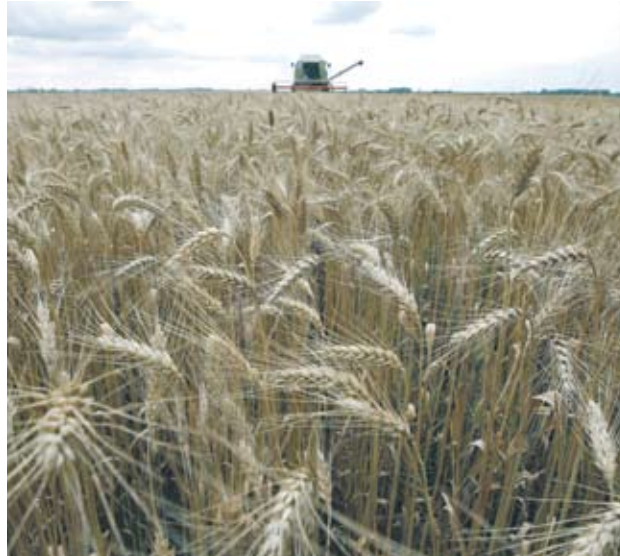
► По думи на пазарни наблюдатели тези резки изменения няма да продължат дълго, защото се основават предимно на спекулативни сделки

На Софийската стокова борса имаше само оферти за покуп-