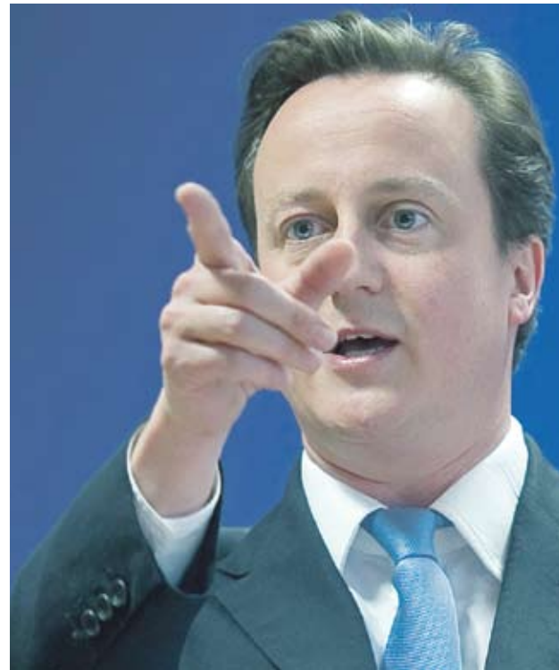
▶Правителството на Дейвид Камерън планира да съкрати държавните разходи с 6 млрд. GBP

По изчисления на R3 броят на фалиралите компании през 2010 г. ще достигне връх от 27 797 фирми, или с 5% повече спрямо 26 443 година по-рано. Разсрочено плащане на данъци на стойност повече от 5.2 млрд. GBP са договорили над 200 хил. компании от ноември 2008 г. насам, отчитат от асоциацията.