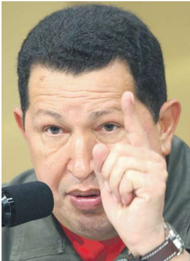
► Венецуела е една от страните с най-висока консумация на глава от населението, каза президентът Уго Чавес

► процента достигна месечната инфлация в страната през април 2010 г.