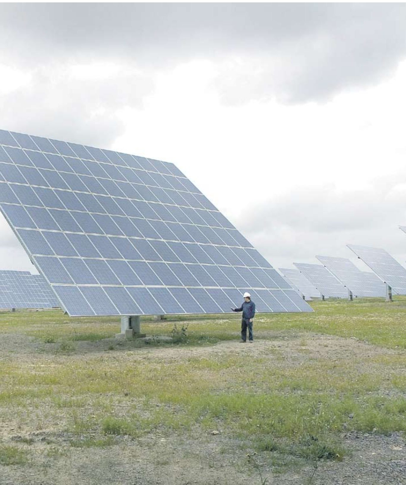
почне да се разсейва след 2015 г., смятат представители на бранша

► процента е спадът в цената на фотоволтаичните панели за 2009 г. по данни на БФА