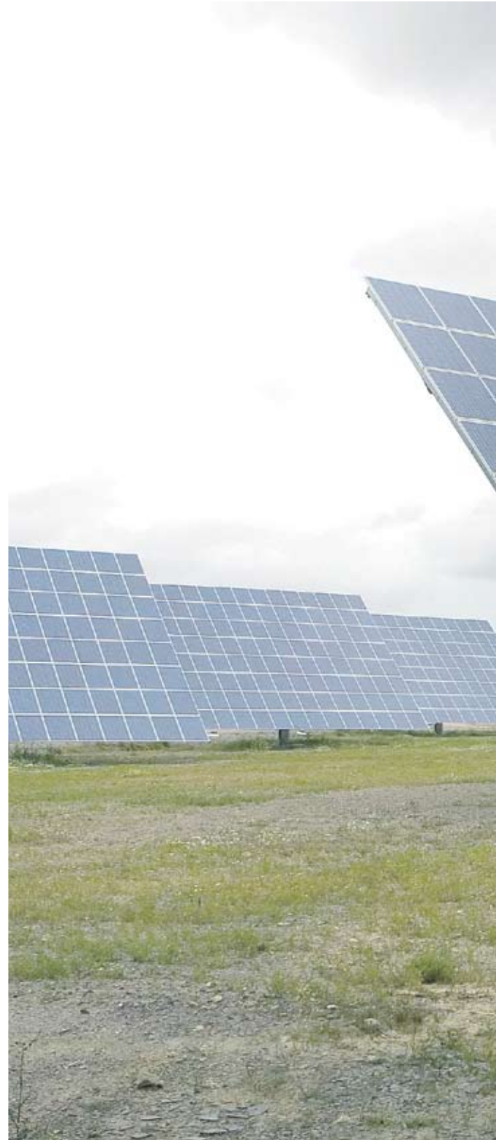
►Облачното небе над пазара за ВЕИ енергия в България ще за...