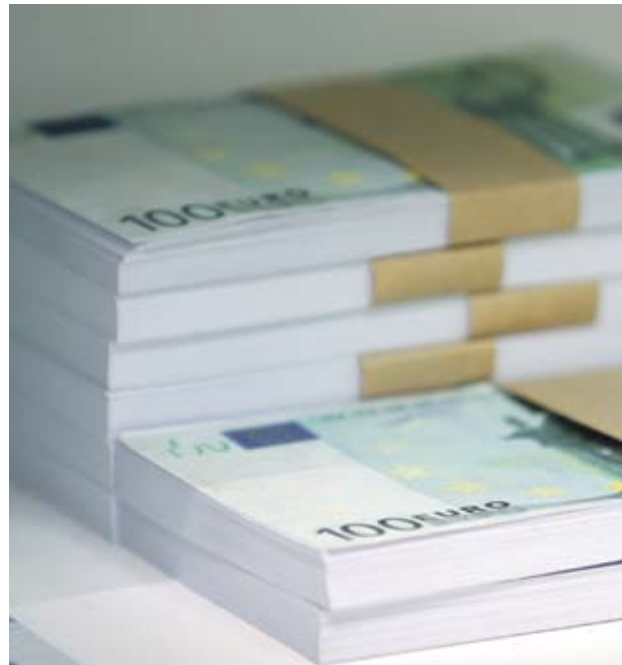
Европейската валута спечели въпреки критиките около методологията на извършените тестове

Британският паунд направи по-добро представяне от еврото, подкрепен от спекулациите, че фискалните и икономическите условия на Острова ще се подобрят по-бързо от тези в САЩ и еврозоната. Според редица анализатори това ще принуди ръководството на английската централна банка да започне да повишава лихвите в страната доста по-рано от колегите си от двете страни на океана. Двойката GBP/USD се котираше при 1.5489, което е повишение от 0.41%. Ако в следващите няколко дни станем свидетели на по-сериозен пробив над 1.5560 GBP/USD, заформилият се възходящ тренд от края на май ще се потвърди.