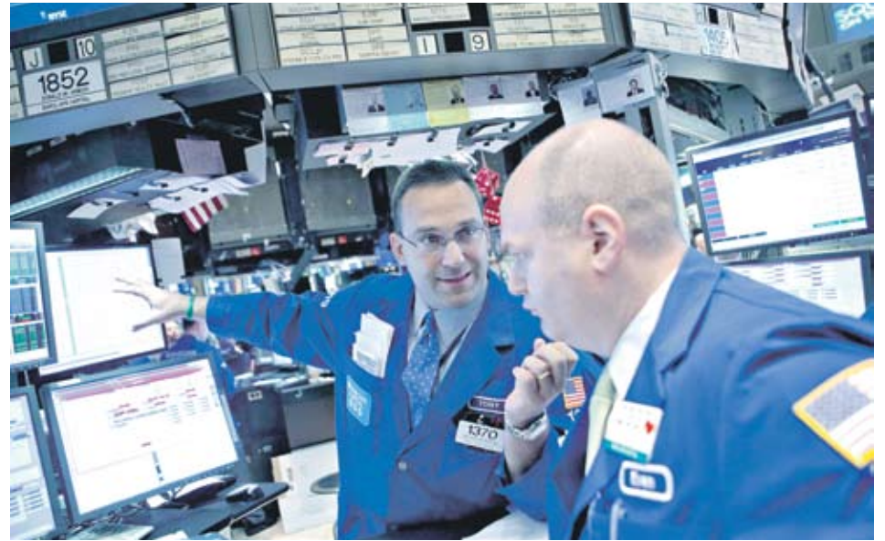
Скептицизмът на икономистите не позволи по-голямо повишение на борсите в Европа

Джим Роджърс, един от най-известните в света инвеститори и президент на „Роджърс холдингс“, заяви пред CNBC.com, че проведените тестове са били по-скоро PR упражнение, целящо да вдъхне сигурност на и без това разклатената европейска финансова система. Според него към сега приложените