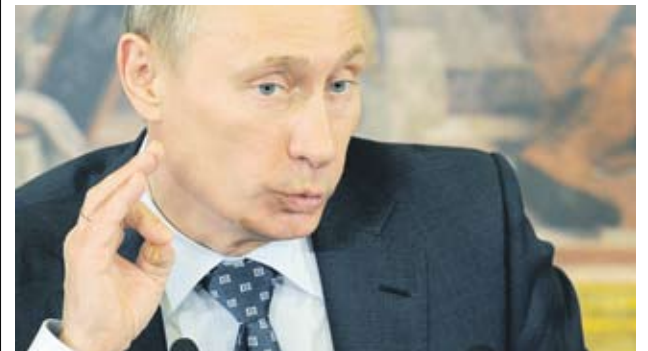
► Премиерът Владимир Путин е одобрил списъка с дялове за продажба

Русия се стреми да намали бюджетния си дефицит до 4% от БВП догодина и до 2.9% през 2012 г. спрямо около 5% тази година. Финансовото министерство е направило предложение за продажбата на отделните активи, така че Москва да получи по около 300 млрд. RUB (9.88 млрд. USD) през всяка от следващите три години. По оценка на Reuters обаче само от шест публични компании в списъка Москва може да вземе над 30 млрд. USD. Това не включва гигантите РЖД и „СовКомФлот“, които не се търгуват на борсата.