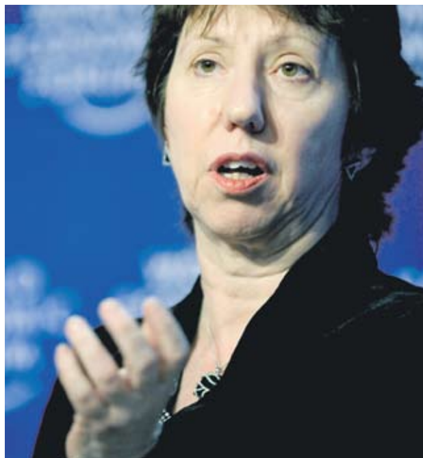
► Катрин Аштън, еврокомисар по външната политика

Брюксел наложи тежки санкции срещу арабската държава