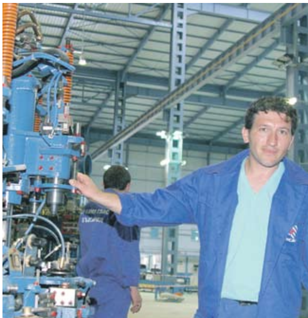
► По-високата осигуровка ще вдигне безработицата, смята финансовият министър Симеон Дянков

Финансовият министър заяви, че не подкрепя вдигането на осигурителната вноска от 2011 г.