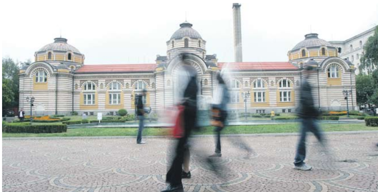
Общината може да получи до 6 млн. лв. по европрограма, за да превърне банята в музей с минерална вода

Графика: Гриша Струнчев * Повечето проекти ще се реализират за срок от няколко години