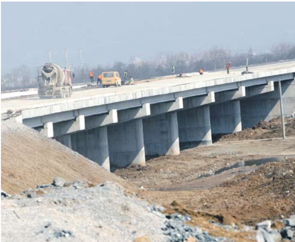
► В момента в строеж са 81 км магистрала в страната