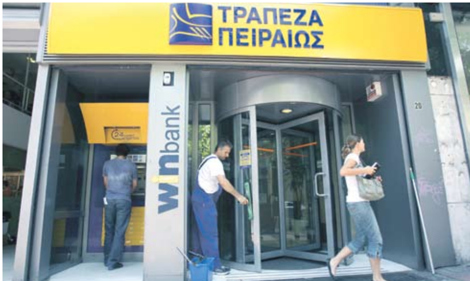
► Piraeus Bank ще използва част от увеличението на капитала, за да върне на гържавата осигуреното през 2008 г. помощно финансиране

Agricultural Bank of Greece беше единствената гръцка банка, която не издържа проверката. Регулаторите отчетоха, че при негативен пазарен сценарий трезорът ще има адекватност от едва 4.4%, което показва капиталов недостиг от 243 млн. EUR. Ръководството на банката вече обяви намерения да увеличи капитала с 1 млрд. EUR до края на