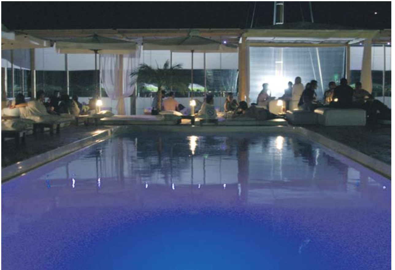
► След като хотелите по Южното Черноморие нямаха ток в продължение на 30 часа, обстановката вече се нормализира. "Форсмажорните" обстоятелства обаче донесоха финансови загуби и накърнен имидж за туристическия бизнес

"Всеки, който е пострадал, трябва да си търси правата и където спре топката - там е. НЕК има общи условия с директните си клиенти и ЕРП-тата. ЕРП-тата имат общи условия с техните си клиенти, сред които са и туроператорите и хотелиерите. Туроператорите и хотелиерите имат договори със своите клиенти - туристите. Когато туристите започнат да предявяват претенциите си, тогава исконете ще тръгнат по обратната верига и там, където някой е в нарушение,