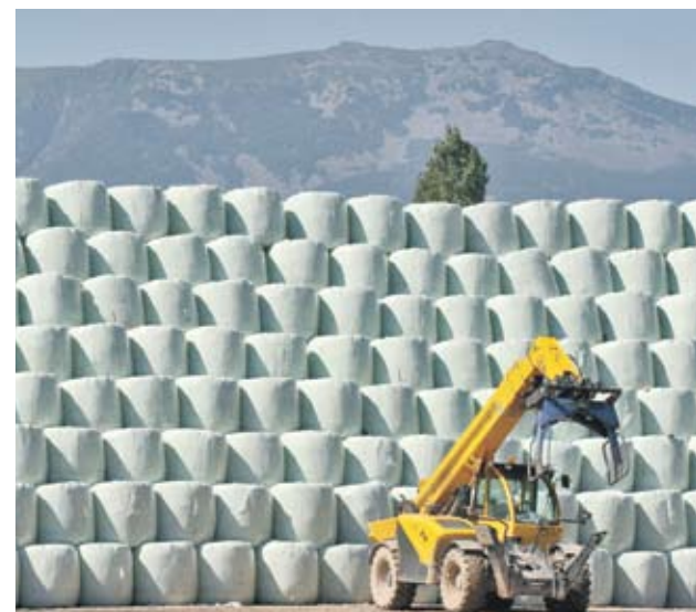
▶ Балирането, съхранението, превозването и депонирането на отпадъците ще струва на Столична община над 100 млн. лв.

За извозване и депониране на 60 хил. т балирани битови отпадъци до карловското депо Столичната община ще трябва да плати 3 076 500 лв. Разходите за депониране на 40 хил. т боклуци край Ловеч ще са 1 910 000 лв. За 20 хил. т балирани битови отпадъци, които ще бъдат транспортирани до община Севлиево, ще бъдат похарчени 1 100 000 лв. Приблизително толкова ще бъдат платени и за депониране на 30 хил. т бали на депото в Цалапица. За извозване и депониране на 16 хил. т балирани битови отпадъци до