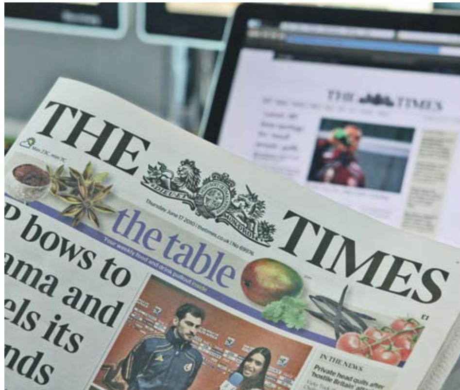
▶ Противниците на сделката твърдят, че тя ще ограничи медийния плурализъм във Великобритания, тъй като News Corp вече е индиректен собственик и на вестниците Times, Sunday Times, Sun и News of the World

Дори на 22 декември покупката да получи зелена светлина от Брюксел, това не означава автоматично, че тя ще се реализира. Американската медийна група официално поиска от ЕК да одобри сделката в началото на ноември. Още на следващия ден обаче британският министър на икономиката Винс Кейбъл възложи на антитръстовия регулатор Ofcom да проучи дали това няма да се отрази на конкуренцията, като решението се очаква до края на годината. В зависимост от препоръката на Ofcom министърът ще трябва да реши дали да поиска пълно проучване, което може да отложи сделката с около година.