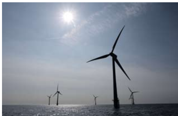
▶ Изграждането на вятърни паркове е част от усилията на Европа да намали вредните емисии

Както планираният вятърен парк в морето, така и