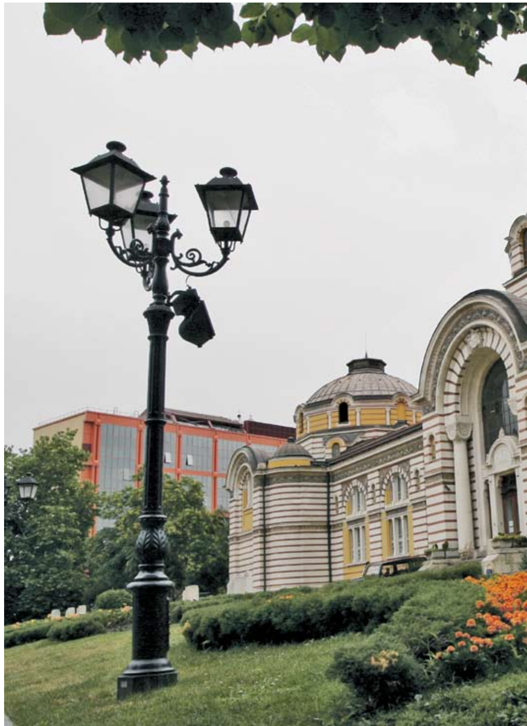
► През следващата година ще бъде направен пореден опит на столичното кметство

Парадоксът е, че години наред една красива сграда, паметник на културата, която се намира в самия център на столицата и е непосредствено до сградата на правителството, стои празна и неизползвана. ■