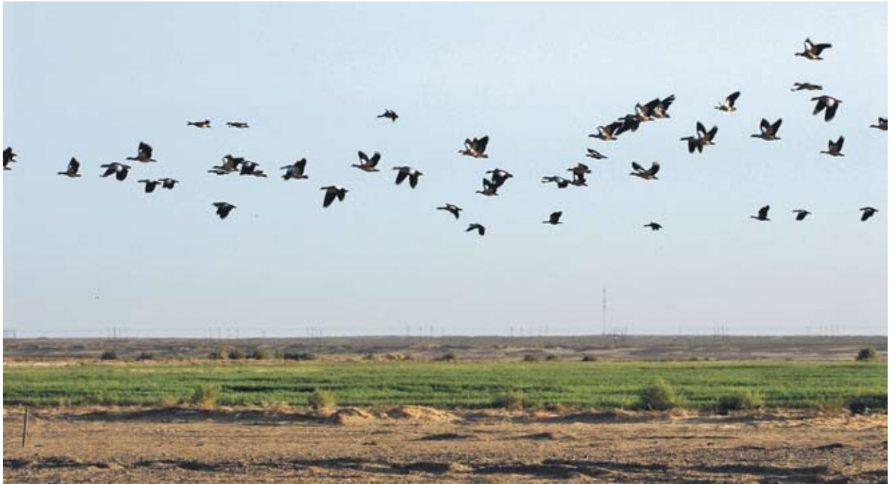
► Земеделската земя може да стане сериозен източник на доход за общините, смятат от БАС33