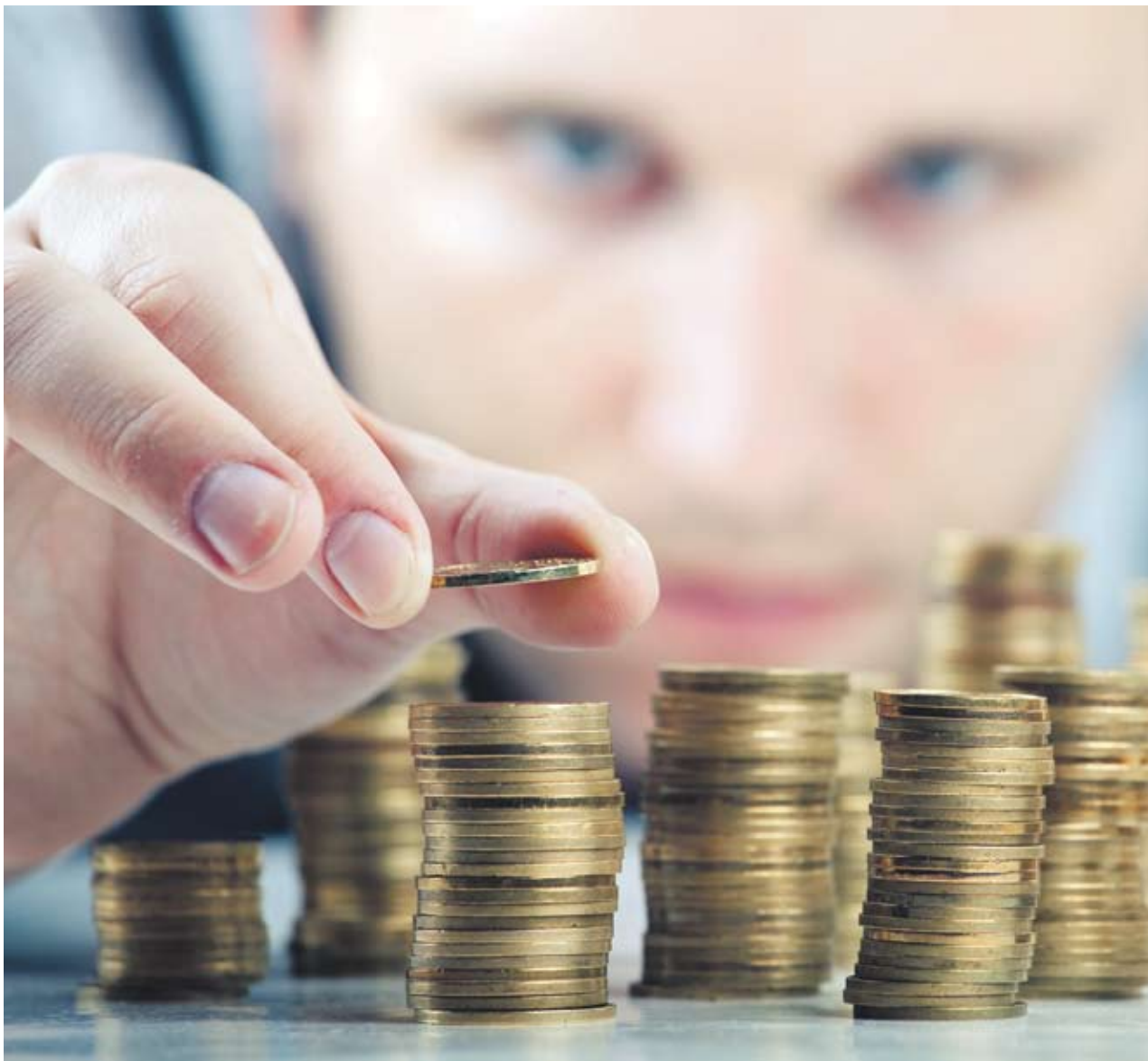
► У нас основната грижа на българските предприемачи са спадащите печалби, следвани от свиването на пазара и липсата на оборотен капитал