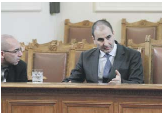
► Вътрешният министър Цветан Цветанов