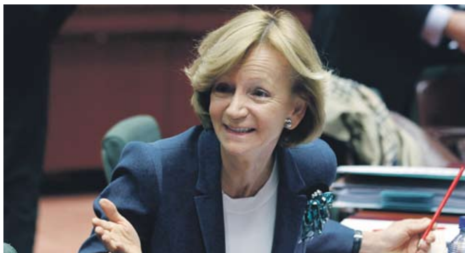
► Финансовият министър Елена Салгадо се надява мерките да стимулират икономическата дейност в страната

До 28 януари кабинетът ще внесе проектозакона