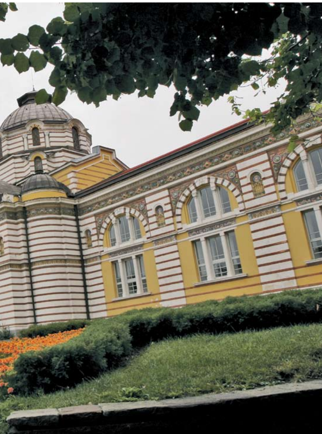
да отгаде част от банята на концесия