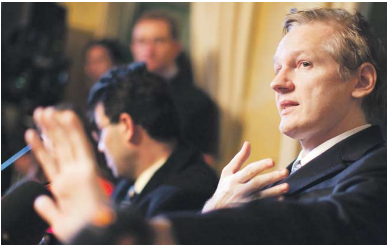
► Секретните документи, които основателят на сайта WikiLeaks Джулиан Асанж публикува, разсържиха политиците по света

През последните няколко дни WikiLeaks създаде международен дипломатически скандал, като публикува стотици поверителни секретни документи, в които се описват личните оценки на американски дипломати