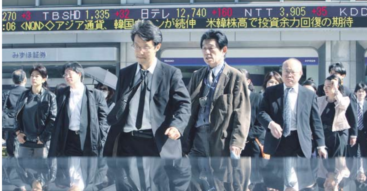
► След голямото поскъпване на йената през миналата седмица сега инвеститорите събират печалбите си

близо 50% от брутния вътрешен продукт на страната. От Dow Jones Newswires определиха намесата на банката като неизбежна, ако двойката долар/йена се задържи на нива 85 USD/JPY. На малко по-различно мнение са анализаторите от Bank