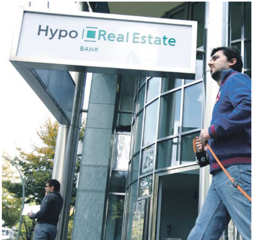
► Hypo Real Estate беше национализирана, след като получи мощна финансова подкрепа от правителството по време на кризата

► Според анализатори, ако HRE не издържи проверката, това ще повиши доверието на пазара в стрес тестовите, без да се отрази на банката, тъй като специалният ѝ статут е известен.