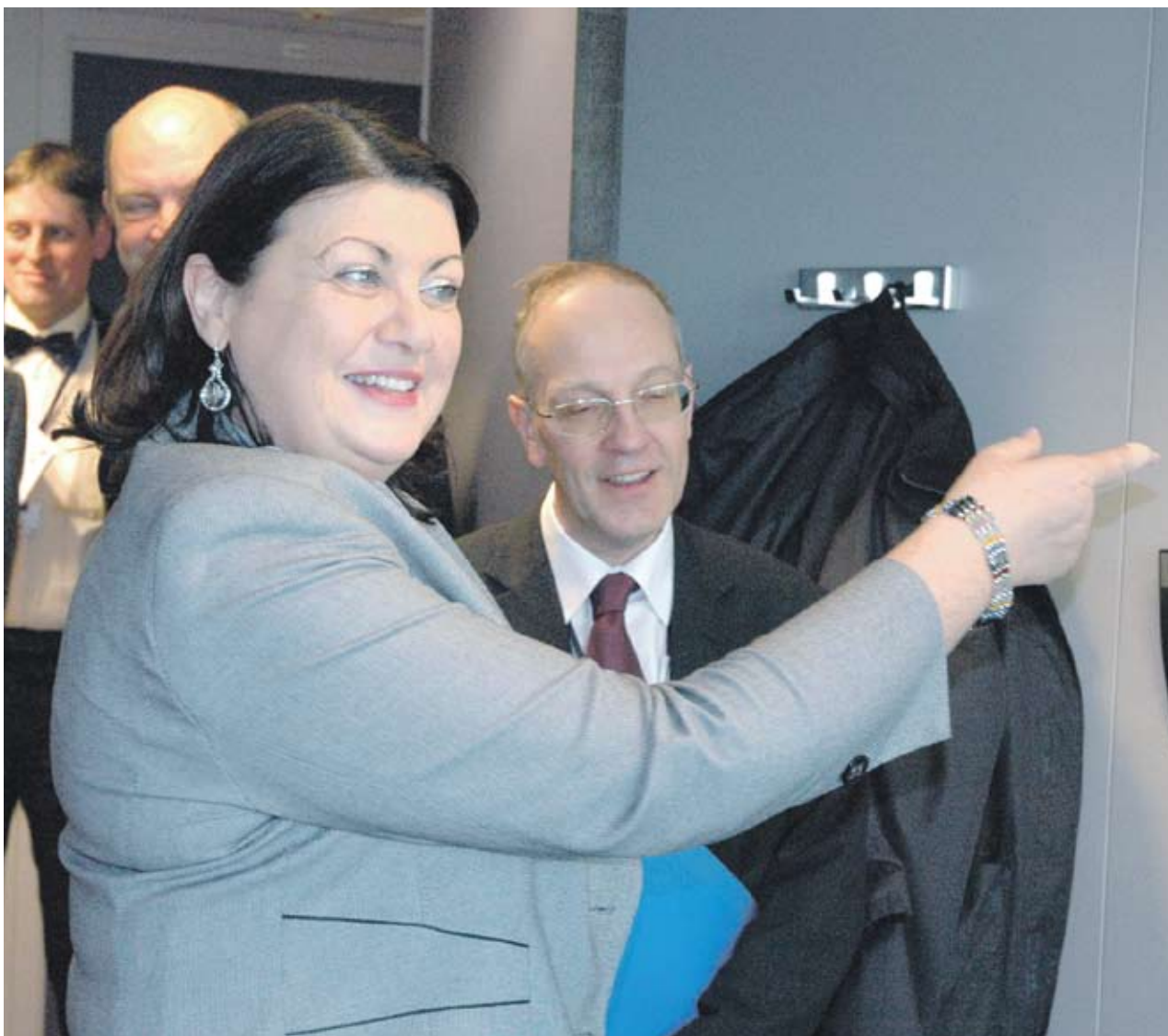
► Мойра Гейгън-Куин, еврокомисар по научните изследвания и иновациите, настоява за бързо внедряване на иновациите в практиката

Фондът за иновации е част от водещата програма на ЕС, наречена “Съюз за иновации”, която ще започне да действа от есента.