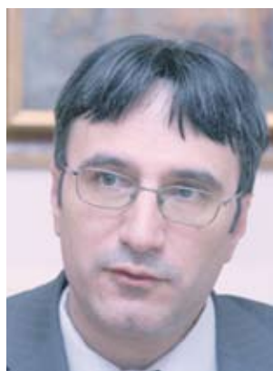
► Министър Трайчо Трайков се срещна във Виена с висшия мениджмънт на OMV AG

С реализацията на газовата връзка между България и Турция на практика ще се даде реален старт на проекта "Набуко", е заявил министър Трайков.