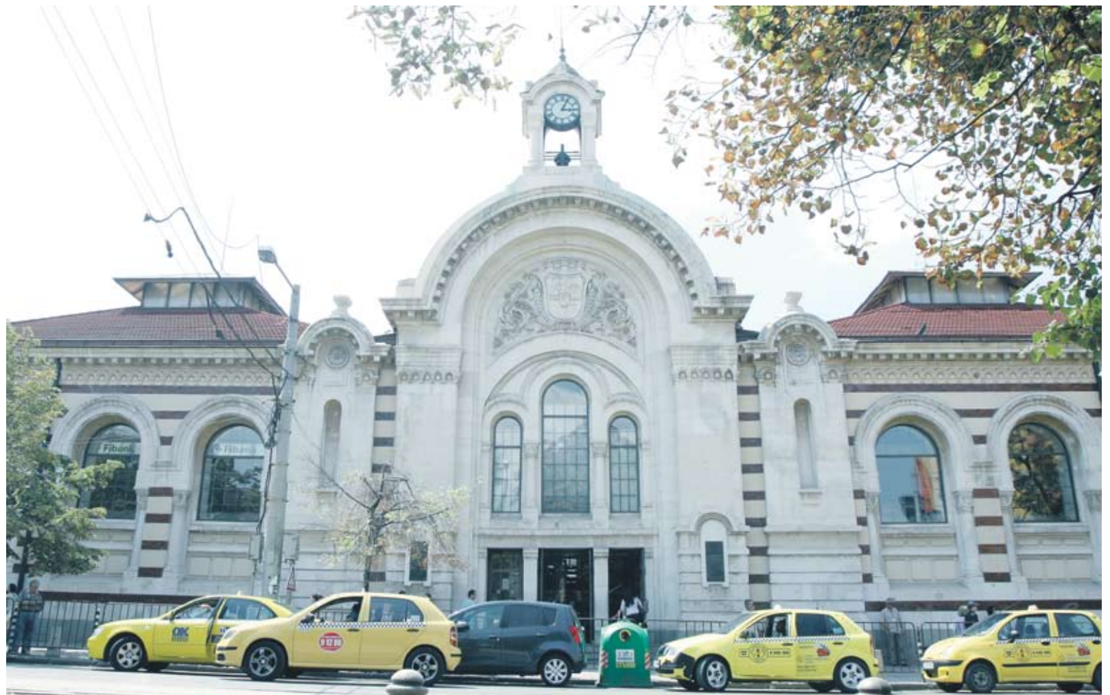
► Скоро Халите ще бъдат изцяло собственост на „Ащром“