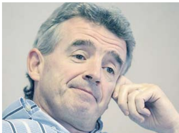
► Главният изпълнителен директор Майкъл О`Лиъри отчете силна конкуренция сред летищата за трафика на Ryanair

Чистата печалба за периода април - юни е спаднала до 93.7 млн. EUR в сравнение със 123 млн. EUR за същото тримесечие на миналата