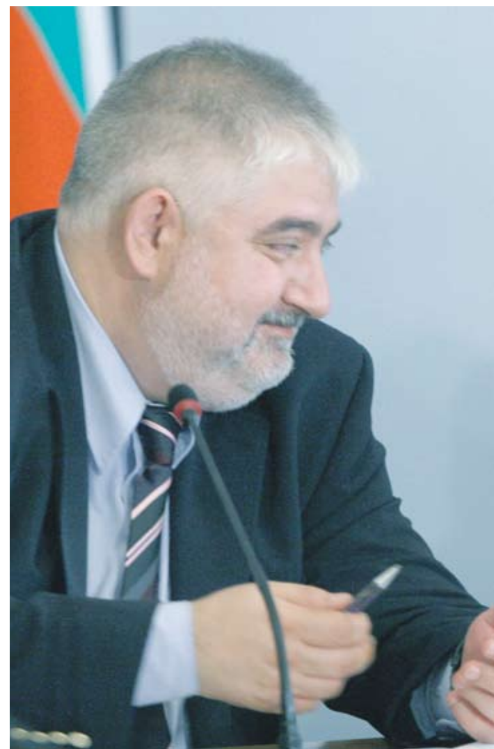
► Доверието към страната ни се върна. Това е га, коментира министърът на правосъдието

Механизмът за сътрудничество и проверка съществува от 2007 г., като основната му цел е да се дава оценка на ангажиментите, поети от България и Румъния в областта на съдебната реформа, борбата с корупцията, а за България и срещу организираната престъпност. „Нашето желание е механизмът да бъде прекратен, защото това ще покаже, че е възможно държавите да се реформират“, коментира говорителят на