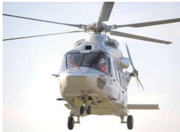
► Пазарът на хеликоптери в света ще се удвои до 2018 г.

Boeing, по-специално подразделенията Sikorsky на United Technologies и Bell Helicopter на Textron. Благодарение на хеликоптерите Cobra, SuperCobra и UH-1Y Super Huey държавните поръчки на компанията през 2009 г. скочиха с 27% до 6.41 млрд. USD. Sikorsky пък прави популярния Black Hawk и неговите разновидности и има поръчки за около 12 млрд. USD. Европейските производители обаче изостават, макар че Eurocopter остава ключов играч със своя Tiger и по-малките си военни модели.