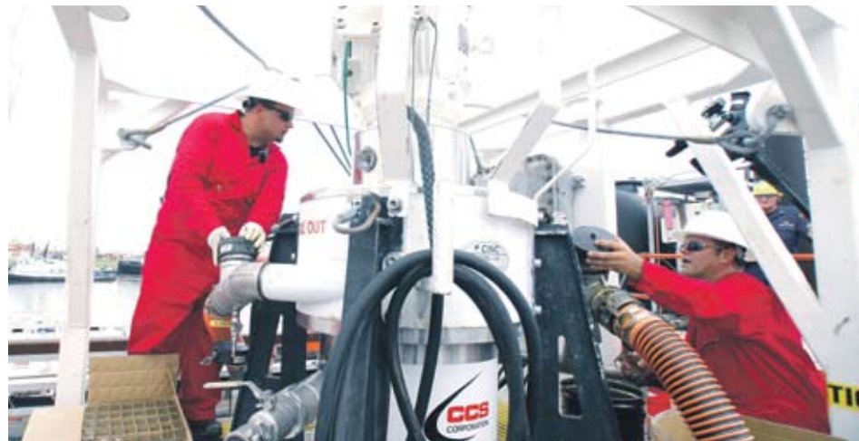
► Лошите финансови резултати на големите американски банки се отразиха зле на петрола

Цената на петрола се понижи под натиска на силния американски долар и потъващите фондови пазари по целия свят. Доларът поскъпна спрямо европейската валута с 0.53% и това почти елиминира въздействието на информацията за понижението на стокови наличности от суров петрол в САЩ. След обявяването на разочароващите финансови резултати на Goldman Sachs Group Inc. фондовите пазари обърнаха рязко посоката и от печеливши по време на европейската сесия се превърнаха в губещи в началото на щатската. Според изнесените данни нетните приходи на