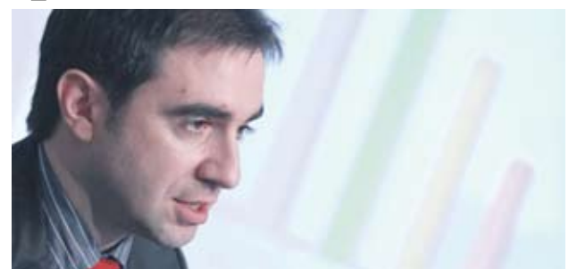
► ИТ е приоритет и за България, казва Първан Русinov, зам.-министър на транспорта, информационните технологии и съобщенията

По част от сферите от обхвата на програмата може да се кандидатства от 20 юли. В тях влизат различни идеи за публично-частни партньорства за проекти, свързани с интернет на бъдещето, сътрудничество между ЕС и Русия и др. За тях може да се кандидатства до 2 декември. Програмата предвижда и втора вълна проекти, крайният срок за които е през януари 2011 г.