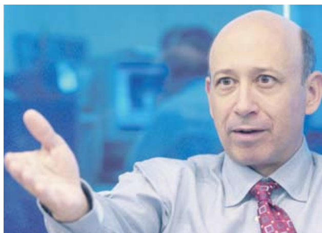
► Пазарната ситуация стана по-трудна напоследък, каза главният изпълнителен директор Лойд Бланкфайн

Компанията отчете извънредна загуба преди данъци от 50 млн. EUR заради отменените от европейските авиационни власти 9400 полета с 1.5 млн. пътници заради вулканичната пепел. Това е само предварителна оценка, тъй като Ryanair все още има да възстановява средства на пътниците.