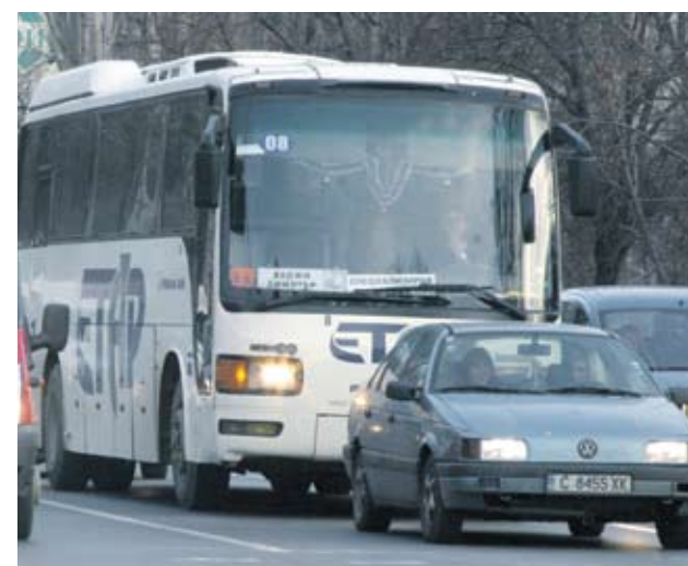
► Освен превоз на пътници „Етап-Адресс“ бутулира и продава минерална вода и е концесионер на Южния плаж в Китен

Причина Индивидуалната загуба на дружеството се стопява до 65 хил. лв., което е спад от