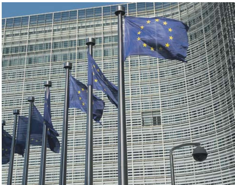
► Въпреки похвалите еврокомисарите ще прогължат да наблюдават как България се справя със съдебната реформа и борбата с корупцията и организираната престъпност